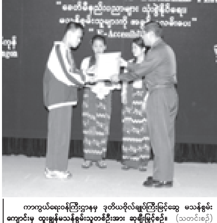
ကာကွယ်ရေးဝန်ကြီးဌာနမှ ဒုတိယဗိုလ်ချုပ်ကြီးမြင့်ဆွေ မသန်စွမ်းကျောင်းမှ ထူးချွန်မသန်စွမ်းသူတစ်ဦးအား ထူးချွန်မြှင့်တင် (သတင်းစဉ်)

နေ့တိုင်ဝင်ဆံ့နိုင်မှု၏ အကျိုးရလဒ်များကို ပိုမိုနားလည် သိမြင်လာစေရန် မသန်စွမ်းသူများဆိုင်ရာ အဖွဲ့အစည်းများနှင့် လူ့အဖွဲ့အစည်း အားလုံးအနေဖြင့် မသန်စွမ်းသူများ အခွင့်အရေးနှင့် စွမ်းဆောင်ရည်များအပေါ် အထူးဂရုပြု အာရုံစိုက်လာစေရန် ဆိုသည့် မှန်မြတ်သည့် ရည်ရွယ်ချက်များဖြင့် အပြည့်ပြည့်ဆိုင်ရာ မသန်စွမ်းသူများနေ့ အခမ်းအနားများကို ကျင်းပလျက်ရှိကြောင်း။ ပြည်ထောင်စု မြန်မာနိုင်ငံတော်အနေဖြင့်လည်း ကုလသမဂ္ဂ၏ လူသားအကျိုးပြု မှန်မြတ်သည့် လုပ်ငန်းဆောင်တာအဝဝတွင် တက်ကြွစွာ ပူးပေါင်းဆောင်ရွက်ခဲ့သည့် အစဉ်အလာကောင်းများနှင့်အညီ မြန်မာ့လူ့အဖွဲ့အစည်းအတွင်းရှိ မသန်စွမ်းသူများ၏ ဂုဏ်သိက္ခာနှင့် စိတ်ဓာတ်မြှင့်တင်ပေးရန်၊ မသန်စွမ်းသူများအဖွဲ့အစည်း တစ်ခုတည်းတစ်ရပ်ဖြစ်ကြောင်း၊ မသန်စွမ်းသူများ၏ ဂုဏ်သိက္ခာနှင့် စိတ်ဓာတ်မြှင့်တင်ပေးရန် ဆိုသည့် ရည်ရွယ်ချက်များဖြင့် အပြည့်ပြည့်ဆိုင်ရာ မသန်စွမ်းသူများနေ့ အခမ်းအနားများကို နှစ်စဉ် ဒီဇင်ဘာလ ၃ ရက်နေ့ကျကျကျကျတိုင်း အစဉ်အလာမပြုက် ဂုဏ်ပြုကျင်းပလာခဲ့သည်မှာ ဤနှစ်တွင် (၁၃)နှစ်ပြည့်မြောက်ခဲ့ပြီဖြစ်ကြောင်း။ မြန်မာ့ယဉ်ကျေးမှုအစဉ်အလာ မိမိတို့မြန်မာနိုင်ငံ၏ မိမိ(ပေ)လယဉ်ကျေးမှုမလေ့ထုံးတမ်း အစဉ်အလာများအရ အဘိုး၊ အဘွား၊ အမိ၊ အဖ၊ သားသမီး မြေးမြန်းများသည် နိုင်ငံပြည် မိသားစုအတွင်း ၂၃ နှစ် သို့မဟုတ် အေးအထူ ၂၃ နှစ် လက်ရည်