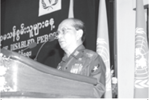
နိုင်ငံတော်အေးချမ်းသာယာရေးနှင့် ဖွံ့ဖြိုးရေးကောင်စီ အတွင်းရေးမှူး(၁) ဒုတိယဗိုလ်ချုပ်ကြီးသိန်းစိန် အပြည်ပြည်ဆိုင်ရာ မသန်စွမ်းသူများနေ့ အထိမ်းအမှတ် အခမ်းအနားတွင် အမှာစကားပြောကြားစဉ်။ (သတင်းစဉ်)