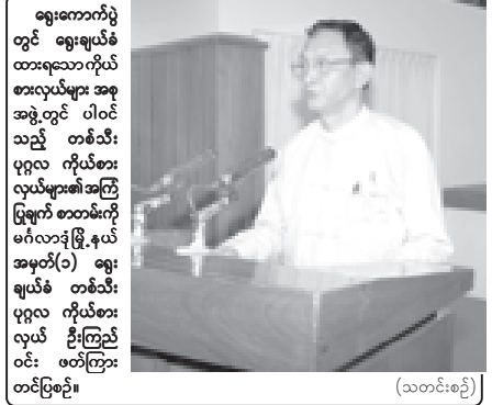
(သတင်းစဉ်)

ဆန္ဒမေးပိုင်ခွင့်ရှိသူများအားလုံးအား မိမိတို့ကို ကိုယ်စားပြုတဲ့ ကိုယ်စားလှယ်များကို ရွေးကောက်တင်မြှောက်ခွင့် ဆန္ဒမေးပေးသင့်သော်လည်း အောက်ပါ ပုဂ္ဂိုလ်များအား ဆန္ဒမေးပေးခွင့် မပြုသင့်ပါ။