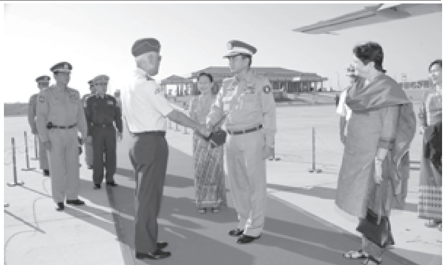
ကာကွယ်ရေးဦးစီးချုပ်(လေ) ဒုတိယဗိုလ်ချုပ်ကြီးမြတ်ဟိန်း နေပြည်တော် အိန္ဒိယသမ္မတနိုင်ငံ လေတပ်ဦးစီးချုပ် Air Chief Marshal S.P Tyagi, PVSM, AVSM, VM, ADC, Chairman, Chief of Staff Committee and Chief of the Air Staff အား နေပြည်တော်လေဆိပ်တွင် ဝိုင်းဆောင်နုတ်ဆက်စဉ်။ (သတင်းစဉ်)