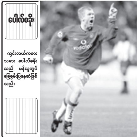
ပေါလ်စဗိုး

စပါးနှင့် ဝီကန် အိမ်ကွင်းကစားအားကောင်းသည့် စပါးကို ဝီကန်တို့အနိုင်ရနေရာမှ အောင်ချက်နည်းလှသည်။ စပါးတွင် ကစားသမားကောင်းများရှိနေရာ ဒီဖိုး၊ မီဒီနှင့် ဂါလေတို့က တစ်ကွင်းလုံး လိုက်ပါကစားနိုင်ကြသည့်စပါးနည်းပြ မာတင်ဂျီးက တစ်ဖက်အသင်း ကစားအားကို ကြည့်ပြီး နည်းဗျူဟာ ပြောင်းလဲကစားနိုင်သူဖြစ်ရာ ဝီကန်ကို အိမ်ကွင်း၌ နိုင်ပွဲရအောင်ကစားမည်သာဖြစ်သည်။