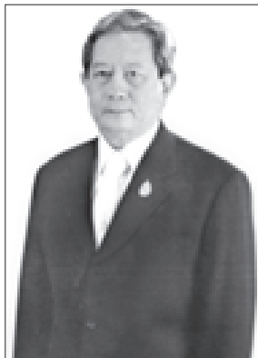
ထိုင်းနိုင်ငံန်ကြီးချုပ် ပိုလ်ချုပ်ကြီး ဂူရာယုန်း၊ ချူလာနွန်

ပိုလ်ချုပ်ကြီး ဂူရာယုန်း၊ ချူလာနွန်သည် ၁၉၄၃ခုနှစ် ဩဂုတ် ၂၈ ရက်တွင် မွေးဖွားခဲ့သည်။ ၎င်းသည် ထိုင်းဘုရင့်စစ်တက္ကသိုလ်သို့ လည်းကောင်း၊ ဗဟိုတိုက်ခိုက်ရေး သင်တန်းကျောင်းသို့လည်းကောင်း၊ ပူးတွဲစစ်ဦးစီးတက္ကသိုလ်သို့လည်းကောင်း တက်ရောက်အောင်မြင်ခဲ့သည်။ ထို့အပြင် ၎င်းသည် အမေရိကန်ပြည်ထောင်စုရှိ ကာကွယ်ရေးဝန်ကြီး ဌာနမှ ဖွင့်လှစ်ခဲ့သည့် စီမံခန့်ခွဲရေးဆိုင်ရာ အစီအစဉ်သို့လည်းကောင်း၊ စစ်ဦးစီးတက္ကသိုလ်သို့လည်းကောင်း တက်ရောက်ခဲ့သည်။ ၁၉၉၃ခုနှစ်တွင် ၎င်းသည် ထိုင်းနိုင်ငံ ကာကွယ်ရေးတက္ကသိုလ်သို့ တက်ရောက်ခဲ့သည်။ ၎င်းသည် ထိုင်းဘုရင့်တပ်မတော်တွင် တာဝန်ထမ်းဆောင်စဉ် အထူးစစ်ဆင်ရေးဌာနချုပ်၏ ဌာနချုပ်မှူးအဖြစ် လည်းကောင်း၊ ထိုင်း အမှတ်(၂)ကြည်းတပ်၏ တိုင်းမှူးအဖြစ်လည်းကောင်း၊ ထိုင်းဘုရင့် ကြည်းတပ်၏ဦးစီးချုပ်အဖြစ်လည်းကောင်း၊ အငြိမ်းစားယူသည့် ၂၀၀၃ ခုနှစ်အထိ ထိုင်းဘုရင့်တပ်မတော်၏ စစ်သေနာပတိချုပ်အဖြစ် လည်းကောင်း အမှုထမ်းဆောင်ခဲ့သူဖြစ်သည်။ ၎င်းသည် ၂၀၀၃ခုနှစ်တွင် အာနန္ဒာမတီဒေါ်လ်အဖွဲ့အစည်း၏ အမှုဆောင်အဖွဲ့ဝင်အဖြစ်လည်းကောင်း၊ ၂၀၀၃ခုနှစ် နိုဝင်ဘာ ၁၄ ရက်မှ စတင်ပြီး ဘုရင့်အတိုင်ပင်ခံကောင်စီအဖွဲ့ဝင်အဖြစ် လည်းကောင်း ဆောင်ရွက်နေသူဖြစ်သည်။ ၎င်းသည် ၂၀၀၆ ခုနှစ် အောက်တိုဘာ ၁ရက်တွင် ထိုင်းနိုင်ငံ၏ ၂၄ဦးမြောက် ဝန်ကြီးချုပ် အဖြစ် ခန့်အပ်ခြင်းခံခဲ့ရသည်။ ၎င်းသည် ခွန်ရင်ချစ်ရာဝါဒီ ချူလာနွန်နှင့် အိမ်ထောင်ပြုခဲ့သည်။ (သတင်းစဉ်)