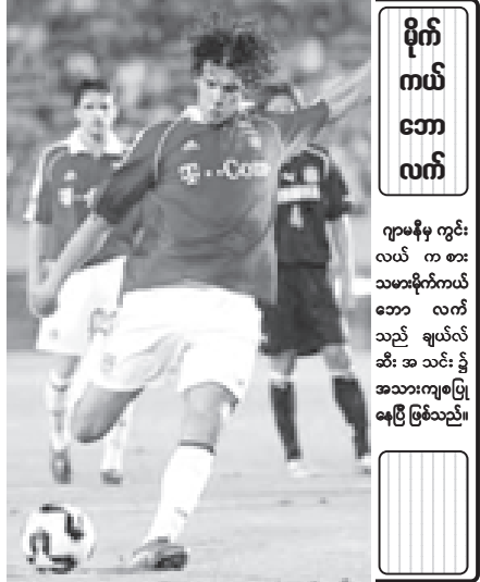
မိုက်ကယ်ဘောလက်

ချာလ်တန်နှင့် အဲဗာတန် မနှစ်က ဂိုးမရှိသရေဖြစ်ခဲ့သော်လည်း လက်ရှိခြေစွမ်းအရ ချာလ်တန်တို့ သရေဆိုင်သည့်ရလဒ်ကိုပင် မမျှော်မှန်းနိုင်ချေ။ ဒါရင်ဘင်တစ်ဦးသာ ဂိုးသွင်းနိုင်စွမ်းရှိပြီး ကျန်တိုက်စစ်မှူးများက ဂိုးသွင်းမသေချာသည့်ဖြစ်ရာ အဲဗာတန်ကို ခြေရည်ထွက်စားရန်ပင်