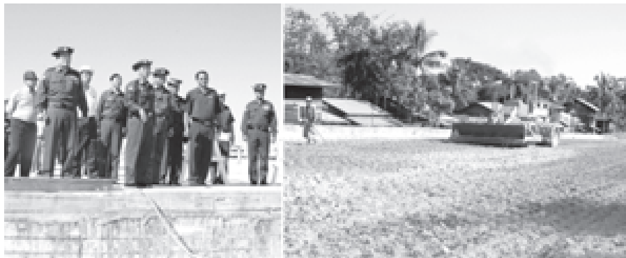
ကာကွယ်ရေးဝန်ကြီးဌာနမှ ဒုတိယဗိုလ်ချုပ်ကြီးမြင့်ဆွေ ငမိုးရိပ်တံတား(ကမာကြည်) ချဉ်းကပ်လမ်း ဖောက်လုပ်နေမှုအခြေအနေကို ကြည့်ရှုစစ်ဆေးစဉ်။

ယင်းနောက် ဒုတိယဗိုလ်ချုပ်ကြီး ရဲမြင့်သည် တန့်င်းတပ်နယ်ခန်းမ၌ တန့်င်းတပ်နယ်ရှိ အရာရှိ၊ စစ်သည်၊ မိသားစုဝင်များအား တွေ့ဆုံ၍ စိုက်ပျိုး၊ မွေးမြူရေးကို ဒေသခံ တိုင်းရင်းသား ပြည်သူများအတွက် စံနမူနာပြုဆောင်ရွက်ရေး၊ ဒေသနှင့် ကိုက်ညီမညီစပါးနှင့် အခြားနစ်ရှည်သီးနှံများကို လည်း စိုက်ပျိုးကြပေးရန် ဒေသဖွံ့ဖြိုးရေးလုပ်ငန်းများ ပိုင်းဝန်းဆောင်ရွက်ရေး မှာကြားကာ တက်ရောက်လာကြသူများအား ရင်းရင်းနှီးနှီး နှုတ်ဆက်သည်။ (သတင်းစဉ်)