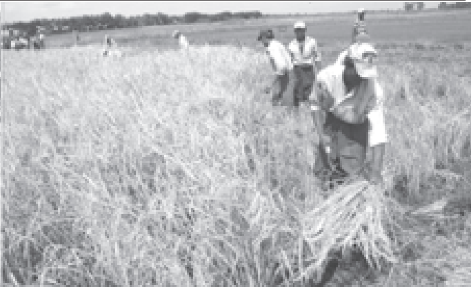
နိုင်ငံတော်အေးချမ်းသာယာရေးနှင့်ဖွံ့ဖြိုးရေးကောင်စီဝင် ကာကွယ်ရေးဝန်ကြီးဌာနမှ ဒုတိယဗိုလ်ချုပ်ကြီးခင်မောင်သန်း မအူပင်မြို့နယ် လေသာကျေးရွာအနီးရှိ ညောင်ပုရိုက်ပျိုးရေးပညာပေးစခန်းတွင် စပါးများ ရိုက်သိမ်းခြွေလှေ့နေမှုကို ကြည့်ရှုအားပေးစဉ်။ (သတင်းစဉ်)