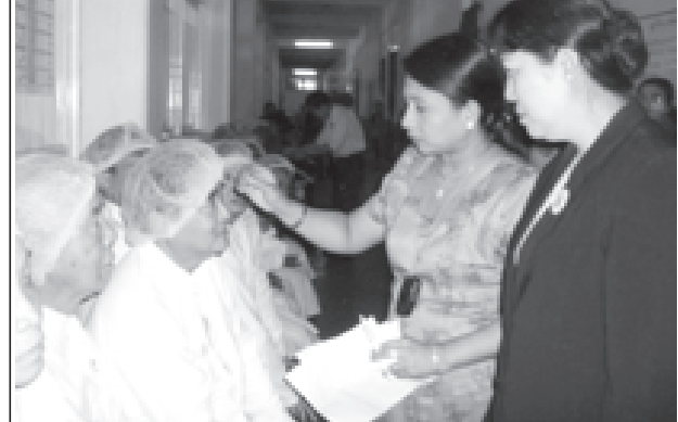
တောင်ကြီးမြို့ စစ်ထွန်းဆေးရုံတွင် ရန်ကုန်မြို့မှ မျက်စိအထူးကု ဆရာဝန်ကြီးများ ခွဲစိတ်ရန် စောင့်ဆိုင်းနေသူများအား စစ်ဆေးကြည့်ရှုကစဉ်။

“အလင်းရောင်”ဟူသည့် လူတိုင်းမျှော်လင့် တောင့်တနေသော အရာတစ်ခုပင်။ လူသားတိုင်းစကြူအာရုံမျက်လုံးအစုံ၏ အလင်းဓာတ်ကို ရာနှုန်းပြည့် ရယူပိုင်ဆိုင်လိုကြပေသည်။ မည်သည့်နိုင်ငံ၊ မည်သည့်ဒေသတိုင်းမဆို မျက်စိအတွင်းတိမ်၊ ရေတိမ်စသည့်