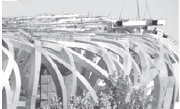
တရုတ်နိုင်ငံ ပေကျင်းမြို့၌ ဆောက်လုပ်ဆဲ အမျိုးသားအားကစားရုံကို နိုဝင်ဘာ၁၄ရက်က တွေ့ရပုံ။

မိလစ်ပိုင်နိုင်ငံသည် နှစ်စဉ် တိုင်းဖွန်း မုန်တိုင်း ၂၀ခန့် ဝင်ရောက်တိုက်ခတ်ခြင်း ခံရလေ့ရှိသော နိုင်ငံတစ်နိုင်ငံလည်းဖြစ်သည်။