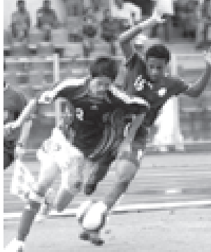
ဂျပန်အသင်းမှ ယူဂို(ဝဲ)၏ ထိုးဖောက်ကစားမှုကို ဤသို့ တွေ့ရသည်။

လာဗွန်နီ အာရှဖလားပြိုင်ပွဲအတွက် ခြေစစ်ပွဲများကို နိုဝင်ဘာ ၁၇ရက် ညပိုင်းက ယှဉ်ပြိုင်ကစားခဲ့ကြရာ အုပ်စု(က)မှ ဂျပန်အသင်းသည် ဆော်ဒီအာရေဗျအသင်းကို သုံးဂိုး-တစ်ဂိုးဖြင့် အနိုင်ရပြီး အုပ်စုထိပ်ဆုံးနေရာတွင် ရောက်ရှိလာသည်။