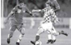
ခရိုအေးရှားအသင်းမှ လူကာမိုရစ် (ယာ) နှင့် အစ္စရေးမှ ပါလစ်ဘာဒီယာ တို့၏ ယှဉ်ပြိုင်ကစားမှုကို ဤသို့ တွေ့ရသည်။

ယူဂို၂၀၀၈ခြေစစ်ပွဲ ပွဲစဉ်(၄)လက်ကျန်ပွဲများအဖြစ် မက်ဆီဒိုးနီးယားအသင်းနှင့် ရုရှားအသင်းတို့ နိုဝင်ဘာ ၁၇ရက်ညပိုင်းက ယှဉ်ပြိုင်ကစားရာတွင် ရုရှားအသင်းက ၃-၀ ဂိုး-ဂိုးမရှိဖြင့် အနိုင်ရခဲ့သည်။