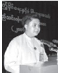
ကျောင်းနေအရွယ်ကလေးများ ကျောင်းအပ်နှံရေးလုပ်ရာဆောင်ရွက်မှုအနေ ဖြင့် သာယာဝတီခရိုင်အတွင်းရှိ မြို့နယ်ရှိမြို့နယ်မှ ချို့တဲ့သောကျောင်းသား

ပဲခူးတိုင်း(အနောက်ပိုင်း)၁၄ မြို့နယ်အတွင်းရှိ အခြေခံပညာမူလတန်း ကျောင်းပေါင်း ၁၈၇ ကျောင်းရှိ ကျောင်းသား ကျောင်းသူများအတွက် စာရေးနံ အနိမ့် ၁၈၄ နံ၊ အမြင့် ၂၅၂၅ နံ စုစုပေါင်းတန်ဖိုးငွေကျပ် ၁၃၅၂၀၀၀ တို့ကို တိုင်းအသင်းက လှူဒါန်းပေးနိုင်ခဲ့ကြောင်း။