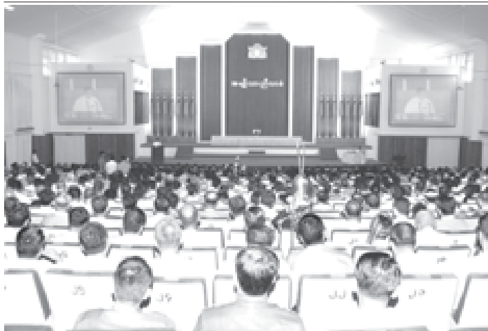
အမျိုးသားညီလာခံ စုံညီအစည်းအဝေးကို ရန်ကုန်တိုင်း မှော်ဘီမြို့နယ်၊ သောင်နှစ်ပင်စခန်းရှိ မြည်ထောင်စု ခန်းမ၌ ကျင်းပစဉ်။ (သတင်းပုံ)