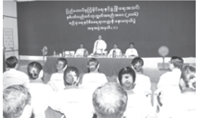
အမှာစကားပြောကြားပြီးနှီးနှောဖလှယ်ပွဲ ကို မွန်းလွှဲတွင် ရပ်သိမ်းလိုက်သည်။

ထို့နောက် နိုင်ဘာ၄ ရက်တွင် ကျင်းပခဲ့သော “ပညာရေးရာ၊ လူမှုရေး နှင့် ယဉ်ကျေးမှုရေးရာကဏ္ဍ” နှီးနှော ဖလှယ်ပွဲ၌ ပြည်နယ်နှင့်တိုင်းများမှ ပြည်ထောင်စုကြံ့ခိုင်ရေးနှင့် ဖွံ့ဖြိုးရေး အသင်းကိုယ်စားလှယ်များ၏ တင်ပြ ချက်များကို ဝိုင်းဝန်းပေါင်းစည်းနှိုင်း ကြပြီး အစုအဖွဲ့၏ “ပညာရေးရာ၊ လူမှုရေးနှင့်ယဉ်ကျေးမှုရေးရာကဏ္ဍ” တင်ပြချက်များမှ တွေ့ရှိချက်များကို