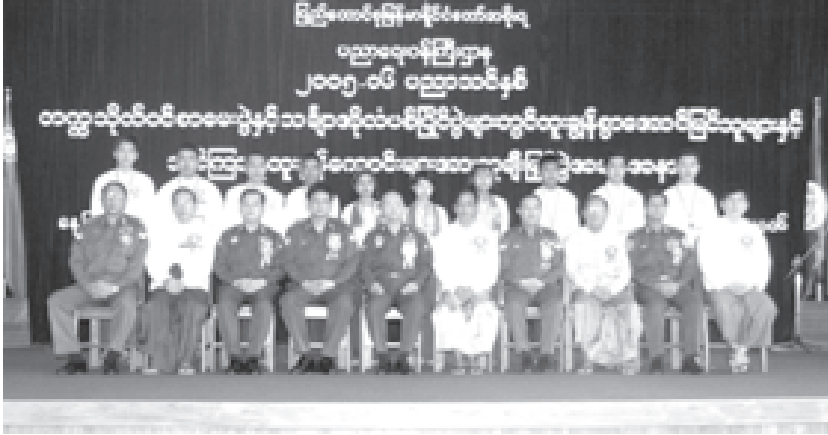
မြန်မာနိုင်ငံ ပညာရေးကော်မတီတစ်ရပ်က နိုင်ငံတော်အေးချမ်းသာယာရေးနှင့် ဖွံ့ဖြိုးရေးကောင်စီ အတွင်းရေးမှူး(၁) ဒုတိယဗိုလ်ချုပ်ကြီးသိန်းစိန်နှင့် အဖွဲ့ဝင်များ ၂၀၀၅-၂၀၀၆ ပညာသင်နှစ် တက္ကသိုလ်ဝင်စာမေးပွဲနှင့် ပဉ္စမအကြိမ် သင်္ချာအိတ်ပစ်ပြိုင်ပွဲတွင် ထူးချွန်စွာ အောင်မြင်ခဲ့ကြသည့် ကျောင်းသား ကျောင်းသူများနှင့် မှတ်တမ်းတင်စာတံပို့ရက်ကြစဉ်။

ဘာသာတွဲ အုပ်စုအလိုက် အဆင့်(၁)မှ(၁၀)အတွင်းရရှိကြသော ကျောင်းသားကျောင်းသူများ၊ ပဉ္စမအကြိမ် သင်္ချာအိတ်ပစ်ပြိုင်ပွဲတွင် ထူးချွန်စွာအောင်မြင်ခဲ့ကြသည့် ကျောင်းသား ကျောင်းသူများ၊ နေပြည်တော်ရှိအခြေခံပညာကျောင်းများမှ ဆရာဆရာမများနှင့် ကျောင်းသားကျောင်းသူများ တက်ရောက်ကြသည်။