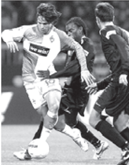
ဝါဒါဘရီမင်နှင့် ခေါ်မှန်တို့ပွဲတွင် ဝါဒါဘရီမင်မှ ဒီဂို (၆) ထိုးဖောက်ကစားဟန်။

ဒုတိယပိုင်း ပွဲချိန်စတင်သည်နှင့် ခေါ်မှန်တို့ ကစားအားတင်ခဲ့ရာ ပွဲချိန် ၅၃ မိနစ်၌ ခေါ်မှန်ကွင်းလယ်ကစားသမား တင်ဂါက တစ်ဂိုးနှင့် ပွဲချိန် ၈၇ မိနစ်၌ ယန်နယ်တိုဖြစ်သော မုတစ်ဆင့် ကွင်းလယ်ကစားသမား ခရစ္စတော့က ဂိုးသွင်းယူနိုင်ခဲ့သဖြင့် ခေါ်မှန်တို့ သုံးဂိုး-တစ်ဂိုးဖြင့် အနိုင်ရရှိခဲ့ခြင်းဖြစ်သည်။ ဝါဒါဘရီမင်သည် အိမ်ကွင်း၌ မိမိ၏စီးကစားခဲ့ရာ ဂိုးသွင်း နှင့် ဘွီကြိမ်ရရှိခဲ့ပြီး ရုတ်တရက်သော ခေါ်မှန်ပွဲနှင့် နှစ်ပွဲ သရေ သုံးပွဲပွဲဖြင့်