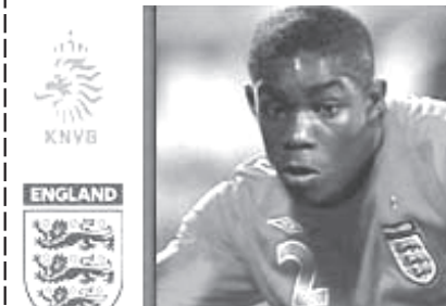
မန်ချက်စတာတီးအသင်းမှ နောက်တန်းခံစစ်မှူး ရစ်ချက်စ်။

တန်းစီးစာရင်း ထိပ်ဆုံးတွင် ဦးဆောင်နေဆဲဖြစ်သည်။ ခေါ်မှန်သည် ယခုပွဲ အနိုင်ရရှိခဲ့သဖြင့် ၁၂ ပွဲ ကစား၊ လေးပွဲ နိုင်၊ ခြောက်ပွဲသရေ၊ နှစ်ပွဲရှုံးဖြင့် တန်းစီးစာရင်း စတုတ္ထနေရာ၌ ရှိနေသည်။ (အင်တာနက်)