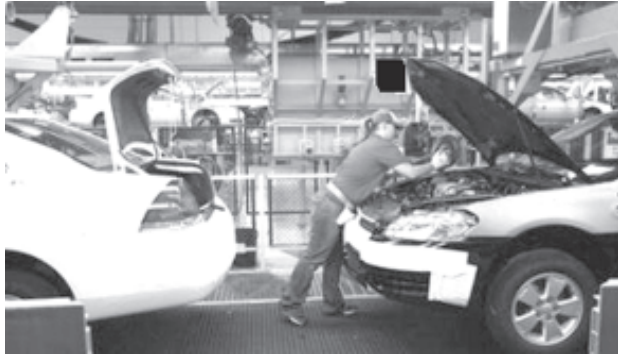
ကနေဒါနိုင်ငံ အောက်ပီမြို့ရှိ ဂျီအမ်ကားထုတ်လုပ်ရေးစက်ရုံ၏လုပ်ငန်းခွင်တစ်နေရာကို နိုဝင်ဘာ ၃ရက်က တွေ့ရစဉ်။