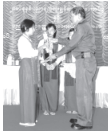
နိုင်ငံတော်အေးချမ်းသာယာရေးနှင့် ဖွံ့ဖြိုးရေးကောင်စီဝင် ကာကွယ်ရေးဝန်ကြီးဌာနမှ ဒုတိယဗိုလ်ချုပ်ကြီးကျော်ဝင်း ရမ်းပြည်နယ်(မြောက်ပိုင်း) ၂၀၀၆ ခုနှစ် တက္ကသိုလ်ဝင် စာမေးပွဲတွင် မြောက်ဘာသာဂုဏ်ထူးဖြင့် အောင်မြင်သော လားရှိုးမြို့ အမှတ်(၆) အခြေစိုက်ပညာအထက်တန်း ကျောင်းမှ မဃသုတ္တန်နှင့် ငါးဘာသာဂုဏ်ထူးရင် ၁၃ ဦးတို့အား ဂုဏ်ပြုဆုများ ပေးအပ်ချီးမြှင့်ပွဲ။ (သတင်းစဉ်)

ဆက်လက်၍ ၂၀၀၆ ခုနှစ် တက္ကသိုလ်ဝင်စာမေးပွဲတွင် သုံးဘာသာ ဂုဏ်ထူးဖြင့် အောင်မြင်ကြသော ကျောင်းသား ကျောင်းသူကိုးဦးနှင့် လူမှုဝန်ထမ်း ဦးစီးဌာန လူငယ်သင်တန်းကျောင်းမှ ထူးချွန်ကျောင်းသား မောင်အိုက်နိုင် တို့အား အရှေ့မြောက်တိုင်းစစ်ဌာနချုပ် ဒုတိယတိုင်းမှူး ဗိုလ်မှူးချုပ်လှမြင့်က ဆုများ ပေးအပ်ချီးမြှင့်သည်။ စာမျက်နှာ ၁ ကော်လံ ၁ ■