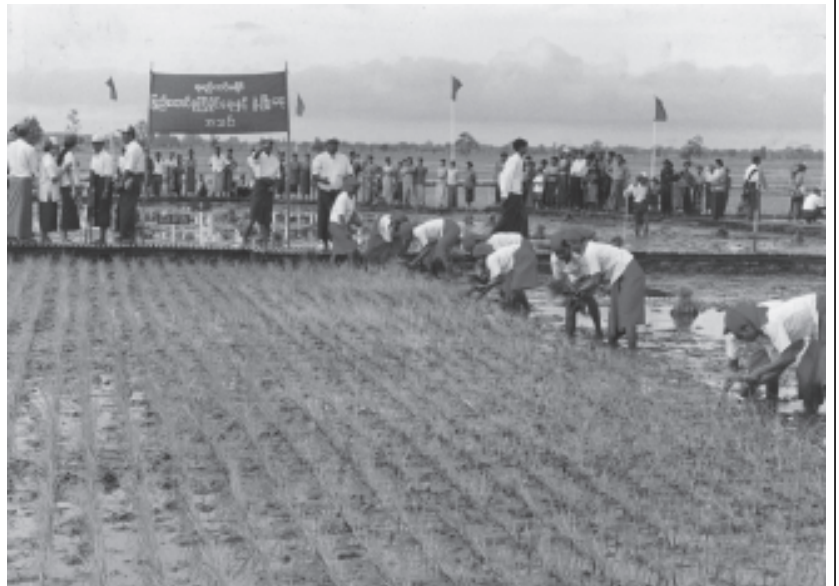
ပြည်ထောင်စုကြံ့ခိုင်ရေးနှင့် ဖွံ့ဖြိုးရေးအသင်း နှစ်ပတ်လည် သင်းလုံးကျွတ်အစည်းအဝေး(၂၀၀၆)ကို ဂုဏ်ပြုသောအားဖြင့် ရမည်းသင်းခရိုင် ပြည်ထောင်စုကြံ့ခိုင်ရေးနှင့် ဖွံ့ဖြိုးရေးအသင်းမှ ဓမ္မစပါးစိုက်ပျိုးရေးသင်တန်းကို ဤသို့ တွေ့ရသည်။

ဆိုသော လူငယ်ကတိသစ္စာငါးရပ်ကို နိုင်ငံခြံမာမာ ချမှတ်ခဲ့သည်။ အသင်းကြီး၏ အသင်းဝင် မျိုးဆက်သစ်လူငယ်အားလုံးတို့သည် မိမိတို့ ချမှတ်ထားခဲ့သော လူငယ်ကတိသစ္စာငါးရပ်ကို ကျရာအခန်း ကဏ္ဍမှ အချိန်အခါ နေရာဒေသမရွေး ဆောင်ရွက်လျက်ရှိပေသည်။ အမျိုးသားရေးတာဝန်ကို ဆောင်ရွက်မည့် နိုင်ငံသားကောင်းများပီပီ ဒို့တာဝန် အရင်းသားများကို မမှီတ်မသုန်ခံယူပြီး နိုင်ငံအကျိုး၊ ပြည်သူ့ အကျိုးတို့ကို ဆက်တက်ထမ်းပိုး သယ်ပိုးထမ်းဆောင်လျက်ရှိသော မျိုးဆက်သစ် လူငယ်များသည် နိုင်ငံတော်ရေးရာဆက်သွားမည့် မူဝါဒ လမ်းစဉ်(၇)ရပ် အောင်မြင်ရေးနှင့် အေးချမ်းသာယာပြီး ဓေတိမိဖွံ့ဖြိုး တိုးတက်သော နိုင်ငံတော်သစ်ကြီး ပေါ်ထွန်းလာရေးတို့အတွက် ကျရာ အခန်းကဏ္ဍမှ တက်တက်ကြွကြွ ပါဝင်ဆောင်ရွက်ကြပါရန် တိုက်တွန်း ရေးသားလျက် ပြည်ထောင်စုကြံ့ခိုင်ရေးနှင့်ဖွံ့ဖြိုးရေးအသင်း နှစ်ပတ်လည် သင်းလုံးကျွတ်အစည်းအဝေး(၂၀၀၆)ကိုဂုဏ်ပြုရေးသားလိုက်ပါသည်။ ။