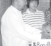
ရန်ကုန်မြို့ ဗဟန်းမြို့နယ် အမှတ် (၈) နတ်မောက်လမ်းရှိ မိုးကုတ် ပိသနာမှာ အဖွဲ့ချုပ်ကြီး၌ တစ်လ နှစ်ကြိမ် ကျင်းပလုပ်ဆောင်သော ၁၀ ရက် တရားစခန်းပွဲအဖြစ် နိုဝင်ဘာ ၃၀ ရက်နေ့မှ ၂၀ ရက်နေ့အထိ ကျင်းပမည်ဖြစ်သည်။

ရန်ကုန် နိုဝင်ဘာ ၆ ရန်ကုန်မြို့ ဗဟန်းမြို့နယ် အမှတ် (၈) နတ်မောက်လမ်းရှိ မိုးကုတ် ပိသနာမှာ အဖွဲ့ချုပ်ကြီး၌ တစ်လ နှစ်ကြိမ် ကျင်းပလုပ်ဆောင်သော ၁၀ ရက် တရားစခန်းပွဲအဖြစ် နိုဝင်ဘာ ၃၀ ရက်နေ့မှ ၂၀ ရက်နေ့အထိ ကျင်းပမည်ဖြစ်သည်။ ယင်းတရားစခန်းပွဲကြီးတွင် စစ်ကိုင်း ဆရာတော် ဘဒ္ဒန္တသုမနအရှင်သုမြတ် က ကျေးဇူးတော်ရှင် အဂ္ဂမဟာပဏ္ဍိတ မိုးကုတ်ဆရာတော်ကြီး၏ ဥပနိသယ အတိုင်း ဓမ္မဉာဏ်ရောက် ပဋိပညာမဟုတ် နှင့် သစ္စာလေးပါး တရားတော်များ ကျေးဇူးတော်ဖြင့် ဖြစ်သည်။ အသေး စိတ် သိလိုပါက ဖုန်း ၇၄၁၈၆၀ သို့ ဆက်သွယ် ဖုန်းနံပါတ်ကြောင်း သိရသည်။