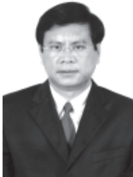
လာအိုပြည်သူ့ဒီမိုကရက်တစ်သမ္မတ နိုင်ငံဝန်ကြီးချုပ် မစ္စတာဘိုဝါဆွန်၊ ဘုမ္မာဝမ်း။

မစ္စတာဘိုဝါဆွန်၊ ဘုမ္မာဝမ်းသည် မဒန်ဆန်လီနှင့် အိမ်ထောင်ပြုခဲ့ပြီး ၎င်းတို့ဇနီးမောင်နှံတွင် သားသမီးလေးဦး ထွန်းကားခဲ့ပါသည်။ (သတင်းစဉ်)