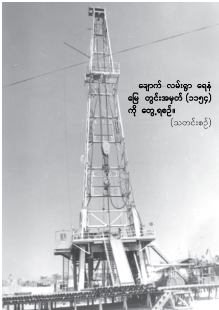
ချောက်-လမ်းရွာ ရေနံ မြေ တွင်းအမှတ် (၁၁၅၄) ကို တွေ့ရစဉ်။ (သတင်းစဉ်)