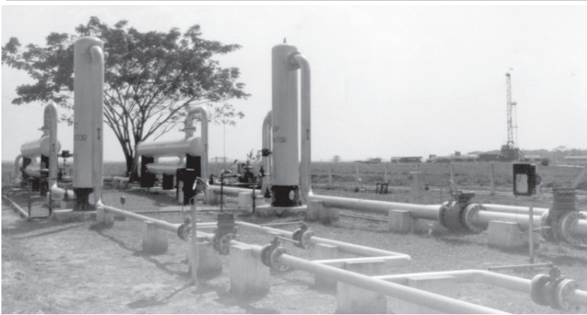
ကမ်းလွန်ဒေသရေနံမြေ