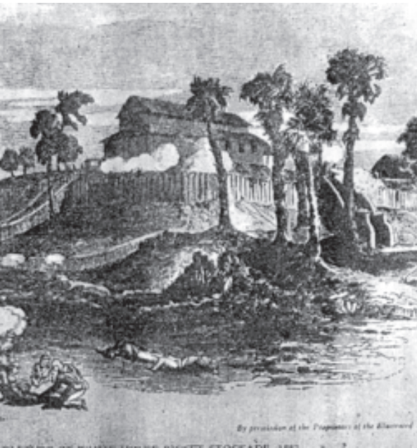
တိုက်ခိုက်သည့် မြန်မာမျိုးချစ်တို့၏ သိမ်းပိုက်တိုက်ပွဲမြင်ကွင်းကို ပန်းချီဖြင့် သရုပ်ဖော်ထားစဉ်။