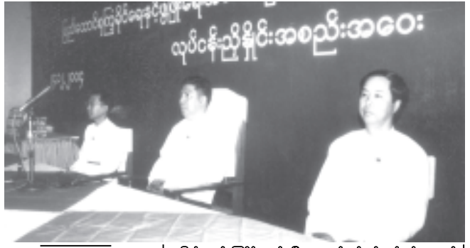
ပြည်ထောင်စုကြံ့ခိုင်ရေးနှင့်ဖွံ့ဖြိုးရေးအသင်း နှစ်ပတ်လည်သင်းလုံးကျွတ်အစည်းအဝေး(၂၀၀၄)၏ ဦးတည်ချက်(၇)ရပ်၊ ရှေ့လုပ်ငန်းစဉ် (၉)ရပ်နှင့် စစ်ကိုင်းတိုင်း ပြည်ထောင်စုကြံ့ခိုင်ရေးနှင့်ဖွံ့ဖြိုးရေးအသင်းက အကောင်အထည်ဖော် ဆောင်ရွက်မည့် ဦးတည်ချက်များ အကောင်အထည်ဖော် ဆောင်ရွက်ရေး လုပ်ငန်းညှိနှိုင်းအစည်းအဝေးတွင် သဘာပတိအဖွဲ့ဝင်များကို တွေ့ရစဉ်။ (သတင်းစဉ်)

ပြည်ထောင်စုကြံ့ခိုင်ရေးနှင့် ဖွံ့ဖြိုးရေးအသင်း နှစ်ပတ်လည်သင်းလုံးကျွတ်အစည်းအဝေး(၂၀၀၄)၏ ဦးတည်ချက်(၇)ရပ်၊ ရှေ့လုပ်ငန်းစဉ် (၉)ရပ်နှင့် စစ်ကိုင်းတိုင်း ပြည်ထောင်စုကြံ့ခိုင်ရေးနှင့်ဖွံ့ဖြိုးရေးအသင်းက အကောင်အထည်ဖော် ဆောင်ရွက်မည့် ဦးတည်ချက်များ အကောင်အထည်ဖော် ဆောင်ရွက်ရေး လုပ်ငန်းညှိနှိုင်းအစည်းအဝေးကို စစ်ကိုင်းတိုင်း မုံရွာမြို့ မြို့တော်ခန်းမ၌ ကျင်းပစဉ်။ (သတင်းစဉ်)