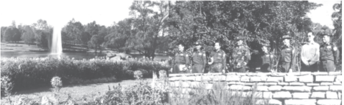
စာမျက်နှာ ၅ မှ

အပြည်ပြည်ဆိုင်ရာ တက္ကသိုလ်များနှင့် ပူးပေါင်းဆောင်ရွက်နေမှုများ၊ ရှေ့ဆက်လက် ဆောင်ရွက်သွားမည့် လုပ်ငန်းများကို ရှင်းလင်းတင်ပြသည်။ ရှင်းလင်းတင်ပြချက်များနှင့်စပ်လျဉ်း၍ ဗိုလ်ချုပ်မှူးကြီးသန်းရွှေက လမ်းညွှန်မှာကြားရာတွင် ပြည်နယ်၊ တိုင်းများ၌ ပေါက်ရောက်လျက်ရှိသော ပရဆေးပင်များကို စုံစုံလင်လင် ထပ်မံစုဆောင်းစိုက်ပျိုးသွားရန် လိုကြောင်း၊ ထို့ပြင် ပရဆေးပင်အလိုက် အစွမ်းထက်မြက်မှုများကိုလည်း စနစ်တကျသုတေသနပြုလုပ်သွားကြရန်ဖြစ်ကြောင်း။