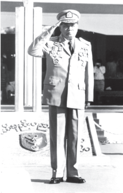
စာမျက်နှာ ၅ မှ

ဦးစားပေးပြီး ကြိုးပမ်းတည်ဆောက်နေပြီဖြစ်တယ်။ ဒီလိုအခြေအနေမျိုးမှာ ရဲဘော်တို့ဟာ တပ်မတော်ရဲ့ သိပ္ပံနဲ့နည်းပညာအခန်းကဏ္ဍ ပိုမိုတိုးတက်အောင် ဆောင်ရွက်ရင်း တစ်ဖက်က ခေတ်မီဖွံ့ဖြိုးတိုးတက်တဲ့ နိုင်ငံတော်ကို ဝိုင်းဝန်း တည်ဆောက်ကြရမယ့် လူသားအရင်းအမြစ်များဖြစ်ကြတယ်။ ဒါကြောင့် ရဲဘော်တို့ဟာ အရပ်ရပ်မှ အရိပ်ထွက်တယ်ဆိုတဲ့စကားအတိုင်း ပင်ကိုအရည် အချင်း ဖြင့်မားအောင် ကြိုးစားကြမှု တို့နိုင်ငံကို စက်မှုနိုင်ငံအဖြစ် တည် ဆောက်ရာမှာ မြန်ဆန်စွာ တိုးတက်ဖြစ်ထွန်းမှုဖြစ်ကြောင်း ပြောကြား လိုတယ်။