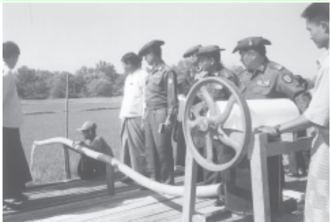
ရန်ကုန် ဒီဇင်ဘာ ၂၄

ဧရာဝတီတိုင်း အေးချမ်းသာယာရေးနှင့်ဖွံ့ဖြိုးရေးကောင်စီဥက္ကဋ္ဌ အနောက်တောင်တိုင်းစစ်ဌာနချုပ် တိုင်းမှူး ဗိုလ်ချုပ်မှီးနိုင်သည် ဌာနဆိုင်ရာ တာဝန်ရှိသူများလိုက်ပါလျက် ဒီဇင်ဘာ ၂၂ ရက် မွန်းလွဲပိုင်းက ပုသိမ်မြို့နယ် တဲကြီးကျေးရွာအနီး ပုသိမ်ခရိုင်အေးချမ်းသာယာရေးနှင့် ဖွံ့ဖြိုးရေးကောင်စီ စိုက်ခင်းတွင် စိုက်ပျိုးထားသော သီးထပ်ရင် နွေစပါး စိုက်ခင်း၌ အနိမ့်ရေတင်ကိရိယာဖြင့် ရေတင်ဆောင်ရွက်နေမှုကို သွားရောက်ကြည့်ရှုစစ်ဆေးရာ ပုသိမ်ခရိုင် အေးချမ်းသာယာရေးနှင့် ဖွံ့ဖြိုးရေးကောင်စီဥက္ကဋ္ဌ ဒုတိယဗိုလ်မှီးကြီးလှသွင်နှင့် စက်မှုလုပ်ငန်းရှင် ဦးချမ်းသာတို့က ငါးသမ ဓလကိမနှင့် စ လက်မ ရေတင်ကိရိယာဖြင့် ရေတင်နေမှုကို သရုပ်ပြရှင်းလင်းတင်ပြရာ တိုင်းမှူးက လိုအပ်သည်များ မှာကြားကြောင်းသတင်းရရှိသည်။ (အပေါ်ပုံ) (ဧရာဝတီတိုင်း)