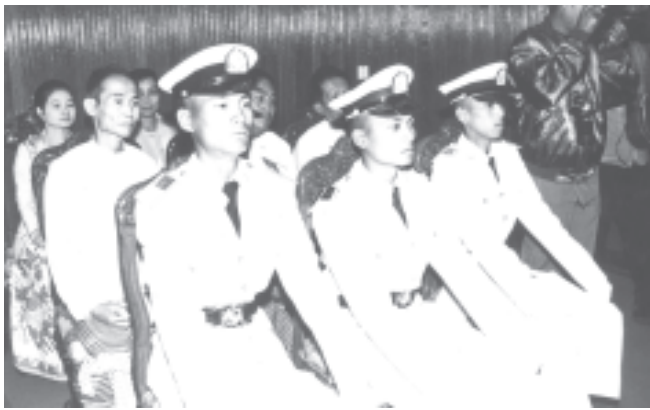
တပ်မတော်ကာကွယ်ရေးဦးစီးချုပ် ဗိုလ်ချုပ်မှူးကြီးသန်းခေါင်နှင့် တပ်မတော်အရာရှိကြီးများ၊ မန္တလေးမြို့တော်ဝန် ဗိုလ်မှူးချုပ်ရန်သိမ်းနှင့် ဌာနချုပ်မှူးချုပ်ရန်သိမ်းတို့ ပူးပေါင်းဆောင်ရွက်နေသည့် အစည်းအဝေးတစ်ရပ်

အဆိုပါအခမ်းအနားသို့ မြိုင်တော်အေးချမ်းသာယာရေးနှင့် ဖွံ့ဖြိုးရေးကောင်စီဝင် ကာကွယ်ရေးဝန်ကြီးဌာနမှ ဗိုလ်ချုပ်ကြီးသုရဇေယျာနု၊ မြိုင်တော်အေးချမ်းသာယာရေးနှင့် ဖွံ့ဖြိုးရေးကောင်စီ အတွင်းရေးမှူး(၁) ဒုတိယဗိုလ်ချုပ်ကြီးသိန်းစိန်၊ မြိုင်တော်အေးချမ်းသာယာရေးနှင့် ဖွံ့ဖြိုးရေးကောင်စီဝင်များဖြစ်သည့် ကာကွယ်ရေးဝန်ကြီးဌာနမှ ဒုတိယဗိုလ်ချုပ်ကြီးရဲမြင့်၊ စစ်တော်ကွယ်ချုပ် ဒုတိယဗိုလ်ချုပ်ကြီးသိန်းလင်းတို့ ပူးပေါင်းဆောင်ရွက်ခဲ့သည်။