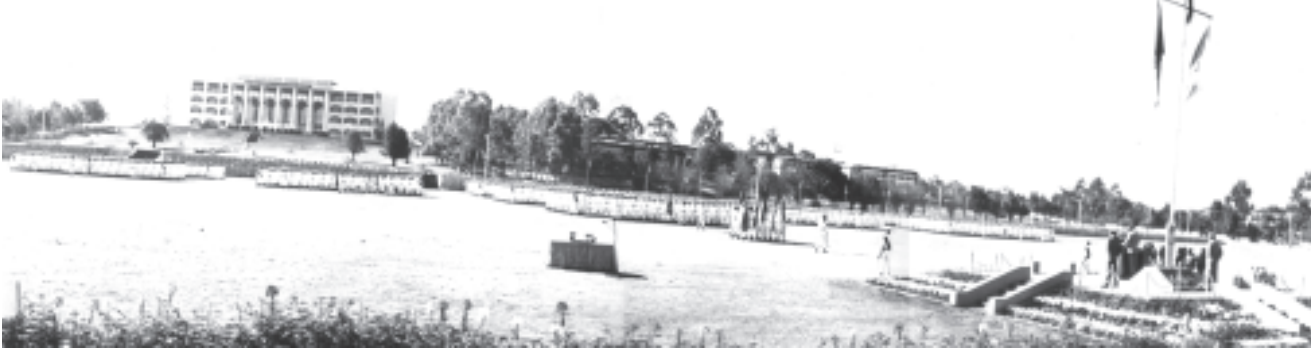
တပ်မတော်ကာကွယ်ရေးဦးစီးချုပ် ဗိုလ်ချုပ်မှူးကြီးသန်းရွှေ တပ်မတော်နည်းပညာတက္ကသိုလ် ဗိုလ်လောင်းသင်တန်း အမှတ်စဉ်(၇)သင်တန်းဆင်းပွဲသို့ တက်ရောက်မိန့်ခွန်း ပြောကြားစဉ်။ (သတင်းစဉ်)

နိုင်ငံတော် ပွဲစဉ်းပုံအခြေခံဥပဒေပေါ်ပေါက်ရေးသည် မြန်မာနိုင်ငံသားအားလုံး၏တာဝန်ဖြစ်သည်။