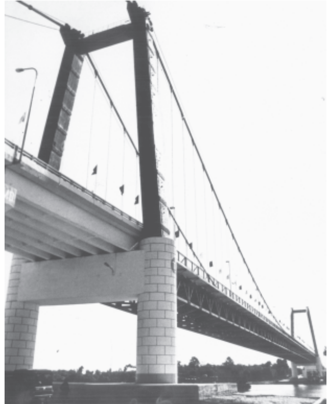
ဧရာဝတီတိုင်း ပုသိမ်မြို့နယ်တွင် အရှည်ပေ ၂၁၄၀ ရှိပြီး ငဝန်မြစ်ကို ဖြတ်ကျော်တည်ဆောက်ထားသော ပုသိမ်တံတား၏အလှကို မြစ်အနောက်ဘက်ကမ်းမှ ဤသို့ တွေ့ရသည်။

မှတ်ချက်။ တပ်မတော်အင်ဂျင်နီယာက တည်ဆောက်ခဲ့သည့်တံတား ၇၈၆ နှင့် မြန်မာ့စီးရထားက တည်ဆောက်ခဲ့သည့်တံတား ၆၈၆ အပါအဝင် စုစုပေါင်းတံတား အစင်း ၁၄၈၂ ဖြစ်ပါသည်။