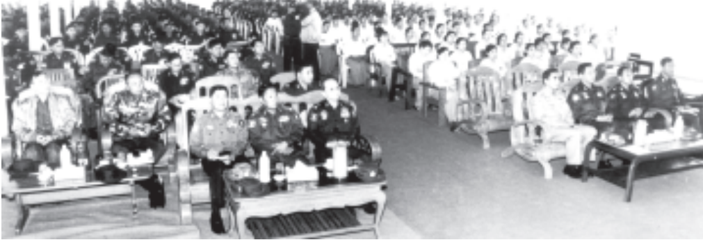
ရန်ကုန် ဒီဇင်ဘာ ၂၃

နိုင်ငံတော်အေးချမ်းသာယာရေးနှင့် ဖွံ့ဖြိုးရေးကောင်စီဝင် ကာကွယ်ရေးဝန်ကြီးဌာနမှ ဗိုလ်ချုပ်ကြီးသူရရွှေမန်းသည် ဒီဇင်ဘာ ၂၃ ရက် နံနက် ၈ နာရီခွဲတွင် မကွေးတပ်နယ်မှ အရာရှိစစ်သည်များနှင့် မိသားစုဝင်များအား မကွေးတပ်နယ်စခန်း၌ တွေ့ဆုံမှာကြားစဉ်။