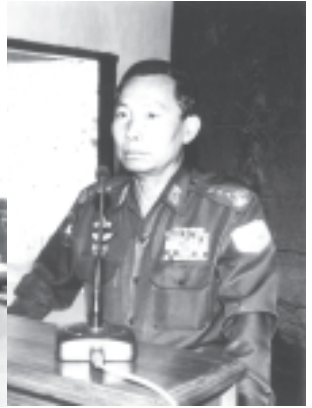
နိုင်ငံတော်အေးချမ်းသာယာရေးနှင့် ဖွံ့ဖြိုးရေးကောင်စီဝင် ဗိုလ်ချုပ်ကြီး သူရရွှေမန်း မကွေးမြို့ ဒေသစံတပ်ရင်း အောင်နိုင်ဟိန်းခန်းမ၌ မကွေးတပ်နယ်အတွင်းရှိ တပ်ရင်းတပ်ဖွဲ့များမှ အရာရှိစစ်သည်များနှင့် မိသားစုဝင်များအား တွေ့ဆုံအမှာစကားပြောကြားစဉ်။ (သတင်းစဉ်)

နိုင်ငံတော်အေးချမ်းသာယာရေးနှင့် ဖွံ့ဖြိုးရေးကောင်စီဝင် ကာကွယ်ရေးဝန်ကြီးဌာနမှ ဗိုလ်ချုပ်ကြီးသူရရွှေမန်းသည် ဒီဇင်ဘာ ၂၃ ရက် နံနက် ၈ နာရီခွဲတွင် မကွေးတပ်နယ်မှ အရာရှိစစ်သည်များနှင့် မိသားစုဝင်များအား မကွေးတပ်နယ်စခန်း၌ တွေ့ဆုံမှာကြားစဉ်။