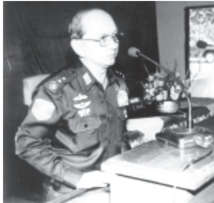
နိုင်ငံတော်အေးချမ်းသာယာရေးနှင့် ဖွံ့ဖြိုးရေးကောင်စီ အတွင်းရေးမှူး(၁) ဒုတိယဗိုလ်ချုပ်ကြီးသိန်းစိန် မကွေးမြို့ ဒေသစံတပ်ရင်း အောင်နိုင်ဟိန်းခန်းမ၌ မကွေးတပ်နယ်အတွင်းရှိ တပ်ရင်းတပ်ဖွဲ့များမှ အရာရှိစစ်သည်များနှင့် မိသားစုဝင်များအား တွေ့ဆုံမှာကြားစဉ်။ (သတင်းစဉ်)

ဗိုလ်ချုပ်မှူးကြီးသန်းရွှေနှင့် အဖွဲ့ဝင်များသည် မွန်းလွဲ ၂ နာရီခွဲတွင် ပွင့်ဖြူမြို့နယ် မဲဇလီရေလှဲဆည်၏အထက် ငါးမိုင်ခန့်အကွာ မုန်းချောင်း၌ ထပ်မံတည်ဆောက်အကောင်အထည်ဖော်လျက်ရှိသည့် ကြီးအုံ-ကြီးဝရေလျှောင့်တစ်ဘက်စုံစီမံကိန်းသို့ ရဟတ်ယာဉ်များဖြင့် ရောက်ရှိကြသည်။ ဗိုလ်ချုပ်မှူးကြီးသန်းရွှေနှင့်အဖွဲ့ဝင်များအား ရှေးဦးစွာ စီမံကိန်းရှင်းလင်းဆောင်၌ ဝန်ကြီး ဗိုလ်ချုပ်အေးဦးက ကြီးအုံ-ကြီးဝ ရေလျှောင့်တစ်ဘက်စုံတည်ဆောက်ရေး စီမံကိန်းအကောင်အထည်ဖော်လျက်ရှိသည့်အခြေအနေများကို ရှင်းလင်းတင်ပြပြီး ညွှန်ကြားရေးမှူးချုပ် ဦးကျော်စစ်ဝင်းနှင့် တည်ဆောက်ရေး(၃) ညွှန်ကြားရေးမှူး ဦးထွန်းအောင်လွင်တို့က လုပ်ငန်းပိုင်းဆိုင်ရာ ဆောင်ရွက်ချက်နှင့် ပြီးစီးမှုများကို ရှင်းလင်းတင်ပြကြသည်။ ဆက်လက်၍ မကွေးတိုင်း အေးချမ်းသာယာရေးနှင့် ဖွံ့ဖြိုးရေးကောင်စီဥက္ကဋ္ဌ ဗိုလ်မှူးကြီးဘုန်းမော်ရွှေက ပွင့်ဖြူမြို့နယ်အတွင်း မုန်းဆည်ရေဖြင့် တိုးချဲ့စိုက်ပျိုးနိုင်မည့် အခြေအနေများကို ရှင်းလင်းတင်ပြကြသည်။