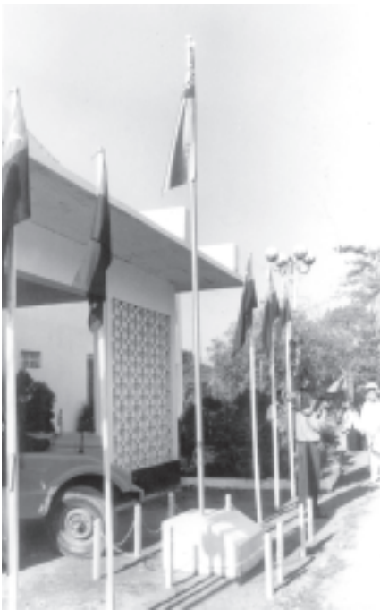
ပြည်ထောင်စုကြံ့ခိုင်ရေးနှင့် ဖွံ့ဖြိုးရေးအသင်း နှစ်ပတ်လည် သင်းလုံးကျွတ်အစည်းအဝေး(၂၀၀၄)၏ ဦးတည်ချက်(၇)ရပ်၊ ရှေ့လှုပ်ငန်းစဉ် (၉)ရပ်နှင့် ကရင်ပြည်နယ် ပြည်ထောင်စုကြံ့ခိုင်ရေးနှင့် ဖွံ့ဖြိုးရေးအသင်းက အကောင်အထည်ဖော်ဆောင်ရွက်မည့် ဦးတည်ချက်များ အကောင်အထည် ဖော်ဆောင်ရွက်ရေး လုပ်ငန်းညှိနှိုင်းအစည်းအဝေးကို ကရင်ပြည်နယ် ဘားအံမြို့၊ နွေကပင်ခန်းမ၌ ကျင်းပရာ တက်ရောက်လာကြသော ကိုယ်စား လှယ်များနှင့် ထူးချွန်ကျောင်းသားများက ပြည်ထောင်စုမြန်မာနိုင်ငံတော် အလံအား အလေးပြုကြစဉ်။ (သတင်းစဉ်)

စကားပြောကြားရာတွင် ယနေ့ ကျင်းပသည့် အစည်းအဝေးကြီးမှာ ပြည်ထောင်စုကြံ့ခိုင်ရေးနှင့် ဖွံ့ဖြိုးရေး အသင်း နှစ်ပတ်လည်သင်းလုံးကျွတ် အစည်းအဝေး(၂၀၀၄)က ချမှတ်လိုက် သည့် ဦးတည်ချက် အကောင်အထည် ဖော်ရေး လုပ်ငန်းညှိနှိုင်းအစည်းအဝေး ကြီးဖြစ်ကြောင်း၊ ဗဟိုနှစ်ပတ်လည် သင်းလုံးကျွတ် အစည်းအဝေး(၂၀၀၄) က ချမှတ်လိုက်သည့် အသင်းကြီး၏ ဦးတည်ချက်(၇)ရပ်အပေါ် အဓိက ထားပြီး အကောင်အထည်ဖော်နိုင်ရေး အတွက် ဦးတည်ဆွေးနွေးခဲ့ကြသကဲ့ သို့ သင်းလုံးကျွတ်အစည်းအဝေး (၂၀၀၄)က ချမှတ်ခဲ့သော ရှေ့လှုပ်ငန်း စဉ်(၉)ရပ်ကို မိမိတို့ ကရင်ပြည်နယ် အသင်းက လက်တွေ့ကျကျ အောင် မြင်မှုရှိအောင် မည်ကဲ့သို့ အကောင် အထည်ဖော် ဆောင်ရွက်ကြမည်ကို ညှိနှိုင်းဆွေးနွေးဆုံးဖြတ်ကြရမည် ဖြစ် ကြောင်း။