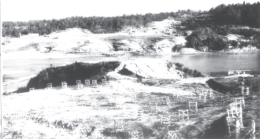
စာမျက်နှာ ၃ မှ

ရှင်းလင်းတင်ပြချက်များနှင့် စပ်လျဉ်း၍ ဗိုလ်ချုပ်မှူးကြီးသန်းရွှေက လမ်းညွှန်မှာကြားရာတွင် နိုင်ငံတော်ဖွံ့ဖြိုးတိုးတက်ရေးအတွက် လျှပ်စစ်နှင့် စွမ်းအင်ကဏ္ဍတို့သည် အဓိကအရေးကြီးသည့်ကဏ္ဍများဖြစ်ကြောင်း။