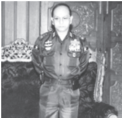
နိုင်ငံတော်အေးချမ်းသာယာရေးနှင့် ဖွံ့ဖြိုးရေးကောင်စီ အတွင်းရေးမှူး(၁) ဒုတိယဗိုလ်ချုပ်ကြီးသိန်းစိန် မန္တလေးတိုင်း ညောင်ဦးမြို့ရှိ တပ်မတော်စည်ရိပ်သာ၌ ညောင်ဦးခရိုင်နှင့် ညောင်ဦးမြို့နယ်တို့မှ ဌာနဆိုင်ရာတာဝန်ရှိသူများနှင့် တွေ့ဆုံပွဲတွင် ဆွေးနွေးမှုကြားစဉ်။ (သတင်းစဉ်)

အခမ်းအနားတွင် ရှေးဦးစွာ ညောင်ဦးခရိုင် အေးချမ်းသာယာရေးနှင့် ဖွံ့ဖြိုးရေးကောင်စီဥက္ကဋ္ဌ ဒုတိယဗိုလ်မှူးကြီးတေဇက ညောင်ဦးခရိုင်နှင့် မြို့နယ်၏ အကျယ်အဝန်း၊ လူဦးရေ နယ်မြေဒေသ အေးချမ်းတည်ငြိမ်မှု၊ ရှေးဟောင်းယဉ်ကျေးမှုနယ်မြေ ထိန်းသိမ်းစောင့်ရှောက်နိုင်မှု၊ ကမ္ဘာလှည့်ခရီးသည်များ