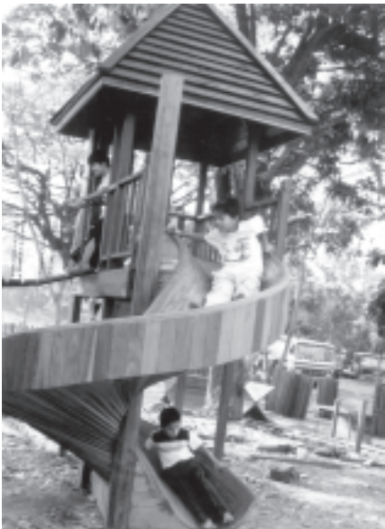
ပျော်ရွှင်စရာ ကလေးကစားကွင်းမှာ ကလေးငယ်တို့ ဤသို့လွတ်လပ်ပျော်ရွှင်စွာကစားနိုင်ကြသည်။

သရေစာအမျိုးမျိုး အရောင်းဆိုင်များနှင့်အတူ တိုင်းရင်းသားရိုးရာ အကပဒေသာများ၊ တိုင်းရင်းသား ဝတ်စုံအရောင်းဆိုင်များ၊ ပျော်ရွှင်စရာကလေးကစားကွင်းနှင့် ကလေးကစားစရာ အရုပ်အမျိုးမျိုးဆိုင်၊ လက်ဆောင်ပစ္စည်းအရောင်းဆိုင်များပါ စုလင်စွာရှိနေသည့်အတွက် တာဝန်ယူတည်ဆောက်သူ၏ စိတ်ကူးနှင့်စေတနာကို လေးစားမိပါ၏။