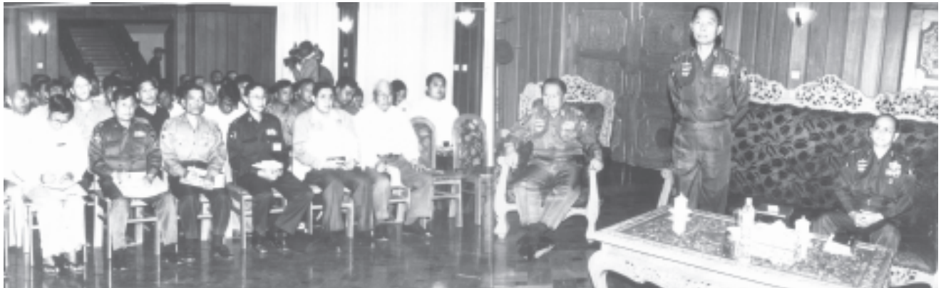
နိုင်ငံတော်အေးချမ်းသာယာရေးနှင့်ဖွံ့ဖြိုးရေးကောင်စီဝင် ဗိုလ်ချုပ်ကြီးသူရရွှေမန်း မန္တလေးတိုင်း သောင်ဦးမြို့ရှိ တပ်မတော်ဧည့်ရိပ်သာ၌ သောင်ဦးခရိုင်နှင့် သောင်ဦးမြို့နယ်တို့မှ ဌာနဆိုင်ရာ တာဝန်ရှိသူများအား တွေ့ဆုံမုတ်ကြားစဉ်။ (သတင်းစဉ်)