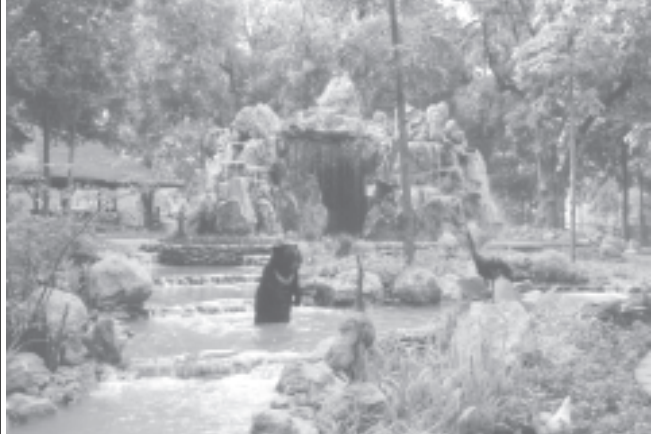
ကရဝိက်-ကန်တော်ကြီး သဘာဝဥယျာဉ်အတွင်းမှ တောတောင်သဘာဝအတိုင်း ခံစားနိုင်မည့် ဝက်ဝံနှင့် ဒေါင်းတို့ ပျော်စရာနေရာတစ်ခု။

View Deck ရှုခင်းကြည့် စင်မြင့်ကျယ်ကြီးကို ပျဉ်းကတိုးသားများဖြင့် အခိုင်အခံ့ ပြုလုပ်ထားရာ လာရောက်ကြသော ကမ္ဘာလှည့်ခရီးသွား နိုင်ငံခြားသားများ အကြိုက် မြင်ကွင်းအကျယ်အလတ်တွင် ကန်တော်ကြီးရေပြင်ကို ဝေပိုက်တိုက်ခတ်လာသော လေနအေးများနှင့်အတူ ရွှေတိဂုံစေတီတော်မြတ်နှင့် ကရဝိက်နန်းတော်၏ မြင်ကွင်းများက ကမ္ဘာလှည့်ခရီးသွားများအတွက် အလှအယက် ဓာတ်ပုံမီဒီယံရိုက်ကူးရာ နေရာတစ်ခုဖြစ်လာခဲ့။