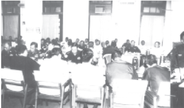
ရှင်းလင်းဆွေးနွေး

ညှိနှိုင်းအစည်းအဝေးတွင် ရှေ့ဦးစွာ အမျိုးသားစီမံကိန်းနှင့် စီးပွားရေး ဖွံ့ဖြိုးတိုးတက်မှုဝန်ကြီးဌာန ဝန်ကြီး ဦးစိုးသောက မိမိနှင့် မြန်ကြားရေး ဝန်ကြီးဌာနဝန်ကြီးတို့အား နိုင်ငံတော် အကြီးအကဲက တပ်မတော်က နိုင်ငံတော် တာဝန်ယူခဲ့ပြီးနောက် ဆောင်ရွက်ခဲ့သည့် ဖွံ့ဖြိုးတိုးတက်မှုများကို မှတ်တမ်းစာအုပ်အဖြစ် ကျန်ရှိဆောင်ဆောင်ရွက်ရန်၊ မိမိတို့အနေဖြင့် ပြည်နယ်နှင့်တိုင်းအားလုံး နယ်စပ်ဒေသပါမကျန် ဖွံ့ဖြိုးတိုးတက်ဆောင်ဆောင်ရွက်ပေးလျက်ရှိကြောင်း၊ ထို့ကြောင့် ၁၉၈၈ခုနှစ် မိမိတို့ တပ်မတော်က နိုင်ငံတော်တာဝန်ယူခဲ့ကာ ပြည်နယ်၊ တိုင်းအလိုက် ရှိပြီးသား ဖွံ့ဖြိုးတိုးတက်မှုများနှင့် ၁၉၈၈ခုနှစ်မှ ၁၂-၂၀၀၅ ရက်နေ့အထိ တပ်မတော်က တာဝန်ယူသည့်ကာလအတွင်း ဖွံ့ဖြိုးတိုးတက်မှုများကို နှိုင်းယှဉ်ဖော်ပြသော ကဏ္ဍခွဲဖွံ့ဖြိုးတိုးတက်မှုများကို တိတိကျကျ မှန်မှန်