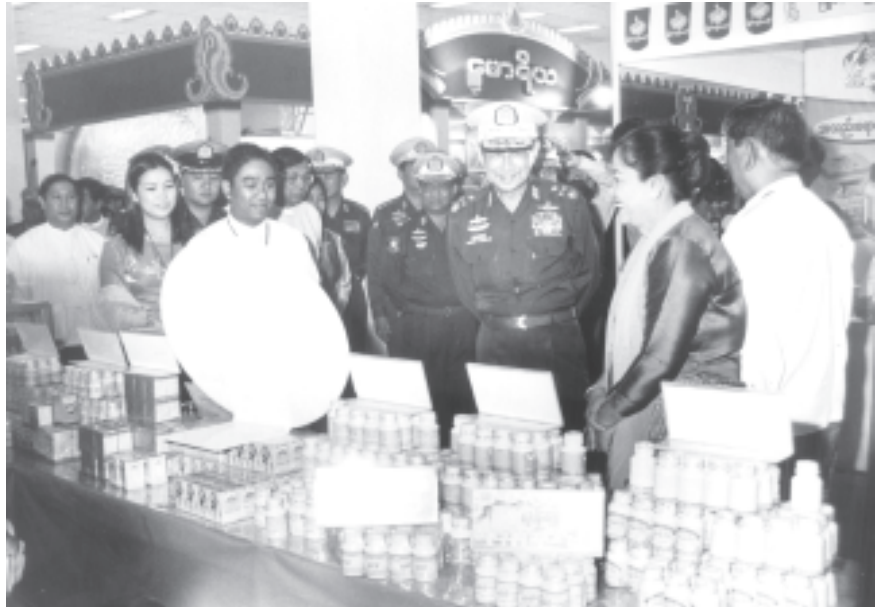
ဆေးပြခန်းများကို လှည့်လည်ကြည့်ရှုအေးပေးရာ ပြခန်းအလိုက် တာဝန်ရှိသူများ နှင့် ဆေးဝါးထုတ်လုပ်သူများက ရှင်းလင်းပြသကြသည်။

ဆက်လက်၍ ခုတိယဗိုလ်ချုပ်မှူးကြီးမောင်အေးနှင့်အဖွဲ့ဝင်များသည် ပုဂ္ဂလိက တိုင်းရင်းဆေးဝါးထုတ်လုပ်သူများနှင့် ရောင်းဝယ်သူများ၏ တိုင်းရင်း