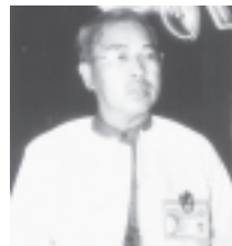
ပြည်သူများ၏ ကျန်းမာရေးအသုံးပြုမှုများကို အသိအမှတ်ပြုခြင်း ခံရသည့် မြန်မာ့အလင်း

အဖြစ် ကျန်ရစ်သည့်ဆေးပညာကို ကနဦးအစတွင် ဆရာတော်၊ သံဃာတော်များ၊ ဆွေမျိုးသားချင်းနှင့် နီးစပ်ရာ မိတ်ဆွေများကို ကုသပေးလျက်ရှိရာမှ အများပြည်သူများ၏ ကျန်းမာရေးကိုပါ စောင့်ရှောက်လျှင် ပိုမိုကုသလိမ့်မည်ဟု တွေးဆမိပြီး စေတနာရှိစွာထားကာ ဆေးဝါးများကို ထုတ်လုပ်လာကြောင်း၊ အမြတ်အစွန်း