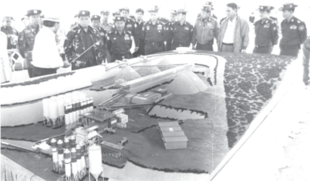
နိုင်ငံတော် အေးချမ်းသာယာရေးနှင့် ဖွံ့ဖြိုးရေးကောင်စီဥက္ကဋ္ဌ တပ်မတော်ကာကွယ်ရေးဦးစီးချုပ် ဗိုလ်ချုပ်မှူးကြီးသန်းရွှေအား ရဲရွာ ရေအားလျှပ်စစ်စီမံကိန်းလုပ်ငန်းခွင်တွင် လျှပ်စစ်စွမ်းအားဝန်ကြီးဌာန ဒုတိယဝန်ကြီးဦးမျိုးမြင့်က ပင်မတစ်တည်ဆောက်ရာသို့ ကွန်ကရစ်များကို Conveyor Belt များဖြင့် သယ်ပို့ထားမှုတို့ကို ပုံစံငယ်ဖြင့် ရှင်းလင်းတင်ပြစဉ်။

ထို့ပြင် စပါးခွဲဓာတ်ငွေ့အသုံးပြုပြီး လျှပ်စစ်ဓာတ်အား ပေးနိုင်ပြီး