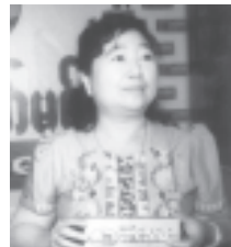
နှစ်ရက်သားသမီးများ အနာရောဂါဘယကင်းဝေးပြီး သက်ရှည်ကျန်းမာစေဖို့ ရည်ရွယ်ချက်ထားရှိ ဆောင်ရွက်လျက်ရှိသည့် မြန်မာ့အလင်း

ထုတ်လုပ်လျက်ရှိကြောင်း၊ ဆေးတိုက်ချင်း၊ နှစ်နှစ်နှင့် မှန်ညှင်းဆီအစရှိသည့် ဆေးဖက်ဝင် သဘာဝပစ္စည်းများ ပေါင်းစပ်ထုတ်လုပ်ထားကြောင်း၊ မိမိဖုလားလုပ်ကိုင်လာသည့် လုပ်ငန်းဖြစ်၍ မိဘလုပ်ငန်းကို ဆက်လက်ဆောင်ရွက်ရင်း ခုနစ်ရက် သားသမီး၊ အနာရောဂါဘယ ကင်းဝေးပြီး သက်ရှည်ကျန်းမာစေဖို့ ရည်ရွယ်ချက်ထားရှိကြောင်း၊ ဤဆေးပြပွဲကို ပထမ