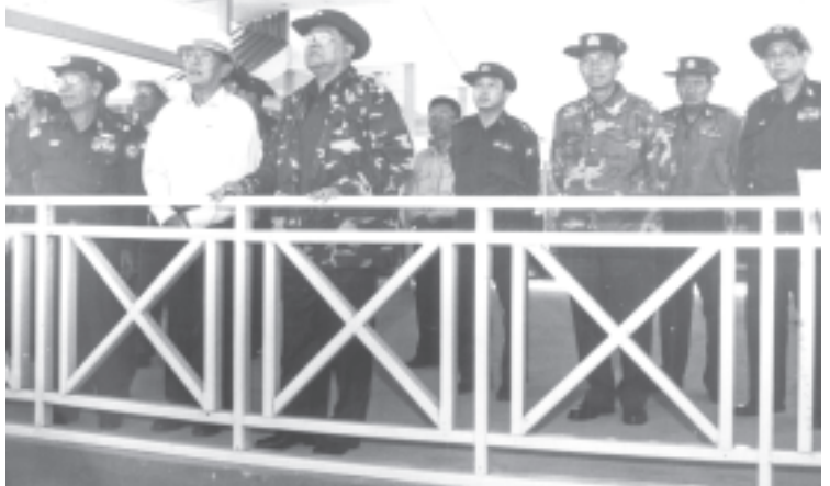
နိုင်ငံတော် အေးချမ်းသာယာရေးနှင့်ဖွံ့ဖြိုးရေးကောင်စီဥက္ကဋ္ဌ တပ်မတော်ကာကွယ်ရေးဦးစီးချုပ် ဗိုလ်ချုပ်မှူးကြီးသန်းရွှေ ရဲရွာရေအားလျှပ်စစ်စီမံကိန်းလုပ်ငန်းခွင်ကို ကြည့်ရှုစစ်ဆေးစဉ်။(သတင်းစဉ်)