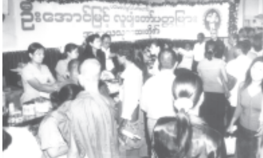
ပစ္စမအကြိမ် တိုင်းရင်းသားနှင့် ဆေးပစ္စည်းပြပွဲတွင် ဖောရီယာတိုင်းရင်းသားလုပ်ငန်းမှ အစွမ်းထက် တိုင်းရင်းသား အမျိုးမျိုး ရောင်းချပေးလျက်ရှိရာ ဝယ်ယူသူများဖြင့် စည်ကားလျက်ရှိစဉ်။ (မြန်မာ့အလင်း)

ယင်းသို့ရရှိခြင်းထူးနေပြီ ဖြစ်သည့် အောင်မြင်မှု ရလဒ်များကို ထပ်ဆင့်မြှင့်တင်ရင်း ပြည်သူများအား ထိရောက်ထက်မြက်သည့် ကျန်းမာရေးစောင့်ရှောက်မှု တိုးမြှင့်ပေးနိုင်ရေး စွမ်းစွမ်းတစ်ဆင့် ဆက်လက်ကြိုးပမ်းဆောင်ရွက်သွားကြရမည် ဖြစ်ပေသည်။ (မြန်မာ့အလင်း)