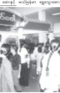
ပစ္စမအကြိမ် တိုင်းရင်းသားနှင့် ဆေးပစ္စည်းပြပွဲတွင် ဖောရီယာတိုင်းရင်းသားလုပ်ငန်းမှ အစွမ်းထက် တိုင်းရင်းသား အမျိုးမျိုး ရောင်းချပေးလျက်ရှိရာ ဝယ်ယူသူများဖြင့် စည်ကားလျက်ရှိစဉ်။