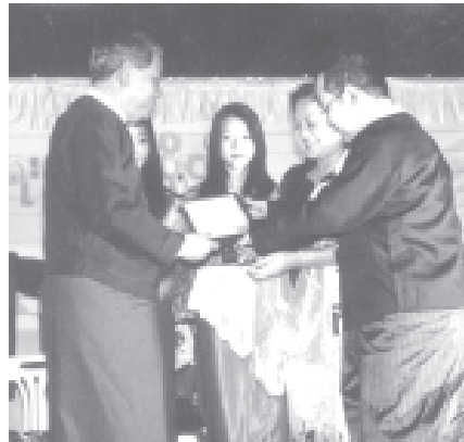
ပညာရေးဝန်ကြီးဌာန ဝန်ကြီး ဦးသန်းအောင် ရန်ကုန်စီးပွားရေး တက္ကသိုလ် ပတ္တမြားရတနာအထိမ်းအမှတ် အလှူရှင်ဦးကျော်ဝင်းအား ဂုဏ်ပြု လက်မှတ် ချီးမြှင့်စဉ်။

ယင်းနောက် အခမ်းအနားတွင် ရန်ကုန်စီးပွားရေးတက္ကသိုလ် မျိုးဆက်သစ်၊ မျိုးဆက်ဟောင်း ပေါင်းကူး အနုပညာရှင်များက မျှော်မြေတင်ဆက်ကြကောင်း သတင်းရရှိသည်။ (သတင်းစဉ်)