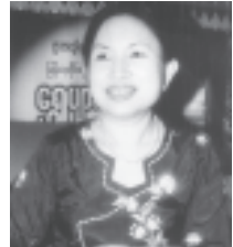
သားဖက်ဝင် သစ်မြစ်၊ သစ်ဥ၊ သစ်ဖုများအသုံးပြုပြီး ဖော်စပ်ထားသည့် ဆေးတိုက်မှုကို အသိအမှတ်ပြုခြင်း ခံရသည့် မြန်မာ့အလင်း

ဦးဆုံးအကြိမ်ပြသခြင်းဖြင့် အထွေအကြွေ ဗဟုသုတများ တိုးပွားရရှိစေကြောင်း” ပြောကြားသည်။