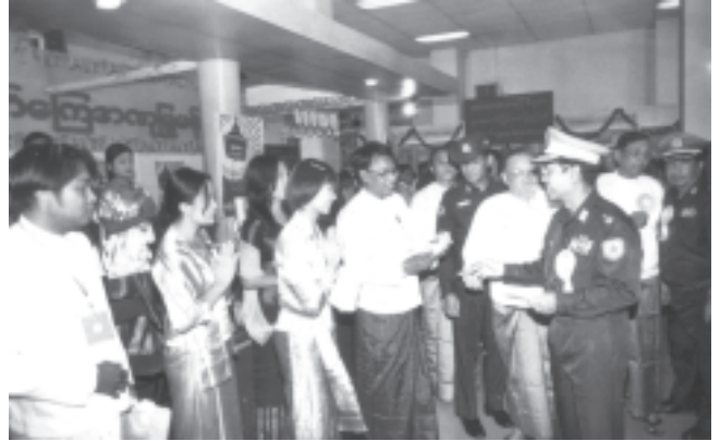
ရန်ကုန်တိုင်း အေးချမ်းသာယာရေးနှင့် ဖွံ့ဖြိုးရေးကောင်စီ ဥက္ကဋ္ဌ ရန်ကုန်တိုင်းစစ်ဌာနချုပ် တိုင်းမှူး ဗိုလ်ချုပ်မြင့်ဆွေ ပဉ္စမအကြိမ် တိုင်းရင်းဆေးနှင့် ဆေးပစ္စည်းပြပွဲ၌ ဖွင့်လှစ်ပြသထားသော အရောင်းပြခန်းများကို ကြည့်ရှုအားပေးစဉ်။

ပဉ္စမအကြိမ် တိုင်းရင်းဆေးနှင့်ဆေးပစ္စည်းပြပွဲတွင် တပ်မတော်ခန်းမအလယ်ဗဟို၌ နိုင်ငံတော်အေးချမ်းသာယာရေးနှင့်ဖွံ့ဖြိုးရေးကောင်စီ ဥက္ကဋ္ဌ