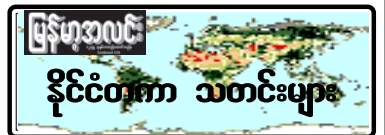
မြန်မာ့အသံ နိုင်ငံတကာ သတင်းများ

မဲခေါင်မြစ်ဒေသ ခြောက်နိုင်ငံ ခေါင်းဆောင်များသည် ၂၀၀၂ ခုနှစ် နိုဝင်ဘာ ၃ ရက်၌ ပထမထိပ်သီး အစည်းအဝေးကို ကမ္ဘောဒီးယားနိုင်ငံတွင် ကျင်းပခဲ့ရာ အဓိကမှာ စီးပွားရေး ပိုမိုပူးပေါင်းဆောင်ရွက်မှု တိုးတက်စေရန် ဖြစ်သည်။