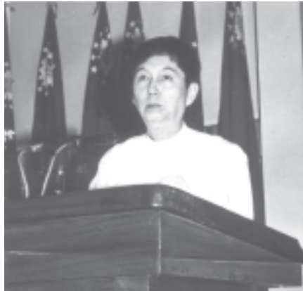
နိုင်ငံတော်အေးချမ်းသာယာရေးနှင့် ဖွံ့ဖြိုးရေးကောင်စီဥက္ကဋ္ဌ ဗိုလ်ချုပ်မှူးကြီးသန်းရွှေထံမှ ပဉ္စမအကြိမ် မြန်မာတိုင်းရင်းဆေးသမားတော်များ ညီလာခံသို့ ဖော်ပြသည့် သဝဏ်လွှာကို ကျန်းမာရေးဝန်ကြီးဌာနဝန်ကြီး ဒေါက်တာကျော်မြင့်က ဖတ်ကြားသည်။ (သတင်းစဉ်)

တိုင်းရင်းသားပြည်သူများကို မြန်မာတိုင်းရင်းဆေးပညာဖြင့် ကျန်းမာရေးစောင့်ရှောက်မှု တိုးမြှင့်လွှမ်းခြုံပေးနိုင်စေရေးအတွက် ပြည်နယ်နှင့်တိုင်းရင်းဆေးအားလုံးသို့ တိုင်းရင်းဆေးရုံများ ကိုယ်စီကိုယ်စီ ပေါ်ထွန်းနေပြီဖြစ်ပြီး ယခုဆိုလျှင် နိုင်ငံတော်တစ်ဝန်းလုံးတွင် စုတင် ၅၀ ဆိုတိုင်းရင်းဆေးရုံနှင့် ၁၆ စုတင်