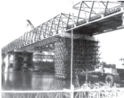
ရေလယ်တိုင်များနှင့် ကွန်ကရစ်ရက်မ သွန်းလောင်းနေမှုအခြေအနေများကို ရှင်းလင်းတင်ပြသည်။

သံသမချောတံတားမှာ အရှည် ၇၀၈ ပေ သုံးလမ်း၊ ယာဉ်သွားလမ်းအကျယ် ၂၄ ပေ၊ လူသွားလမ်းအကျယ်တစ်ဖက်တစ်ချက် သုံးပေစီ၊ ရေလမ်းကင်းလွတ်နယ်အကျယ် ပေ ၁၀၀၊ အမြင့် မြောက်ပေါ်၊ တံတားအမျိုးအစား အပေါ်ထည်မှာ သံပေါင်သံကွက်နံရံတစ်ဖက် အောက်ထည်မှာ သံကွက်နံရံတစ်ဖက်ဖြစ်ပြီး ယာဉ်တစ်စီးချင်း ခွင့်ပြုတန်ချိန်မှာ တန် ၆၀ ဖြစ်ပြီး သတ်မှတ်ချိန်အမီ ဖွင့်လှစ်နိုင်ရေး ကြိုးပမ်းဆောင်ရွက်လျက်ရှိကြောင်း သိရှိရသည်။