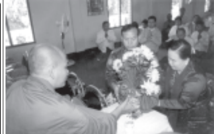
ဒီဇင်ဘာ ၁၄ရက်က ဝန်ကြီးချုပ်ရုံးဝန်ကြီး ဗိုလ်မှူးချုပ်ပြည်နယ်နှင့် ခေါ်အေးပြည်ခေင် ဒဂုံအရှေ့ပိုင်း (၇)ရပ်ကွက် ဖျာပုံလမ်း တက္ကသိုလ် ဇေယျသိဒ္ဓိပဋ္ဌာန်းကျောင်းတိုက် ဆရာတော်ဘန္တန္တကောဝိဒ(စူဠကူဝါစက ပစ္ဆိမတ)ထံ ကထိန်သင်္ကန်း ဆက်ကပ်လှူဒါန်းစဉ်။ (ဦးပွား/ ကူးသန်း)

ထို့ကြောင့် ရိုးစင်းစွာမေတ္တာဖြင့် ထပ်မံဆိုရပါမည်။ သစ္စာ၊ မေတ္တာ အခြေခံထားသည့် ရွှေနိုင်ငံ၌ ကျင်းပခဲ့သော ဗုဒ္ဓဘာသာသံဃာတော်ကြီးသည် ငြိမ်းချမ်းသော ကမ္ဘာကြီးဖြစ်ပေါ်ရေးနှင့် ဗုဒ္ဓဘုရားရှင်၏ တရားစစ်တရားမှန်မှန် ထွန်းကားပြန့်ပွားရေးတို့ကို အရှိန်အဟုန်ဖြင့် ဆက်လက် သယ်ပိုးဆောင်ကြဉ်းသွားမည်မှာ ဧကန်ပင် ဖြစ်ပါသည်။