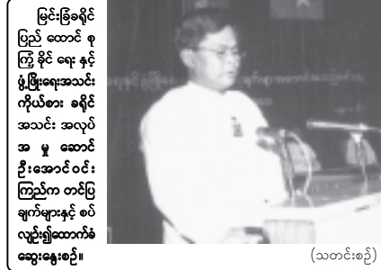
(သတင်းစဉ်)

သဖြင့် စက်မှုလုပ်ငန်းရှင်များအတွက် ရော၊ ဒေသခံပြည်သူများအတွက်ပါ များစွာ အကျိုးကျေးဇူးဖြစ်ထွန်းလာနေ ဖြစ်ကြောင်း၊ စက်မှုဇုန်က ပြည်တွင်း ထွက်စက်ယန္တရားများ ထုတ်လုပ်နိုင် သည်အထိ တိုးတက်ဆောင်ရွက်လာ နိုင်ပြီဖြစ်၍ ကျေနပ်အားရဖွယ်ဖြစ် ကြောင်း။