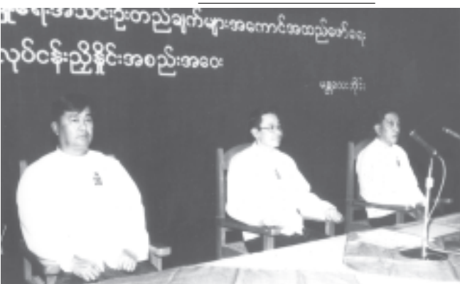
စာလွယ်များက ဘက်စုံထောင်စု၊ ကိုယ်စွမ်း ဉာဏ်စွမ်းရှိသူမျှ ပါဝင်ဆွေးနွေးပြီး လက်တွေ့နယ်ပယ်တွင် အမှန်တကယ် အကျိုးများစေမည့် ရှေ့လုပ်ငန်းစဉ်(၉)ရပ်ကို အောင်မြင်စွာ ချမှတ်နိုင်ခဲ့ကြောင်း၊ ယင်းအစည်းအဝေးကြီးက ချမှတ်ပေးခဲ့သော

အစီအစဉ်အရ ရှေးဦးစွာ လုပ်ငန်းညှိနှိုင်းအစည်းအဝေးသို့ တက်ရောက်လာကြသော ကိုယ်စားလှယ်များနှင့် ထူးချွန်ကျောင်းသားများသည် အမျိုးသားဇာတ်ရုံရှေ့၌ လှူတင်ထားသော ပြည်ထောင်စု မြန်မာနိုင်ငံတော်အလံအား ပြုကြသည်။