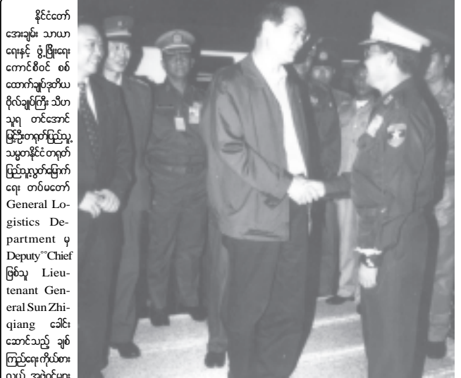
နိုင်ငံတော် အေးချမ်းသာယာ ရေးနှင့် ဖွံ့ဖြိုးရေး ကောင်စီဝင် စစ် ထောက်ချုပ်အထိ ဗိုလ်ချုပ်ကြီး သီဟ သူရ တင်အောင် မြင့်တက်မြှင့်သူ သမ္မတနိုင်ငံတရုတ် ပြည်သူ့လွတ်မြောက် ရေး တပ်မတော် General Lo- gistics De- partment မှ Deputy Chief ဖြစ်သူ Lieu- tenant Gen- eral Sun Zhi- qiang ခေါင်း ဆောင်သည့် ချစ် ကြည်ရေးကိုယ်စား လှယ် အဖွဲ့ဝင်များ အား ရန်ကုန်အပြည်ပြည်ဆိုင်ရာလေဆိပ်တွင် ကြိုဆိုနှုတ်ဆက်စဉ်။ (သတင်းစဉ်)

ရန်ကုန် ဒီဇင်ဘာ ၁၅ တရုတ်ပြည်သူ့သမ္မတနိုင်ငံ တရုတ်ပြည်သူ့လွတ်မြောက်ရေးတပ်မတော် General Logistics Department မှ Deputy Chief ဖြစ်သူ Lieutenant General Sun Zhiqiang ခေါင်းဆောင်သော ချစ်ကြည်ရေးကိုယ်စားလှယ် အဖွဲ့ဝင်များသည် ပြည်ထောင်စုမြန်မာနိုင်ငံတွင် ချစ်ကြည်ရေးခရီးလည်ပတ်ရန်အတွက် ယနေ့ညနေပိုင်းတွင် ရန်ကုန် မြို့သို့ လေကြောင်းခရီးဖြင့် ရောက်ရှိလာကြသည်။ ဧည့်သည်တော် တရုတ်ပြည်သူ့လွတ်မြောက်ရေးတပ်မတော်မှ Lieutenant General Sun Zhiqiang ခေါင်းဆောင်သည့် ချစ်ကြည်ရေးကိုယ်စားလှယ်အဖွဲ့ဝင်များအား နိုင်ငံတော်အေးချမ်းသာယာရေးနှင့် ဖွံ့ဖြိုးရေးကောင်စီဝင် စစ်ထောက်ချုပ် ဒုတိယဗိုလ်ချုပ်ကြီး သီဟသူရတင်အောင်မြင်ဦး၊ စစ်ဦးစီးအရာရှိချုပ်(ရေ) ဗိုလ်မှူးကြီးဉာဏ်ထွန်း၊ တွဲဖက်စစ်ထောက်ချုပ် ဗိုလ်ချုပ်ခင်မောင်ထွန်း၊ ကာကွယ်ရေး ဝန်ကြီးဌာနမှ ဗိုလ်ချုပ်သန်းဌေး၊ ဗိုလ်ချုပ်အေးမြင့်နှင့် တပ်မတော်အရာရှိကြီးများ ပြည်ထောင်စု မြန်မာနိုင်ငံတော်ဆိုင်ရာ တရုတ်ပြည်သူ့သမ္မတနိုင်ငံ သံအမတ်ကြီး H.E. Mr. Li Jinjun ၊ စစ်သံမှူး Senior Colonel Ma Shoudong နှင့် တာဝန်ရှိသူများက ရန်ကုန်အပြည်ပြည်ဆိုင်ရာ လေဆိပ်၌ ကြိုဆိုနှုတ်ဆက်ကြသည်။ (သတင်းစဉ်)