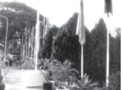
ပြည်ထောင်စုကြံ့ခိုင်ရေးနှင့် ဖွံ့ဖြိုးရေးအသင်း နှစ်ပတ်လည်သင်းလုံးကျွတ်အစည်းအဝေး(၂၀၀၄)၏ ဦးတင်ချက်(၇)ရပ်၊ ရှေ့လုပ်ငန်းစဉ်(၉)ရပ်နှင့် မန္တလေးတိုင်း ပြည်ထောင်စုကြံ့ခိုင်ရေးနှင့် ဖွံ့ဖြိုးရေးအသင်းက အကောင်အထည်ဖော်ဆောင်ရွက်မည့် ဦးတင်ချက်များ အကောင်အထည်ဖော် ဆောင်ရွက်ရေးလုပ်ငန်း ညှိနှိုင်းအစည်းအဝေးကို မန္တလေးမြို့ အမျိုးသားဇာတ်ရုံကျင်းပသော ကျင်းပစာလွယ်များနှင့် တူးချွန်ကျောင်းသားများက ပြည်ထောင်စုမြန်မာနိုင်ငံတော်အလံအား အလေးပြုကြစဉ်။ (သတင်းစဉ်)

မြို့နယ်၊ အမရပူရမြို့နယ်နှင့် ပုသိမ်ကြီးမြို့နယ်တို့မှ ပြည်ထောင်စုကြံ့ခိုင်ရေးနှင့် ဖွံ့ဖြိုးရေးအသင်းဝင်များ၊ မြန်မာနိုင်ငံ စစ်မှန်ထမ်းပေါက်အဖွဲ့ဝင်များ၊ အမျိုးသမီးရေးရာကော်မတီဝင်များ၊ မြန်မာနိုင်ငံ မိခင်နှင့်ကလေးစောင့်ရှောက်ရေး အသင်းဝင်များ၊ ကြက်မြေနှင့် မီးသတ်တပ်ဖွဲ့ဝင်များ၊ မြန်မာနိုင်ငံငြိမ်းတအစည်းအရုံး၊ မြန်မာနိုင်ငံ သဘာဝအစည်းအရုံးတို့မှ အဖွဲ့ဝင်များ၊ မန္တလေးမြို့ရှိ မလွန်ဆန်လှအသင်း၊ ချမ်းသာကြီးဆန်လှအသင်းတို့မှ တာဝန်ရှိပုဂ္ဂိုလ်များ၊ ကုန်သည်ကြီးများအသင်းနှင့် စက်မှုစုစုတို့မှ တာဝန်ရှိပုဂ္ဂိုလ်များသူများပြုတက္ကသိုလ်မှ ကျောင်းသားကျောင်းသူများနှင့် ထူးချွန်လူငယ်များ တက်ရောက်ကြသည်။