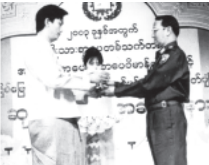
အားကစားဝန်ကြီးဌာန ဝန်ကြီး ဗိုလ်ချုပ်သုရအေးမြင့် (၁၅)ကြိမ်မြောက် အမျိုးသားရေးဆောင်ပုဒ် စာပေနှင့် ဓာတ်ပုံပြိုင်ပွဲ ရောင်စုံဓာတ်ပုံပထမဆုရ တက္ကသိုလ်ဟန်မင်းဦးအား ဆုချီးမြှင့်စဉ်။ (သတင်းစဉ်)