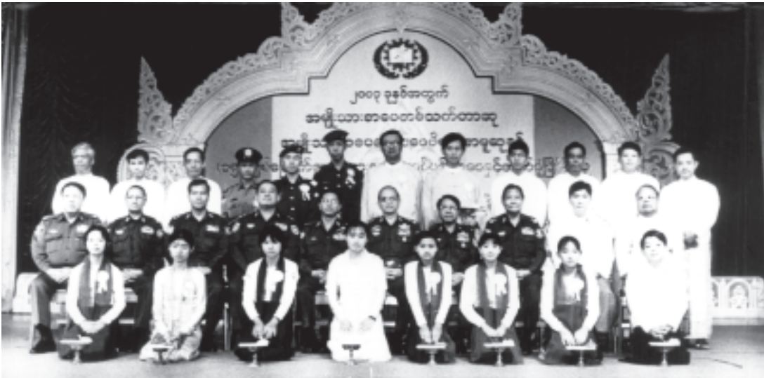
နိုင်ငံတော်အေးချမ်းသာယာရေးနှင့်ဖွံ့ဖြိုးရေးကောင်စီ အတွင်းရေးမှူး (၁) ဒုတိယဗိုလ်ချုပ်ကြီးသိန်းစိန်နှင့်အဖွဲ့ဝင်များ အမျိုးသားရေးဆောင်ပုဒ် စာပေနှင့်ဓာတ်ပုံပြိုင်ပွဲ ဆုရသူများနှင့်အတူ စုပေါင်းဓာတ်ပုံရိုက်စဉ်။ (သတင်းစဉ်)