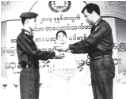
ဘက္ကားရေးနှင့် အမွေခံဝန်ကြီးဌာန ဝန်ကြီး ဗိုလ်ချုပ်လှထွန်း တပ်မတော်ဆိုင်ရာ အထွေထွေဗဟုသုတဉာဏ်စမ်းပြိုင်ပွဲ (ဘက္ကားသိုလ်အဆင့်)၌ ပထမဆုရ ဗိုလ်လောင်း ကောင်းထက်သော်အား ဆုချီးမြှင့်စဉ်။ (သတင်းစဉ်)