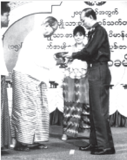
နိုင်ငံတော် အေးချမ်းသာယာရေးနှင့် ဖွံ့ဖြိုးရေးကောင်စီ အတွင်းရေးမှူး(၁) ဒုတိယဗိုလ်ချုပ်ကြီးသိန်းစိန် ၂၀၀၃ ခုနှစ်အတွက် အမျိုးသားစာပေဆု၊ စာပေဗိမာန်စာမူဆုနှင့် (၁၅)ကြိမ်မြောက် အမျိုးသားရေးဆောင်ပုဒ် စာပေနှင့်ဓာတ်ပုံပြိုင်ပွဲ ဆုချီးမြှင့်ပွဲ အခမ်းအနားတွင် ၂၀၀၃ ခုနှစ်အတွက် အမျိုးသားစာပေဆုရ မောင်သဗ္ဗာအား ဆုချီးမြှင့်စဉ်။