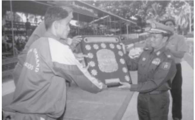
မြန်မာနိုင်ငံအိုလံပစ်ကော်မတီဥက္ကဋ္ဌ အားကစားဝန်ကြီးဌာန ဝန်ကြီး ဂိုလ်မူးချပ်သူရအေးမြင့် အနိုင်ရရှိခဲ့သွားသော အလယ်ပိုင်းတိုင်းစစ်ဌာနချုပ်အသင်းအား တံခွန်စိုက်ခိုင်း ဆု ပေးအပ်ချီးမြှင့်စဉ်။