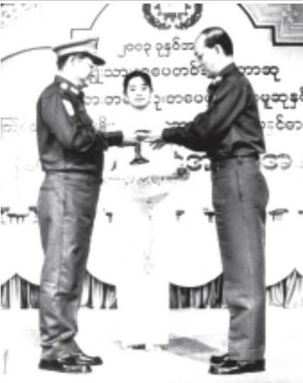
နိုင်ငံတော် အေးချမ်းသာယာရေးနှင့် ဖွံ့ဖြိုးရေးကောင်စီ အတွင်းရေးမှူး(၁) ဒုတိယဗိုလ်ချုပ်ကြီးသိန်းစိန် ၂၀၀၃ ခုနှစ်အတွက် အမျိုးသားစာပေဆု၊ စာပေဗိမာန်စာမူဆုနှင့် (၁၅)ကြိမ်မြောက် အမျိုးသားရေးဆောင်ပုဒ် စာပေနှင့် ဓာတ်ပုံပြိုင်ပွဲ ဆုချီးမြှင့်ပွဲ အခမ်းအနားတွင် ၂၀၀၃ ခုနှစ်အတွက် အမျိုးသားစာပေဆုရ လှိုင်သင်းအား ဆုချီးမြှင့်စဉ်။ (သတင်းစဉ်)

တစ်ခုအဖြစ် ခိုင်ခိုင်မြဲမြဲ တောက်တောက်ကြွားကြွား ရပ်တည်နိုင်စေရန် စာပေပညာရှင်များအားလုံးက အမျိုးသားရေးစိတ်ဓာတ် အပြည့်အဝဖြင့် တက်ညီလက်ညီ ကြိုးပမ်းအားထုတ် သွားကြပါရန် တိုက်တွန်းပြောကြားလိုကြောင်း။