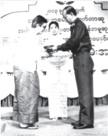
နိုင်ငံတော် အေးချမ်းသာယာရေးနှင့် ဖွံ့ဖြိုးရေးကောင်စီ အတွင်းရေးမှူး(၁) ဒုတိယဗိုလ်ချုပ်ကြီးသိန်းစိန် ၂၀၀၃ ခုနှစ်အတွက် အမျိုးသားစာပေဆု၊ စာပေဗိမာန်စာမူဆုနှင့် (၁၅)ကြိမ်မြောက် အမျိုးသားရေးဆောင်ပုဒ် စာပေနှင့်ဓာတ်ပုံပြိုင်ပွဲ ဆုချီးမြှင့်ပွဲ အခမ်းအနားတွင် ၂၀၀၃ ခုနှစ်အတွက် အမျိုးသားစာပေဆုရ နိုင်ငံ့စွမ်းအား ဆုချီးမြှင့်စဉ်။ (သတင်းစဉ်)