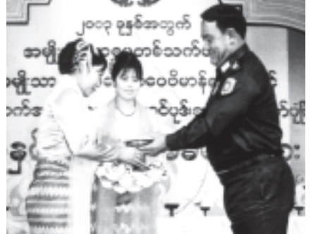
ပြည်ထောင်စုဝန်ကြီးဌာန ဝန်ကြီး ဒိုလ်ဗိုလ်မောင်ဦး ၂၀၀၃ခုနှစ် အတွက် စာပေဗိမာန်စာမူ မြန်မာ့ယဉ်ကျေးမှုနှင့် အနုပညာဆိုင်ရာစာပေ ပထမဆုရ သျှင်ထွေးယဉ်(မနုဿ)အား ဆုချီးမြှင့်စဉ်။ (သတင်းစဉ်)