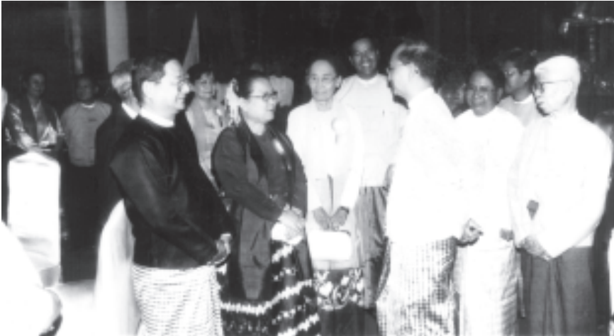
နိုင်ငံတော်အေးချမ်းသာယာရေးနှင့် ဖွံ့ဖြိုးရေးကောင်စီ အတွင်းရေးမှူး(၁) ဒုတိယဗိုလ်ချုပ်ကြီးသိန်းစိန်သည် ဝန်ကြီး ဗိုလ်မှူးချုပ် ကျော်ဆန်းက တည်ခင်းစဉ်သည့် ဂုဏ်ပြုညစာစားပွဲတွင် စာပေညာရှင်ကြီးများနှင့် စာပေဆုရရှိကြသူများအား ရင်းရင်းနှီးနှီး နှုတ်ဆက်စဉ်။ (သတင်းစဉ်)