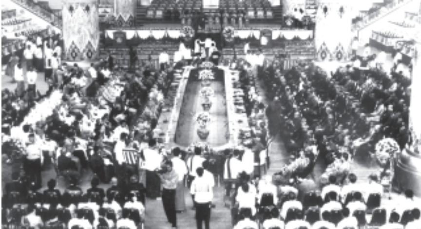
ပြည်ထောင်စုမြန်မာနိုင်ငံတော်အစိုးရ သာသနာရေးဝန်ကြီးဌာနက တာဝန်ယူကြီးမှူးကင်းပသည့် ကမ္ဘာ့ဗုဒ္ဓဘာသာထိပ်သီးညီလာခံကြီး တတိယနေ့ နံနက်ပိုင်း အစီအစဉ်အဖြစ် စားပွဲပိုင်းဆွေးနွေးပွဲကို ရန်ကုန်မြို့ မရမ်းကုန်းမြို့နယ် သီရိမင်္ဂလာ ကမ္ဘာ့အေးကုန်းမြေရှိ ဆဌသင်္ဂါယနာ မဟာပါသက လိုက်လံသိမ်းတော်ကြီး၌ ကျင်းပစဉ်။