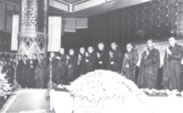
ဗီယက်နမ် ဆိုရှယ်လစ်သမ္မတနိုင်ငံမှ သံဃာတော်များက အောင်ခြင်းရှစ်ဖြာမင်္ဂလာတရားတော်ကို ရွတ်ပွား သရဇ္ဈာယ်တော်မူကြစဉ်။ (သတင်းစဉ်)