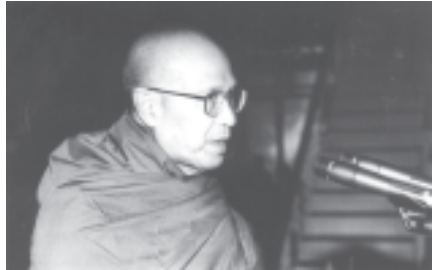
ပြည်ထောင်စုမြန်မာနိုင်ငံတော် အပြည်ပြည်ဆိုင်ရာ ထေရဝါဒ ပုဒ္ဓဘာသာနာပြုတက္ကသိုလ် ပါမောက္ခချုပ်ဆရာတော် အရှင်မဟာပဏ္ဍိတ အရှင်မဟာသဒ္ဓန္တတော်ကနေ ခေါက်တအရှင်သီလနန္ဒာဘိဝံသက ကမ္ဘာ့ပုဒ္ဓဘာသာထိပ်သီးညီလာခံကြီး အောင်မြင်ရာတွင် အထူးအခမ်းအနားတွင် နိဂုံးချုပ်ပြောဒကထာ မြွက်ကြားတော်မူစဉ်။

မကြာမီအချိန်အတွင်းမှာ ကမ္ဘာ့ပုဒ္ဓဘာသာ ထိပ်သီးညီလာခံကြီး အောင်မြင်စွာ ပြီးဆုံးတော့မှာဖြစ်ပါတယ်။ အားလုံးသိကြတဲ့အတိုင်း ညီလာခံကြီး အောင်မြင်ရေးအတွက် မြန်မာနိုင်ငံတော်အစိုးရနဲ့ ပြည်သူများဟာ ငွေအား၊ လူအား၊ မနုဿိကပတ်သက် လုပ်ဆောင်ခဲ့ပါတယ်။ အထိုက်အလျောက်လဲ အောင်မြင်ခဲ့တယ်လို့ ယူဆပါတယ်။ သူတို့ ဘယ်လောက် ကြိုးပမ်းအားထုတ်ကြပေမယ့် တက်ရောက်သူမရှိရင် ဘာမှဖြစ်လာမှာ မဟုတ်ပါဘူး။ ဒီသမိုင်းဝင် အခမ်းအနားကြီးမှာ မိန့်ခွန်းပြောသူများ၊ ဆွေးနွေးပွဲတက်ရောက်သူများ၊ ဆွေးနွေးသူများ အဖြစ် လူကြီးမင်းတို့ တက်ရောက်ပြီး စိတ်အားထက်သန်စွာ ပါဝင်တက်ရောက်ခဲ့ကြလို့ ဒီညီလာခံကြီး ခမ်းနားသိုက်မြိုက်စွာ အောင်မြင်ခဲ့တာဖြစ်ပါတယ်။ ဒါကြောင့် ဒီအောင်မြင်မှုဟာ ပြည်ထောင်စုမြန်မာနိုင်ငံတော်အစိုးရ၊ ပြည်သူများနဲ့တကွ ညီလာခံတက်ရောက်ကြသူများကြောင့် ဖြစ်ပါတယ်။