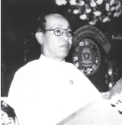
ပြည်ထောင်စုမြန်မာနိုင်ငံတော် နိုင်ငံတော်ဝန်ကြီးချုပ် ဒုတိယဗိုလ်ချုပ်ကြီး စိုးဝင်း ကမ္ဘာ့ဗုဒ္ဓဘာသာထိပ်သီးညီလာခံကြီး အောင်မြင်စွာ ပိတ်သိမ်းခြင်း အခမ်းအနားတွင် ကျေးဇူးတင်စကား လျှောက်ထားစဉ်။