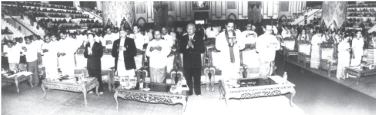
ပြည်ထောင်စုမြန်မာနိုင်ငံတော် ရန်ကုန်မြို့ မရမ်းကုန်းမြို့နယ် သီရိမင်္ဂလာ ကမ္ဘာ့အေးကုန်းမြေရှိ ဆဋ္ဌသင်္ဂါယနာမဟာပါသာဏလိင်္ဂဝသိမ်တော်ကြီး၌ကျင်းပသော ကမ္ဘာ့ပုဒ္မာသာထိပ်သီးညီလာခံကြီးသို့ တက်ရောက်လာကြသော နိုင်ငံတော်ဝန်ကြီးချုပ် ဒုတိယဗိုလ်ချုပ်ကြီးစိုးဝင်း၊ သီရိလင်္ကာဒီပိကာရကရက်တစ်ဆုံရယ်လစ်သမ္မတနိုင်ငံ ဝန်ကြီးချုပ် မစ္စတာမဟင်ဒါရာဂျပက်(ခ)စီနှင့် ပြည်တွင်းပြည်ပမှ ပုဂ္ဂိုလ်များက ကမ္ဘာ့ပုဒ္မာသာထိပ်သီးညီလာခံကြီး အောင်မြင်စွာပြီးဆုံးခြင်းအထိမ်းအမှတ်အဖြစ် “စိရိဝိဇ္ဇတု လောကဿိ” သမ္ဗာသမ္ဗုဒ္ဓ သာသနံ၊ တသ္မိံ သဂါရဝါနိစ္စ၊ ဟောန္တု၊ သမ္ဗေဝံ ပါဏိနော” သာသနာဆုတောင်း ဂါထာကို ရွတ်ဆိုကြစဉ်။ (သတင်းစဉ်)

မြတ်ပုဒ္မရဲ့ အဆုံးအမများဟာ လူသားတွေရဲ့ ပူလောင်စွာ ခံစားနေရတဲ့ စိတ်ရိုင်းဆိုင်ရာ ဒုက္ခ ဝေဒနာများကို ကုစားနိုင်သကဲ့သို့ ကမ္ဘာပေါ်မှာ ကာယကံနှင့် ဝစီကံများ ယှဉ်ပြီး ဖြစ်ပေါ်နေတဲ့ အကြမ်းဖက် အနိုင်ကျင့်မှုတွေ၊ လက်နက်ကိုင် တိုက်ခိုက်နေကြတဲ့ စစ်ပွဲတွေ၊ ဆင်းရဲချမ်းသာ ကွာဟမှု တွေ၊ ကြီးမား ငယ်ညှင်းမှုတွေကိုလဲ အမှန်တကယ် လျော့နည်းပပျောက်စေမှာ ဖြစ်ပါတယ်။