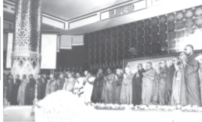
သီရိလင်္ကာ ဒီမိုကရက်တစ်ဆိုရှယ်လစ်သမ္မတနိုင်ငံမှ သံဃာတော်များက မေတ္တာသုတ်ပရိတ်တော်ကို ရွတ်ပွား သရဇ္ဈာယ်တော်မူကြစဉ်။ (သတင်းစဉ်)