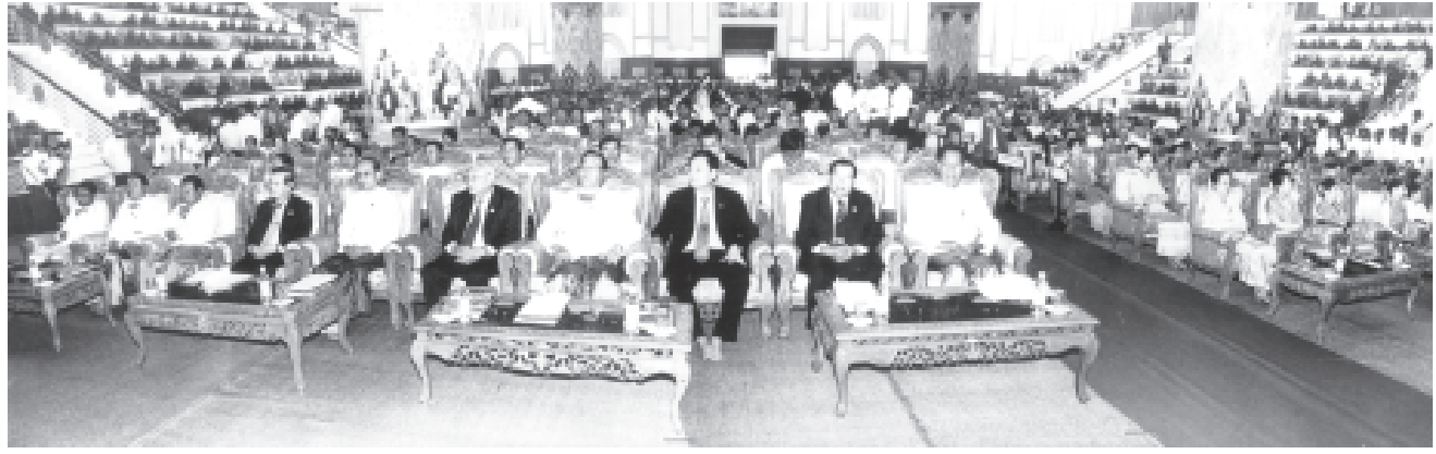
ပြည်ထောင်စုမြန်မာနိုင်ငံတော် ရန်ကုန်မြို့၊ မရမ်းကုန်းမြို့နယ် သီရိမင်္ဂလာကမ္ဘာ့အေးကုန်းမြေရှိ ဆဋ္ဌသင်္ဂါယနာ မဟာပါသာဏလိုဏ်ဂူသိမ်တော်ကြီး၌ ကျင်းပသော ကမ္ဘာ့ဗုဒ္ဓဘာသာထိပ်သီးညီလာခံကြီး ဖွင့်ပွဲမင်္ဂလာ အခမ်းအနားသို့ တက်ရောက်လာကြသော နိုင်ငံတော်အေးချမ်းသာယာရေးနှင့်ဖွံ့ဖြိုးရေးကောင်စီဝင် ဗိုလ်ချုပ်ကြီးသုရတ္တမန်၊ နိုင်ငံတော်ဝန်ကြီးချုပ် ဒုတိယဗိုလ်ချုပ်ကြီးစိုးဝင်း၊ နိုင်ငံတော်အေးချမ်းသာယာရေးနှင့် ဖွံ့ဖြိုးရေးကောင်စီ အတွင်းရေးမှူး(၁) ဒုတိယဗိုလ်ချုပ်ကြီးသိန်းစိန်နှင့် ပြည်တွင်းပြည်ပမှ ပုဂ္ဂိုလ်များကို တွေ့ရစဉ်။ (သတင်းစဉ်)

ရန်ကုန် ဒီဇင်ဘာ ၉ ကမ္ဘာ့ဗုဒ္ဓဘာသာ ထိပ်သီးညီလာခံကြီးကို ရန်ကုန်မြို့ သီရိမင်္ဂလာ ကမ္ဘာ့အေးကုန်းမြေရှိ မဟာပါသာဏလိုဏ်ဂူ သိမ်တော်ကြီး၌ ဒီဇင်ဘာ ၉ ရက် (ယနေ့) မှ ၁၁ ရက်အထိ ကျင်းပ လျက်ရှိရာ ဒီဇင်ဘာ ၁၁ ရက်တွင် ကျင်းပမည့် ကမ္ဘာ့ဗုဒ္ဓဘာသာ ထိပ်သီးညီလာခံကြီးပိတ်ပွဲ အခမ်းအနား ကျင်းပပုံများကို မြန်မာ့ ရုပ်မြင်သံကြားအစီအစဉ်မှ ယင်းနေ့ မွန်းလွဲ ၁၂ နာရီ ၄၅ မိနစ်မှ စတင်၍ တိုက်ရိုက်ထုတ်လွှင့်မည်ဖြစ်သည်။ (သတင်းစဉ်)