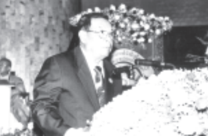
လာအိုနိုင်ငံကြီးချုပ်

လာအိုပြည်သူ ဒီမိုကရက်တစ်သမ္မတနိုင်ငံဝန်ကြီးချုပ် မစ္စတာ ဘောင်ညီဗိုရာချစ် က နှုတ်ခွန်းဆက် မိန့်ခွန်း ပြောကြားစဉ်။ (သတင်းစဉ်)