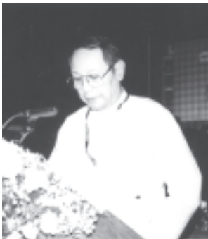
ဘင်္ဂလားဒေ့ရှ် ပြည်သူ့ သမ္မတနိုင်ငံ သမ္မတ ပါမောက္ခ ဒေါက်တာ အီယာကျူဒင်အာမက်ထံမှ ပေးပို့သော ဂုဏ်ပြုသဝဏ်လွှာကို ကိုယ်စားလှယ် တစ်ဦးက ဖတ်ကြားစဉ်။ (သတင်းစဉ်)

အဆွေတော် ကျန်းမာပျော်ရွှင်စွာဖြင့် သက်တော်ရှည်ရှည် ရှည်ပါစေကြောင်း၊ ပြည်ထောင်စု မြန်မာနိုင်ငံ တော်သူ နိုင်ငံတော်သားအပေါင်း ဆက်လက်ငြိမ်းချမ်းရေး တိုးတက်စည်ပင်ပြောပါစေကြောင်း ဆုမွန်ကောင်းများ တောင်းဆိုအံ့မြဲအပ်ပါသည်။ အဆွေတော်အပေါ်ထားရှိသော ကျွန်ုပ်တို့၏ လေးစားဂုဏ်တရားကိုလည်း ထပ်လောင်း ဖော်ပြအပ်ပါသည်စင်စစ်များ။