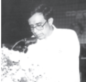
သီရိလင်္ကာဒီပိကရက်တစ် ဆိုရှယ်လစ်သမ္မတ နိုင်ငံ သမ္မတ မဒမ်ချန်ဒရီကာဘန်ဒရာနိကကေး ကုမာရာတွန်ဂါထံမှ ပေးပို့သော ဂုဏ်ပြုသဝဏ်လွှာ ကို ပြည်ထောင်စုမြန်မာနိုင်ငံတော်ဆိုင်ရာ သီရိ လင်္ကာ ဒီပိကရက်တစ် ဆိုရှယ်လစ်သမ္မတနိုင်ငံ သံအမတ်ကြီး H.E. Mr.D.M.M.Ranaraj က ဖတ်ကြားစဉ်။ (သတင်းစဉ်)

မဒမ်ချန်ဒရီကာ ဘန်ဒရာနိကကေး ကုမာရာတွန်ဂါ သမ္မတ။