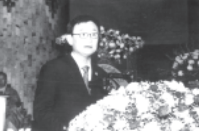
ထိုင်းနိုင်ငံဝန်ကြီးချုပ်

ထိုင်းနိုင်ငံ ဝန်ကြီးချုပ် ဒေါက်တာ သက်ဆင်ရှင် နာဝပ်က နှုတ်ခွန်းဆက် မိန့်ခွန်းပြောကြားစဉ်။ (သတင်းစဉ်)