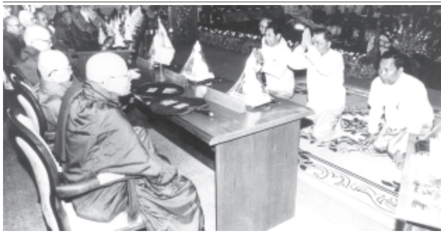
ကမ္ဘာ့ဗုဒ္ဓဘာသာ ထိပ်သီးညီလာခံကြီးဖွင့်ပွဲ မင်္ဂလာအခမ်းအနားတွင် ပြည်ထောင်စုမြန်မာနိုင်ငံတော် နိုင်ငံတော် အေးချမ်းသာယာရေးနှင့် ဖွံ့ဖြိုးရေးကောင်စီဥက္ကဋ္ဌ ဗိုလ်ချုပ်မှူးကြီးသန်းရွှေနှင့် အဖွဲ့ဝင်များက ပြည်တွင်းပြည်ပမှ ဆရာတော်ကြီးများအား ဖူးမြော်ကြည့်ကြစဉ်။