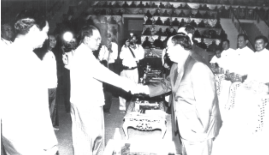
နိုင်ငံတော်အေးချမ်းသာယာရေးနှင့် ဖွံ့ဖြိုးရေးကောင်စီဥက္ကဋ္ဌ ဗိုလ်ချုပ်မှူးကြီးသန်းရွှေ ကမ္ဘာ့ဗုဒ္ဓဘာသာတော်လှုံ့ဆော်မှုမဟာသမဂ္ဂ အစည်းအဝေးတွင် တက်ရောက်လာသော လာအိုပြည်သူ့ဒီမိုကရက်တစ် သမ္မတနိုင်ငံ ဝန်ကြီးချုပ် မစ္စတာဘောင်ညံပိရာချစ်အား ရင်းရင်းနှီးနှီး နှုတ်ခေါ်စဉ်။

ပရိယတ္တိစာသင်တိုက်များမှ ပဓာန နာယကဆရာတော်များ၊ တိပိဋကဓရ ဩဝါဒါစရိယ ဆရာတော်များ၊ ထေရဝါဒဗုဒ္ဓသာသနာပြု ဩဝါဒါ စရိယ ဆရာတော်များ၊ တိပိဋကဓရ မေတ္တာဇ္ဈာဂါရိက ဆရာတော်များ၊ တိပိဋကဓရ တိပိဋကကောသိဒ ဆရာ တော်များ၊ အပြည်ပြည်ဆိုင်ရာ ထေရဝါဒ ဗုဒ္ဓသာသနာပြုတက္ကသိုလ်မှ ပါမောက္ခချုပ်ဆရာတော်နှင့် ဒုတိယ ပါမောက္ခချုပ်ဆရာတော်၊ နိုင်ငံတော် ပရိယတ္တိသာသနာ့တက္ကသိုလ်(ရန်ကုန်