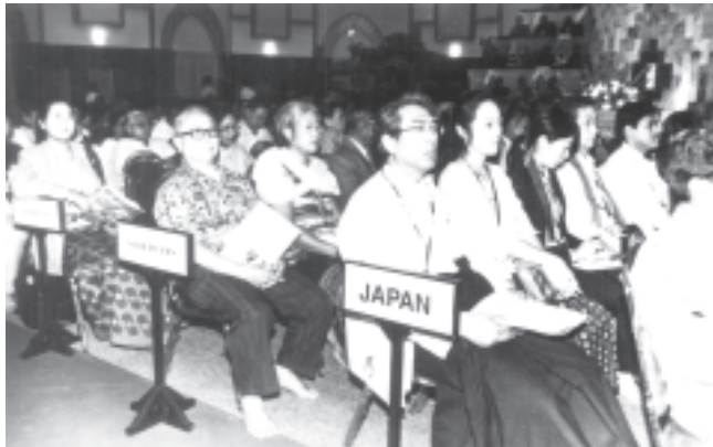
ရန်ကုန်မြို့ မရမ်းကုန်းမြို့နယ် သီရိမင်္ဂလာ ကမ္ဘာ့အေးကုန်းမြေ မဟာပါသာဏဇုဏ်ရုံ သိမ်တော် ကြီး၌ကျင်းပသည့် ကမ္ဘာ့ဗုဒ္ဓ ဘာသာ တိပိဋသီလ္လာနကြီး ဖွင့်ပွဲ မင်္ဂလာအခမ်းအနားတွင် ပြည်ပ နိုင်ငံများမှ တက်ရောက်လာကြ သော ဗုဒ္ဓဘာသာဝင် ဒါယကာ ဒါယိကမဇ္ဈိကအား တွေ့စဉ်။ (သတင်းစဉ်)

နှင့်ဗုဒ္ဓ လေး)တို့မှ ပါမောက္ခချုပ် ဆရာ တော်များ၊သီတဂူကမ္ဘာ့ဗုဒ္ဓတက္ကသိုလ် အဓိပတိ ပါမောက္ခချုပ် ဆရာတော်၊ ရန်ကုန်တိုင်း ကျောင်းထိုင် ဘုန်းကြီး သင်တန်းကျောင်းမှ ဆရာတော်များ၊ ယဉ်ကျေးမှုနည်းပြ ဆရာတော်များ၊ အဘိဓာန်ကျမ်းပြု ဆရာတော်များ၊ နိုင်ငံတော် ပရိယတ္တိ သာသနာ တက္ကသိုလ်(ရန်ကုန်နှင့်ဗန္ဓုလေး)တို့မှ