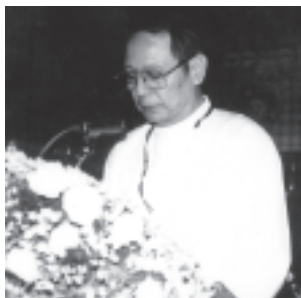
ဘင်္ဂလားဒေ့ရှ် ပြည်သူ့ သမ္မတနိုင်ငံ ဝန်ကြီးချုပ် ဘီဂမ်လီအီဒါဇီယာထံမှ ပေးပို့သော ဂုဏ်ပြုသဝဏ် လွှာကို ကိုယ်စားလှယ်တစ်ဦးက ဖတ်ကြားစဉ်။

အဆွေတော်အပေါ်ထားရှိသော ကျွန်ုပ်တို့လေးစားဂုဏ်တရားကို ထပ်လောင်းဖော်ပြအပ်ပါသည်။