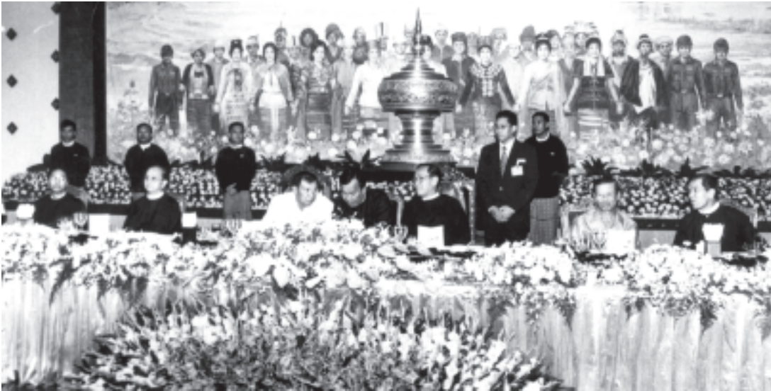
ပြည်ထောင်စုမြန်မာနိုင်ငံတော် နိုင်ငံတော်ဝန်ကြီးချုပ် ဒုတိယဗိုလ်ချုပ်ကြီးစိုးဝင်းက လာအိုပြည်သူ့ဒီမိုကရက်တစ်သမ္မတနိုင်ငံ ဝန်ကြီးချုပ် မစ္စတာဘောင်ညိဗိုရာချစ်နှင့်အဖွဲ့ဝင်များအား ရန်ကုန်မြို့ ပြည်သူ့လွှတ်တော်အဆောက်အအုံဧည့်ခံခန်းမ၌ ဂုဏ်ပြုညစာစားပွဲဖြင့် တည်ခင်းစဉ်ပုံစံ။ (သတင်းစဉ်)