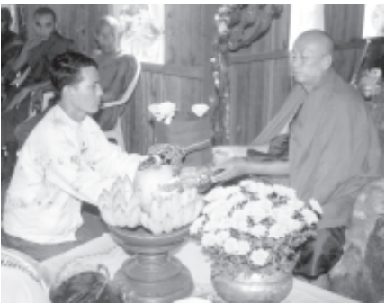
ဒီဇင်ဘာ ၂၃ရက်က လှိုင်သာယာမြို့နယ် မြို့နယ်အေးချမ်းသာယာရေးနှင့် ဖွံ့ဖြိုးရေးကော်မတီ၏ (၁၂)ကြိမ်မြောက် စုပေါင်းမဟာသုတေသနကို အပြင်ပတ် ကျေးရွာအုပ်စု ကမ်းပြိုဘုန်းတော်ကြီးကျောင်း၌ ကျင်းပရာ မြို့နယ် အေးချမ်းသာယာရေးနှင့် ဖွံ့ဖြိုးရေးကော်မတီဥက္ကဋ္ဌ ဦးစင်သိန်းမောင်က ကမ်းပြိုကျောင်းဆရာတော်အား ကထိန်သက်နန်း ဆက်ကပ်လှူဒါန်းစဉ်။ (၁၈၀)

စီမံဆောင်ရွက်ထားကြရန် မှာကြားသည်။ (သတင်းစဉ်)