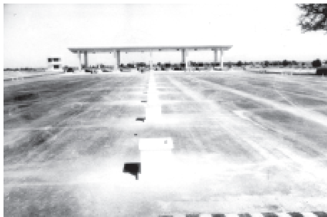
ရန်ကုန်-မန္တလေး ပြည်ထောင်စုလမ်းမကြီး မိတ္ထီလာ-မန္တလေးလမ်းပိုင်း၌ ခြောက်လမ်းသွားလမ်းအဖြစ် ဖောက်လုပ်ပြီးစီးမှုကို တွေ့ရစဉ်။ (သတင်းစဉ်)

ထို့နောက် ဒုတိယပိုင်းချုပ်ကြီးရဲမြင့်က ပလ္လင်တောင်လျှပ်စစ်မြစ်ရေတင်မြောင်းတစ်လျှောက်သစ်တက်ကုန်းဆည်ရေဖြင့် အစားထိုးရေပေးဝေရုံသာမက တိုးချဲ့ရေပေးဝေရေး မြောင်းများ တိမ်ကောမှုမရှိအောင် ထိန်းသိမ်းဆောင်ရွက်ရေးမှာကြားသည်။ ဆက်လက်၍ ဒုတိယပိုင်းချုပ်ကြီးရဲမြင့်နှင့် အဖွဲ့ဝင်များသည် ကင်းတားဆည် လက်ဝဲမြောင်း အမှတ် (၃၀)၊ မြောင်းခွဲအမှတ်(၁၁)နှင့်(၁၂)အကြားသို့ ရောက်ရှိကြပြီး ကင်းတားဆည်လက်ဝဲမြောင်းအမှတ်(၃၀)ကို သစ်တက်ကုန်းဆည်ရေပို့လွှတ်နိုင်ရေးအတွက် စက်ယန္တရားများဖြင့် မြောင်းပြုပြင်နေမှု၊ ရေပို့လွှတ်နေမှုများကို ကြည့်ရှုစစ်ဆေးသည်။