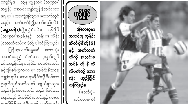
ယှဉ်ပြိုင် အိုးဆာရာအသင်းမှ ယူနိုင်းအိတ်ဂိုးတို(၁) နှင့် အက်လက်တိုက် အသင်းမှ အင်နီ တို့ ယိုလို့ပက်တို့ ဘောလုံး ယှဉ်ပြိုင်လှကြစဉ်။

စပိန် လာလီဂါဘောလုံးပြိုင်ပွဲများကို စနေနေ့က ယှဉ်ပြိုင်ကစားအပြီး အများဆုံးရိုက်သွင်းသူများမှာ အောက်ပါအတိုင်းဖြစ်သည်။