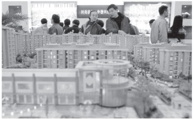
တရုတ်နိုင်ငံ ရန်ဟိုင်းမြို့၌ အိမ်ရှင်အရောင်းပွဲတက်တစ်ရပ် ကျင်းပလျက်ရှိသည့်ကို ဒီဇင်ဘာ ၅ ရက်က ဖွင့်လှစ်ပေးခြင်း (ဓာတ်ပုံ-အင်တာနက်)

မိမိတို့၏ အားကစားသမားများ ဆုတံဆိပ်အများအပြားရဖွယ်ရှိကြောင်း စားပွဲတင်တင်းနစ်၊ တင်းနစ်နှင့် ကြက်တောင်တို့တွင် ရရှိနိုင်ကြောင်း ၎င်းကသတင်းထောက်များအား ဖွင့်ပွဲအခမ်းအနားပေးပြီးတွင် ပြောကြားသည်။ (အင်တာနက်)