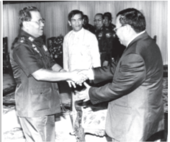
ရင်းရင်းနှီးနှီး တွေ့ဆုံနှုတ်ဆက်

၁၃၆၆ ခုနှစ်၊ တန်ဆောင်မုန်းလပြည့်ကျော် ၁၂ ရက်၊ ၂၀၀၄ ခုနှစ်၊ ဒီဇင်ဘာ ၈ ရက်၊ ဗုဒ္ဓဟူးနေ့၊ အတွဲ (၄၂)၊ အမှတ် (၆၉)