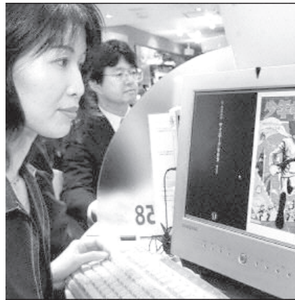
ဂျပန်နိုင်ငံ တိုကျိုမြို့ အင်တာနက်ကားဆိုင်တစ်ဆိုင်၌ ကုန်ပို့တာပေါ်မှ ဖောက်ပြန်ရေးအစီအစဉ်တစ်ခုအား လာရောက်စားသုံးသူ တစ်ဦးက ကြည့်ရှုနေသည့်ကို ဒီဇင်ဘာ ၆ရက်က ဖွင့်လှစ်ပေးခြင်း

မြို့တွင်း၌ တွေ့ရှိရသည့် အသက်(၁၅)နှစ်မှ (၅၅)နှစ်အရွယ်ရှိ အီရတ်များကို အမေရိကန်တို့က ထိန်းသိမ်းကာ စစ်ဆေးမေးမြန်းလျက်ရှိပြီး၊ ပြန်လွှတ်ပေးသည့်လူများကို အိမ်ပြန်ရန်ခြင်းနှင့် မြို့ပြင်းသို့ စောင့်ရှောက် လိုက်ပို့ခြင်းတို့မှ ကြိုက်ရာရွေးချယ်ရသည်။ (စီအင်အိုင်အိုင်)