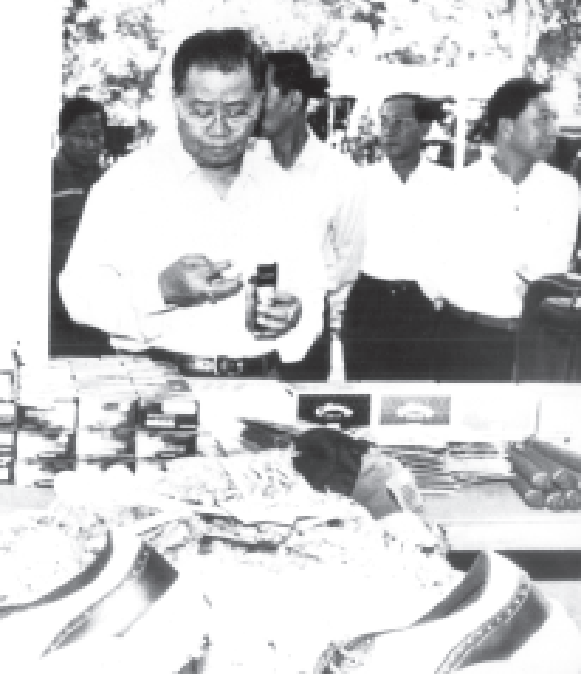
နိုင်ငံတော်အေးချမ်းသာယာရေးနှင့် ဖွံ့ဖြိုးရေးကောင်စီဥက္ကဋ္ဌ တပ်မတော်ကာကွယ်ရေးဦးစီးချုပ် ဗိုလ်ချုပ်မှူးကြီးသန်းရွှေ ဒီဇင်ဘာ ၄ရက်က ရန်ကုန်တိုင်း လှည်းကူးမြို့နယ် ရဲမန်ကျွန်းသာယာဂေါက်ကွင်း၌ ကျင်းပသည့် ၂၀၀၄ခုနှစ် နိုင်ငံတော်အေးချမ်းသာယာရေးနှင့် ဖွံ့ဖြိုးရေးကောင်စီဥက္ကဋ္ဌဖလား ဂေါက်သီးရိုက်ပြိုင်ပွဲတွင် ခင်းကျင်းပြသရောင်းချလျက်ရှိသည့် ဆိုင်ခန်းများကို လှည့်လည်ကြည့်ရှုစစ်ဆေးအားပေးစဉ်။ (သတင်းစဉ်)

နိုင်ငံတော်အေးချမ်းသာယာရေးနှင့် ဖွံ့ဖြိုးရေးကောင်စီဥက္ကဋ္ဌ တပ်မတော်ကာကွယ်ရေးဦးစီးချုပ် ဗိုလ်ချုပ်မှူးကြီးသန်းရွှေသည် နံနက် ၁၀ နာရီ ၄၅ မိနစ်တွင် ၂၀၀၄ခုနှစ် နိုင်ငံတော်အေးချမ်းသာယာရေးနှင့် ဖွံ့ဖြိုးရေးကောင်စီဥက္ကဋ္ဌဖလား ဂေါက်သီးရိုက်ပြိုင်ပွဲကျင်းပသည့် ရဲမန်ကျွန်းသာယာဂေါက်ကွင်းသို့ ရောက်ရှိလာရာ နိုင်ငံတော်အေးချမ်းသာယာရေးနှင့် ဖွံ့ဖြိုးရေးကောင်စီ ဒုတိယဥက္ကဋ္ဌ ဒုတိယတပ်မတော်ကာကွယ်ရေးဦးစီးချုပ် ကာကွယ်ရေးဦးစီးချုပ်(ကြည်း) ဒုတိယဗိုလ်ချုပ်မှူးကြီးမောင်အေး၊ နိုင်ငံတော်အေးချမ်းသာယာရေးနှင့် ဖွံ့ဖြိုးရေးကောင်စီဝင် ဗိုလ်ချုပ်ကြီးသူရဇွန်မင်း၊ နိုင်ငံတော်ဝန်ကြီးချုပ် ဒုတိယဗိုလ်ချုပ်ကြီးစိုးဝင်း၊ နိုင်ငံတော်အေးချမ်းသာယာရေးနှင့် ဖွံ့ဖြိုးရေးကောင်စီဝန်ထမ်းများ၊ ကာကွယ်ရေးဦးစီးချုပ်(ရေ)၊ ကာကွယ်ရေးဦးစီးချုပ်(လေ)နှင့် အစိုးရအဖွဲ့ အဖွဲ့ဝင် ဝန်ကြီးများက ကြိုဆိုကြသည်။ ယင်းနောက် ဗိုလ်ချုပ်မှူးကြီးသန်းရွှေသည် ၂၀၀၄ခုနှစ် နိုင်ငံတော်အေးချမ်းသာယာရေးနှင့် ဖွံ့ဖြိုးရေးကောင်စီဥက္ကဋ္ဌဖလား ဂေါက်သီးရိုက်ပြိုင်ပွဲ ပြိုင်ပွဲဝင်အားကစားသမားများအား ရင်းရင်းနှီးနှီးနှုတ်ဆက်အားပေးစကားပြောကြားပြီး ဂေါက်သီးရိုက်ပြိုင်ပွဲ အထိမ်းအမှတ်အဖြစ် ခင်းကျင်းပြသရောင်းချလျက်ရှိသည့် ဂေါက်သီးရိုက်အားကစားပစ္စည်းအရောင်းဆိုင်များ၊ အားကစားဝတ်စုံအရောင်းဆိုင်များ၊ စားသောက်ဆိုင်များနှင့် အမှတ်(၁)စက်မှုဝန်ကြီးဌာန ဝင်းသူဇာအရောင်းဆိုင်တို့ကို လှည့်လည်ကြည့်ရှုစစ်ဆေးအားပေးသည်။