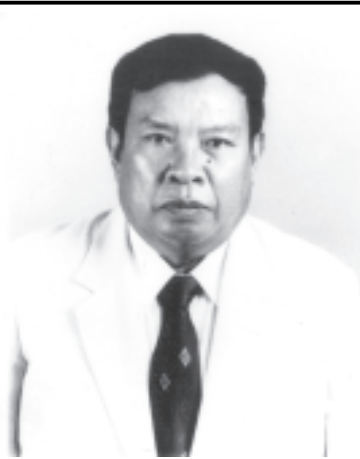
လာအိုပြည်သူ့ဒီမိုကရက်တစ်သမ္မတနိုင်ငံ ဝန်ကြီးချုပ် မစ္စတာဘောင်ညိုဝိုရာချစ်။