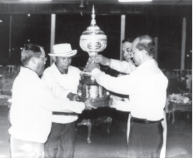
၂၀၀၄ခုနှစ် နိုင်ငံတော်အေးချမ်းသာယာရေးနှင့် ဖွံ့ဖြိုးရေးကောင်စီဥက္ကဋ္ဌဖလား ဂေါက်သီးရိုက်ပြိုင်ပွဲဆုရရှိ ခြင်းအခမ်းအနားတွင် နိုင်ငံတော်အေးချမ်းသာယာရေးနှင့် ဖွံ့ဖြိုးရေးကောင်စီဥက္ကဋ္ဌ တပ်မတော်ကာကွယ်ရေးဦးစီးချုပ် ဗိုလ်ချုပ်မှူးကြီးသန်းရွှေ ကိုယ်စား နိုင်ငံတော်အေးချမ်းသာယာရေးနှင့် ဖွံ့ဖြိုးရေးကောင်စီ အတွင်းရေးမှူး(၁) ဒုတိယဗိုလ်ချုပ်ကြီးသိန်းစိန်က အသင်းလိုက်(အကျောပေး)ပြိုင်ပွဲနှင့် (အကျောမဲ့)ပြိုင်ပွဲတို့တွင် ပထမဆုရရှိသော ကာကွယ်ရေးဝန်ကြီးဌာနအသင်းအား ဆုတံဆိပ်၊ ဆေးအပ်ချီးမြှင့်စဉ်။ (သတင်းစဉ်)

ဆုများ ချီးမြှင့်ခြင်းအခမ်းအနားအပြီးတွင် နိုင်ငံတော်အေးချမ်းသာယာရေးနှင့်ဖွံ့ဖြိုးရေးကောင်စီအတွင်းရေးမှူး (၁) ဒုတိယဗိုလ်ချုပ်ကြီးသိန်းစိန်၊ ပြိုင်ပွဲကျင်းပရေးဦးစီးကော်မတီ ဥက္ကဋ္ဌ အမှတ်(၁)စက်မှုဝန်ကြီးဌာန ဝန်ကြီး