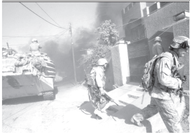
ဗလူးဂျာဖြူတွင် အိမ်တစ်အိမ်အတွင်း ဝင်ရောက်စီးနင်းရန် ကြိုးစားနေသော အမေရိကန်တပ်ဖွဲ့ဝင်များကို ဒီဇင်ဘာ၂ရက်က တွေ့ရစဉ်။ (ဓာတ်ပုံ-အင်တာနက်)