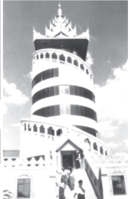
တိုင်းရင်းသားရိုးရာပွဲတော်များကို တစ်နေရာတည်းတွင် စုစုစည်းစည်း ကျင်းပပေးလျက်ရှိသည့် သာကေတမြို့နယ် ပြည်ထောင်စုတိုင်းရင်းသားကျေးရွာရှိ အထင်ကရနန်းမြင့်မျှော်စင် ကြီးကို ဤသို့ နံညားထည်ဝါစွာ တွေ့ရသည်။ ဓာတ်ပုံ-တင်ဇိုး(မြန်မာ့အလင်း)

၂၀၀၄ ခုနှစ် ချင်းရိုးရာခွာဒိပွဲတော်ကြီးကို သာကေတမြို့နယ် ပြည်ထောင်စုတိုင်းရင်းသား ကျေးရွာတွင်ကျင်းပရာ ချင်းတိုင်းရင်းသူ တိုင်းရင်း သားလေးများက ဤသို့ ချင်းရိုးရာ ပါးညှပ်အရ ဖြင့် မျှော်မြေတင်ဆက်ကြသည်။ ဓာတ်ပုံ-တင်ဇိုး(မြန်မာ့အလင်း)