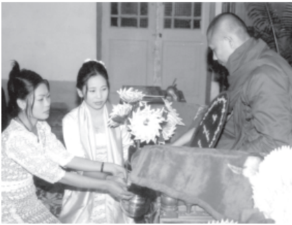
မော်လမြိုင်ကျွန်းမြို့ မူလညောင်တုန်းကျောင်းတိုက်၏ စုပေါင်းဘုံကထိန် ပွဲတော်နှင့် ကထိန်လျာသက်န်း ဆက်ကပ်လှူဒါန်းပွဲကို နိုဝင်ဘာ ၁၅ ရက်က အဆိုပါကျောင်းတိုက်၌ ကျင်းပရာ ကထိန်မတည်အလှူရှင် ရုပ်ရှင်နှင့် ဒီဇီယိုသရုပ်ဆောင် မဇ္ဈန်းထက်က မူလညောင်တုန်းကျောင်းတိုက် အရပ်ကတော်ဘန္တုသုမင်္ဂလိယ ကထိန်လျာသက်န်း ဆက်ကပ်လှူဒါန်းစဉ်။ (၀၉၇)