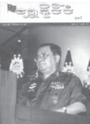
အဆိုပါကုန်သွယ်အတွဲ(၃)အမှတ်(၁၆)ကို ထုတ်ဝေပြန်ချိထားသည်။

ပြည်ထောင်စုကြံ့ခိုင်ရေးနှင့် ဖွံ့ဖြိုးရေးအသင်းဌာန ချုပ် ပညာရေးရာဌာနကထုတ်ဝေသည့် ရွှေနိုင်ငံကုန်သွယ် အတွဲ(၃)၊ အမှတ်(၁၆)ကို ထုတ်ဝေပြန်ချိထားသည်။