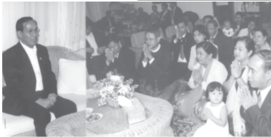
ပြည်ထောင်စုမြန်မာနိုင်ငံတော် နိုင်ငံတော်ဝန်ကြီးချုပ် ဒုတိယဗိုလ်ချုပ်ကြီးစိုးဝင်းအား လာအိုပြည်သူ့ဒီမိုကရက်တစ်သမ္မတနိုင်ငံဆိုင်ရာ ပြည်ထောင်စုမြန်မာနိုင်ငံသံအမတ်ကြီးနှင့်စုနီ၊ စစ်သံရုံးနှင့်စုနီ၊ သံရုံး၊ စစ်သံရုံးဝန်ထမ်းများ၊ မိသားစုများက ဂါရုပြုကန်တော့ကြသည်။ (သတင်းစဉ်)

ပြည်ထောင်စုမြန်မာနိုင်ငံတော် နိုင်ငံတော်ဝန်ကြီးချုပ် ဒုတိယဗိုလ်ချုပ်ကြီးစိုးဝင်း လာအိုပြည်သူ့ဒီမိုကရက်တစ်သမ္မတနိုင်ငံ သမ္မတ မစ္စတာခမ်တေးဆီဖန်ဒုံက တည်ခင်းစဉ်ခံသည့် ဂုဏ်ပြုနေ့လယ်စာစားပွဲကို တက်ရောက်စဉ်။