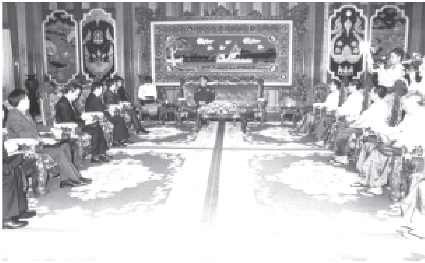
ရန်ကုန် ဒီဇင်ဘာ ၃

နိုင်ငံတော်ဝန်ကြီးချုပ် ဒုတိယဗိုလ်ချုပ်ကြီးစိုးဝင်း တရုတ်ပြည်သူ့ သမ္မတနိုင်ငံ နိုင်ငံခြားရေးဝန်ကြီးဌာန ဒုတိယဝန်ကြီး မစ္စတာဂူတာဝေနှင့် အဖွဲ့အား ဇေယျာသီရိဗိမာန်ခန်းမ၌ လက်ခံတွေ့ဆုံသည်။ (သတင်းစဉ်)