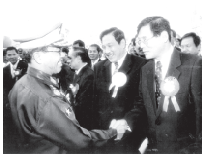
ပြည်ထောင်စုမြန်မာနိုင်ငံတော် နိုင်ငံတော်ဝန်ကြီးချုပ် ဒုတိယဗိုလ်ချုပ်ကြီးစိုးဝင်း ပထမအကြိမ် ငါးနိုင်ငံ ကုန်စည်ပြပွဲ-၂၀၀၄ ဖွင့်ပွဲအခမ်းအနားသို့ တက်ရောက်လာကြသော နိုင်ငံများမှ ဝန်ကြီးများ၊ ကိုယ်စားလှယ် အဖွဲ့ခေါင်းဆောင်များအား ရင်းနှီးမြှုပ်နှံမှု တိုက်ဆက်စဉ်။

ယင်းနောက် မြန်မာကုန်စည်ရင်းစင်တော် အဆောက်အအုံခန်းမ၌ အခမ်းအနားကို ဆက်လက်ကျင်းပရာ ပထမအကြိမ် ငါးနိုင်ငံ ကုန်စည်ပြပွဲ-၂၀၀၄ ပြပွဲကျင်းပရေး ဗဟိုကော်မတီ နာယက စီးပွားရေးနှင့် ကူးသန်းရောင်းဝယ်ရေးဝန်ကြီးဌာန ဝန်ကြီး ဒိုလ်ချုပ်မြင့်ဆွေနှင့် အမှုဆောင်အရာရှိကြီးများ ပါဝင် ဆွေးနွေးချက်များကို အတည်ပြုခဲ့သည်။