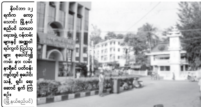
နိုင်ငံတော် ၁၂ ရက်က ကော့ ဘောင်း မြို့နယ် စည်ပင် သာယာ ရေးအဖွဲ့ ဝန်ထမ်း များနှင့် အတ္ထုပ္ပတ္တိ ရုပ်ကွက် ပြည်သူ များ စုပေါင်း၍ ကမ်း နား လမ်း နားရိပ် ပတ်ဝန်း ကျင်တွင် စုပေါင်း သန့် ရှင်း ရေး ဆောင် ရွက် ကြ စဉ်။ (မြို့နယ်စည်ပင်)

တွဲတေးမြို့နယ် စကြာ ကျောင်းတိုက် ဘုန်းတော်ကြီး ကျောင်းတွင် ကျင်းပ သည်။ အခမ်းအနားတွင် မြို့နယ် သံဃ နာယက ရွှေကျင်ရှိဏ်းဆရာတော်