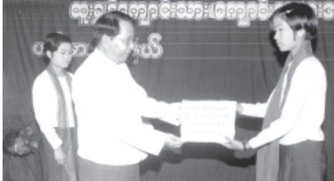
ပြည်ထောင်စုကြံ့ခိုင်ရေးနှင့် ဖွံ့ဖြိုးရေးအသင်း ပဟိုအတွင်းရေးမှူး ပြန်ကြားရေးဝန်ကြီးဌာနဝန်ကြီး ဗိုလ်မှူးချုပ်ကျော်ဆန်း နိုဝင်ဘာ ၂၈ ရက်က မုံရွာခရိုင် ယင်းမာပင်မြို့နယ် အထက်တန်းကျောင်းမှ ကျောင်းသူများအား ပြန်ကြားရေးဝန်ကြီးဌာနဝန်ကြီး ဗိုလ်မှူးချုပ်ကျော်ဆန်းက ပြည်ထောင်စုကြံ့ခိုင်ရေးနှင့် ဖွံ့ဖြိုးရေးအသင်း နာယကအဖွဲ့ဝင် နိုင်ငံတော်ဝန်ကြီးချုပ် ဒုတိယဗိုလ်ချုပ်ကြီးစိုးဝင်း၏ စီစဉ်ပေးမှုဖြင့် တက္ကသိုလ်ပညာပြီးဆုံးသည့်အထိ သင်ယူနိုင်ရေးအတွက် ပညာသင်ထောက်ပံ့ငွေများပေးအပ်စဉ်။ (သတင်းစဉ်)

ကျေးရွာ ၏ အား၊ နိုင်ငံတော်၏ အား၊ စေတနာရှင်တွေကြောင့် တတ်နိုင်သူများ ပြည်သူလူထု အလှူရှင်များ၏ အားများပင်ဖြစ်ကြောင်း၊ ယင်းအားသုံးအားစလုံးကိုလည်း ပြည်ထောင်စုကြံ့ခိုင်ရေးနှင့် ဖွံ့ဖြိုးရေးအသင်းဝင်များက ပူးတွဲပါဝင် လုပ်ဆောင်ပေးကြရမည်ဖြစ်ကြောင်းက ပူးပေါင်းဆောင်ရွက်နိုင်တော့အခွင့်ရက လူ့စွမ်းအားအရင်းအမြစ် ဖွံ့ဖြိုးတိုးတက်စေရေးအတွက် ပညာရေးကို အထူးအားပေးမြှင့်တင်ပေးလျက်ရှိကြောင်း၊ ၁၉၈၈ ခုနှစ်တစ်စိတ်တစ်ဒေသတွင် ကျေးလက်ပြည်သူများအနေဖြင့် အထက်တန်းပညာ၊ အထူးသဖြင့် အဆင့်မြင့်ပညာ သင်ကြားရေးအတွက် လက်လှမ်းမမီခဲ့ကြကြောင်း၊ တပ်မတော်အစိုးရတစ်ဆင့်ယူပြီးနောက် ယခုအချိန်တွင်မူ