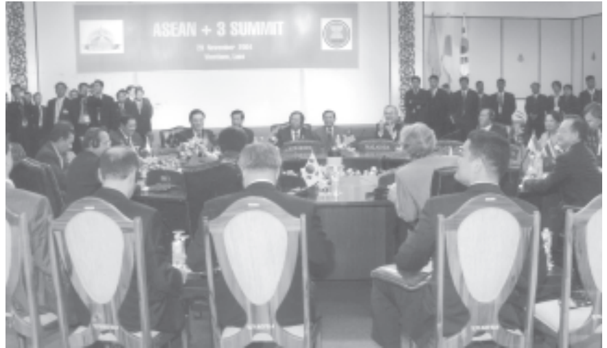
B (Theatre-1)၌ကျင်းပရာ နိုင်ငံတော် ဝန်ကြီးချုပ် ဒုတိယဗိုလ်ချုပ်ကြီးစိုးဝင်း နှင့် အာဆီယံနိုင်ငံအကြီးအကဲ၊ အစိုးရအဖွဲ့ အကြီးအကဲများ တက်ရောက် လက်မှတ်ရေးထိုးကြသည်။

ထို့နောက် (၁၀)ကြိမ်မြောက် အာဆီယံထိပ်သီးညီလာခံကို ကျင်းပသည်။ (၁၀)ကြိမ်မြောက် အာဆီယံထိပ်သီးညီလာခံသို့ ဘရူနိုင်း ဒါရုဆလမ်နိုင်ငံ ဘုရင် ဆူလ်တန် ဟာဂျီဟာဆာနာလ် ဘိုလ်ကီးယား၊ အစိုးရအဖွဲ့ဝင်ဒါဒါလ်၊ ကမ္ဘောဒီးယားနိုင်ငံ ဝန်ကြီးချုပ် မစ္စတာ ဆမ်ဘက်ဟွန်ဆင်၊ အင်ဒိုနီးရှား သမ္မတနိုင်ငံ သမ္မတ မစ္စတာ ဆူဆီလ်တန်ဘန်းဘန်ယုဒိုယိုနို၊ လာအိုပြည်သူ့ ဒီမိုကရက်တစ်သမ္မတနိုင်ငံ ဝန်ကြီးချုပ် မစ္စတာ ဘောင်ညို ရီရာချစ်၊ မလေးရှားနိုင်ငံဝန်ကြီးချုပ် ဒါဟိုဆီရို အဗ္ဗဒူလာဘာဟာဂျီ အာမက်ဘာဒါ၊ ပြည်ထောင်စု မြန်မာနိုင်ငံတော် နိုင်ငံတော်ဝန်ကြီးချုပ် ဒုတိယဗိုလ်ချုပ်ကြီး စိုးဝင်း၊ ဖိလစ်ပိုင်သမ္မတနိုင်ငံ သမ္မတ မစ္စတာလီဂိုယာမာဂါပါဂလ် အာနိုယို၊ စင်ကာပူသမ္မတနိုင်ငံ ဝန်ကြီးချုပ် မစ္စတာ လီရှန်းလွန်း၊ ထိုင်းနိုင်ငံဝန်ကြီးချုပ် ဒေါက်တာ သက်ဆင်ရှင်နာဝါ၊ ဗီယက်နမ်ဆိုရှယ်လစ်သမ္မတနိုင်ငံ ဝန်ကြီးချုပ်