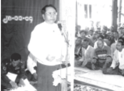
ပြည်ထောင်စုကြံ့ခိုင်ရေးနှင့် ဖွံ့ဖြိုးရေးအသင်း ပဟိုအတွင်းရေးမှူး ပြန်ကြားရေးဝန်ကြီးဌာနဝန်ကြီး ဗိုလ်မှူးချုပ်ကျော်ဆန်း နိုဝင်ဘာ ၂၈ ရက်က မုံရွာခရိုင် မောက်သရက်ကျေးရွာတွင် ကျေးရွာပြည်သူများနှင့် တွေ့ဆုံပွဲတွင် အမှာစကားပြောကြားစဉ်။ (သတင်းစဉ်)

ဥက္ကဋ္ဌများနှင့် အဖွဲ့ဝင်များ၊ လူမှုရေးအသင်းအဖွဲ့များမှ ရပ်မိရပ်ဖများ၊ ကျေးလက် ပြည်သူလူထုများနှင့် ရင်းရင်းနှီးနှီးတွေ့ဆုံပွဲ ကျင်းပပြီးနောက် ပြန်ကြားရေးဝန်ကြီးဌာနအတွက် ဆွေးနွေးသည့် သက်ဆိုင်ရာကျေးရွာ တာဝန်ရှိသူများက မိမိတို့ကျေးရွာ အခြေအနေများကို တင်ပြကြသည်။