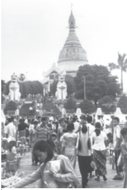
တန်ဆောင်မုန်းလပြည့်နေ့က မဟာဝိဇယစေတီတော်တွင် ကုသိုလ် ပြုသူ ဘုရားဖူးပြည်သူများဖြင့် စည်ကားစွာတွေ့ရစဉ်။

ရန်ကုန်တောင်ပိုင်းခရိုင် သန်လျင် မြို့ သမိုင်းဝင်ဆံတော်ရှင်ကျိက္ကခေါက် စေတီတော်မြတ် တန်ဆောင်တိုင် ဗုဒ္ဓပူဇော်ပွဲ (၂၃)ကြိမ်မြောက် မသိုးသင်္ကန်းရက်ပြင်ပွဲတွင် ယမန် နေ့ ညနေ၅နာရီတွင် စေတီတော် ရင်ပြင်တန်ဆောင်ခြံကျင်းပရာ ညပိုင်း တွင် စေတီတော်ရင်ပြင် တန်ဆောင် များ၌ စတုဒိသာ ကျေးဇူးသုများ၊ ပန်း၊ ရေချမ်း၊ ဆီမီးကပ်လှူသူများဖြင့် အထူးစည်ကားလျက်ရှိသည်။ ထို့ နောက် မသိုးသင်္ကန်းရက်ပြင်ပွဲ ဆု ရရှိသူများအား တာဝန်ရှိသူများက ဆုများချီးမြှင့်ကြသည်။ တန်ဆောင်မုန်းလပြည့် (ယနေ့) နံနက် ၇နာရီတွင် စေတီတော် အရှေ့ ဘက် ကြာကန်စေတီကြီး၌ မြို့နယ် အတွင်းရှိ ကျောင်းတိုက်အသီးသီးမှ ဆရာတော်သံဃာတော် ၂၃ ပါးတို့