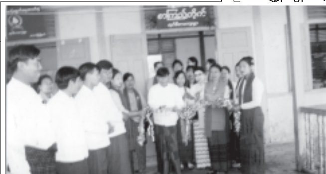
ကျေးလက်တစ်ဝိုက်တွင် ကျေးရွာစာကြည့်တိုက်ဖွင့်ပွဲ

ထို့နောက် တောင်သူလယ်သမားများ၏ ဆွေးနွေးမေးမြန်းချက်များကို တာဝန်ရှိသူများက ဖြေကြားကြပြီး စစ်သမိုင်းစိုက်ပျိုးထားသော ရွှေမြန်မာနှင့် သုခရင်စပါး စိုက်ခင်းများအား တာဝန်ရှိသူများနှင့် တောင်သူလယ်သမားများက ကြည့်ရှုလေ့လာကြကြောင်း သိရသည်။ (မြို့နယ် ပြန်/ဆက်)