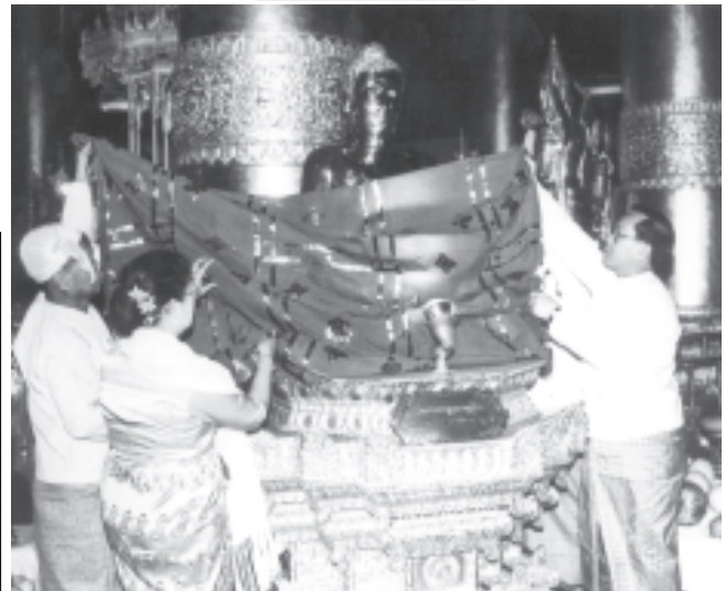
နိုင်ငံတော်ဝန်ကြီးချုပ် ဗိုလ်ချုပ်ကြီးဖိုးဝင်းနှင့်ဇနီး ဒေါ်သန်းသန်းနွဲ့တို့က ဝရဒါဌာဓာတုဓေတိယ ဇွယ်တော်မြတ်ဓေတီတော်(ရန်ကုန်) နဝမအကြိမ် ဗုဒ္ဓပူဇော်ယဉ်တော် ဗုဒ္ဓါဘိသေက အဓိကဓာတင်ပွဲ၊ ရွှေကြာ သင်္ကန်း ကပ်လှူပူဇော်ပွဲနှင့် ဆွမ်းဆန်စိမ်းလောင်းလှူပွဲတွင် မဟာကရုဏာမုဒြာ ဗုဒ္ဓရုပ်ပွားဆင်းတုတော်အား ရွှေကြာသင်္ကန်း ဆက်ကပ်လှူဒါန်းစဉ်။ (သတင်းစဉ်)

နိုင်ငံတော် အေးချမ်းသာ ယာရေးနှင့် ဖွံ့ဖြိုးရေးကောင်စီ အတွင်းရေးမှူး(၁) ဗိုလ်ချုပ်ကြီးသိန်းစိန်နှင့် ဇနီး ဒေါ်ခင်ခင်ဝင်း တို့က ဝရဒါဌာ ဓာတုဓေတိယ ဇွယ်တော်မြတ် ဓေတီတော် (ရန်ကုန်) နဝမ အကြိမ် ဗုဒ္ဓပူဇော်ယဉ်တော် ဗုဒ္ဓါ ဘိသေက အဓိကဓာ တင်ပွဲ၊ ရွှေကြာ သင်္ကန်း ကပ်လှူပူဇော် ပွဲနှင့် ဆွမ်းဆန်စိမ်းလောင်းလှူပွဲ တွင် ဖျာနုမုဒြာ ဗုဒ္ဓရုပ်ပွား ဆင်းတုတော်အား ရွှေကြာ သင်္ကန်း ဆက်ကပ်လှူဒါန်းစဉ်။ (သတင်းစဉ်)