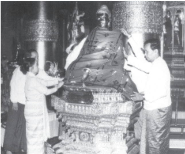
နိုင်ငံတော်အေးချမ်းသာယာရေးနှင့်ဖွံ့ဖြိုးရေးကောင်စီဝင် ဗိုလ်ချုပ်ကြီးသုရက္ခမန်းနှင့်ဇနီး ဒေါ်ခင်လေးသက်တို့က ဝရဒါဌာဓာတုဓေတိယ ဇွယ်တော်မြတ်ဓေတီတော်(ရန်ကုန်) နဝမအကြိမ် ဗုဒ္ဓပူဇော်ယဉ်တော် ဗုဒ္ဓါဘိသေက အဓိကဓာတင်ပွဲ၊ ရွှေကြာသင်္ကန်း ကပ်လှူပူဇော်ပွဲနှင့် ဆွမ်းဆန်စိမ်းလောင်းလှူပွဲတွင် လာဘာမုဒြာ ဗုဒ္ဓရုပ်ပွား ဆင်းတုတော်အား ရွှေကြာသင်္ကန်း ဆက်ကပ်လှူဒါန်းစဉ်။ (သတင်းစဉ်)