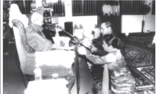
နိုဝင်ဘာ ၂၄ ရက်က ဟိုတယ်နှင့်ခရီးသွားလာရေးလုပ်ငန်းဝန်ကြီးဌာန ဝန်ကြီး ဦးလှိုင်အောင်နှင့်အစိုးရ အဖွဲ့မှဝင် ဝန်ထမ်းမိသားစုများ၏ (၁၂) ကြိမ်မြောက် ဘုံကထိန်တွင် ဆရာတော်ဘွဲ့ ကထိန်သင်တန်းဆက်တက် လှူဒါန်းစဉ်။ (ဟိုတယ်/ခရီး)