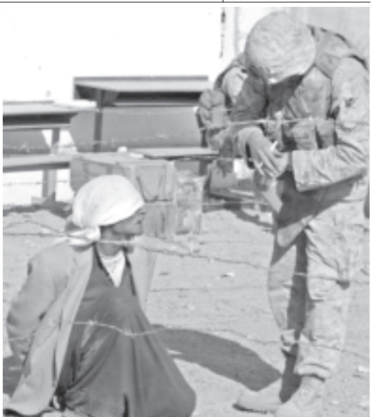
ဗလူးဂျာမြို့တွင် အမေရိကန်တပ်ဖွဲ့ဝင်တစ်ဦးက ဖမ်းဆီးထားသော အီရတ်တစ်ဦးအား စစ်ဆေးပေးနေသည့်ကို နိုဝင်ဘာ ၂၁ ရက်က တွေ့ရစဉ်။

ယခုအခါ အငှားယာဉ်ကားအမျိုး မှာ ဒီဂျစ်တယ်ကင်မရာ တပ်ဆင်သည့် အစီအစဉ်ကိုစမ်းသပ်ခဲ့ကြောင်းလာမည့် ဧပြီလတွင် အငှားယာဉ် ၂၆ စီးနှင့်တွင်