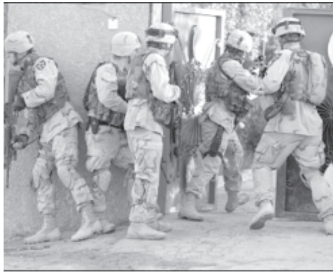
ရာမာဒီမြို့တွင် အိမ်တစ်အိမ် အတွင်းသို့ ဝင်ရောက်စီးနင်းရန် ကြိုးစားနေသော အမေရိကန် တပ်ဖွဲ့ ဝင်များကို နိုဝင်ဘာ ၂၁ရက်က တွေ့ရစဉ်။

အဆိုပါ ဘတ်စ်ကားသည် မဂ်နီးတပ်ဖွဲ့ဝင်များရှိရာသို့ အတင်းမောင်းဝင်လာသဖြင့် မဂ်နီးတပ်ဖွဲ့ဝင်များက ပစ်ခတ်ခဲ့ခြင်းဖြစ်သည်ဟုဆိုသည်။ အမေရိကန်တပ်ဖွဲ့ဝင်များနေရာယူထားသော ဗဟိုအုပ်ချုပ်ရေးမှူး အဆောက်အအုံအနီး၌ဖြစ်ပွားခဲ့သည့်ပစ်ခတ်မှုတွင် အီရတ်ခုနစ်ဦးသေဆုံးကြောင်း အိမ်အင်အေရိုက်တာ