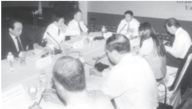
တပ်မတော် (ကြည်ရေးလေ) ဘောလုံးပြိုင်ပွဲ ပထမအဆင့်အုပ်စုပတ်လည်ပြိုင်ပွဲဆက်

အပြည်ပြည်ဆိုင်ရာ ဂူရှူးအဖွဲ့ချုပ်၏ (၁၈)ကြိမ်မြောက် အလုပ်အမှုဆောင်စည်းဝေးအစည်းကို ယနေ့နေ့နံနက်၉နာရီက ရန်ကုန်မြို့ရှိ Grand Plaza Park Royal ဟိုတယ်တွင် ကျင်းပပြုလုပ်သည်။ (ယာဝ)