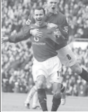
အောင်ပွဲခံ

မန်ချက်စတာယူနိုက်တက်အသင်းအတွက် ပထမဆုံးသော ဂိုးကို သွင်းပေးသူများ ဖျော်ဖြေစွာ အပန်းဖြေ အနားယူနိုင်ရန်အတွက် နံနက် ၈ နာရီခွဲမှ ၁ နာရီအထိ ဖွင့်လှစ်ထားမည် ဖြစ်ကြောင်းသတင်းရရှိသည်။ (သတင်းစဉ်)