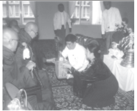
နိုဝင်ဘာ ၂၀ ရက်က လယ်ယာစိုက်ပျိုးရေးနှင့် ဆည်မြောင်းဝန်ကြီးဌာန (၁၃)ကြိမ်မြောက် မိသားစုဘုံကထိန် သင်တန်းကပ်လှည့်ပွဲတွင် ဝန်ကြီးဗိုလ်ချုပ်ဦးစီး ဦးစီး ဒေါ်နီနီဝင်းတို့က ကထိန်လှည့်သင်တန်းကို ဆရာတော် ဆက်ကပ်လှူဒါန်းစဉ်။ (လယ်ယာ/ဆည်မြောင်း)

ထို့နောက် တိုင်းမှူးနှင့် ဝန်ကြီးတို့က အမှာစကားပြောကြားကြပြီး အလှူရှင်များက ကျောင်းအတွက် အလှူငွေများကို ပေးအပ်ကြကြောင်း သတင်းရရှိသည်။ (သတင်းစဉ်)