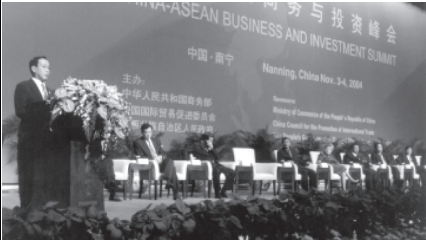
ပြည်ထောင်စုမြန်မာနိုင်ငံတော် နိုင်ငံတော်ဝန်ကြီးချုပ် ဒုတိယဗိုလ်ချုပ်ကြီးစိုးဝင်းသည် ၂၀၀၄ ခုနှစ် နိုဝင်ဘာ ၃ ရက် ညနေ ၃ နာရီတွင် တရုတ် ပြည်သူ့သမ္မတနိုင်ငံ ကွမ်စီးကျွန်း ကိုယ်ပိုင်အုပ်ချုပ်ရေးဒေသ နန်နင်းမြို့၌ကျင်းပသော တရုတ်-အာဆီယံ စီးပွားရေးနှင့် ရင်းနှီးမြှုပ်နှံမှုဆိုင်ရာ ထိပ်သီးဆွေးနွေးပွဲ ဖွင့်ပွဲအခမ်းအနားသို့ တက်ရောက်၍ မိန့်ခွန်းပြောကြားစဉ်။

နန်နင်းမြို့တော်သို့ ပြည်ထောင်စုမြန်မာနိုင်ငံတော် နိုင်ငံတော်ဝန်ကြီးချုပ် ဒုတိယဗိုလ်ချုပ်ကြီးစိုးဝင်း၊ ကမ္ဘောဒီးယားနိုင်ငံ ဝန်ကြီးချုပ် မစ္စတာ အမ်ဒက် ဟွန်ဆိုင်နှင့် ဇနီး၊ လာအိုပြည်သူ့သမ္မတနိုင်ငံ ဝန်ကြီးချုပ် မစ္စတာ ဘွန်ညိုဝိုရာချစ်နှင့် ဇနီး၊ ဗီယက်နမ်နိုင်ငံနှင့် ထိုင်းနိုင်ငံတို့မှ ဒုတိယ ဝန်ကြီးချုပ်များ၊ ဘရူနိုင်းနိုင်ငံ၊ အင်ဒိုနီးရှားနိုင်ငံ၊ စင်ကာပူနိုင်ငံ၊ ဖိလစ်ပိုင် နိုင်ငံ၊ မလေးရှားနိုင်ငံတို့မှ သက်ဆိုင်ရာဝန်ကြီးများ၊ အိမ်ရှင် တရုတ်ပြည်သူ့ သမ္မတနိုင်ငံ နိုင်ငံတော်ကောင်စီ ဒုတိယဝန်ကြီးချုပ် မဒမ်ဂျွန်နီ ကူးသန်း ရောင်းဝယ်ရေးဝန်ကြီးဌာန ဝန်ကြီး၊ အာဆီယံအတွင်းရေးမှူးချုပ်နှင့် တာဝန်ရှိ သူများ ရောက်ရှိနေကြသည်။ ထို့ပြင် ပြည်တွင်းပြည်ပ လုပ်ငန်းရှင်ပေါင်း ၁၈၀၀ ကျော်ပါ ရောက်ရှိလျက်ရှိသည်။