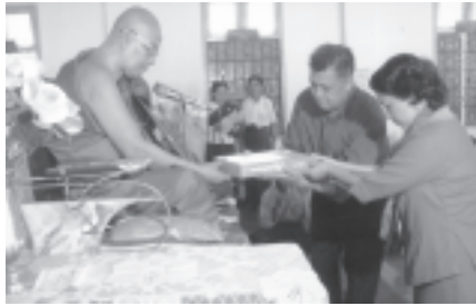
မက်ပင်ခိုင်စာသင်တိုက်ကထိန်အလှူပွဲ

ကိုးမိုင်မဟာစည်သာသနာ့ရိပ်သာတွင် ဘုံကထိန်ပွဲကို ယနေ့နံနက် ၉နာရီက မဟာစည်ဓမ္မာရုံကြီးတွင် စည်ကားသိုက်မြိုက်စွာကျင်းပသည်။