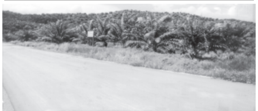
တိုင်းရင်းသားပြည်သူများ အလုပ်အကိုင်အခွင့်အလမ်း ပိုမိုရရှိစေမည့် တနင်္သာရီတိုင်း ကော့သောင်းမြို့နယ်ရှိ ယုဇာကုမ္ပဏီလီမိတက် ဆီအုန်းစိုက်ခင်းကို ဤသို့တွေ့ရသည်။