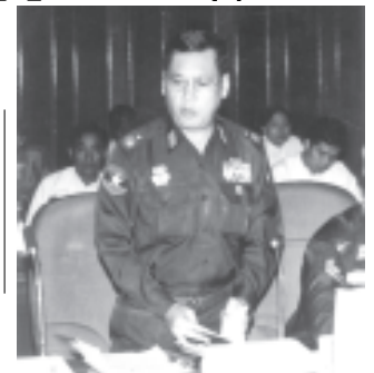
အမျိုးသားစီမံကိန်းနှင့် စီးပွားရေးဖွံ့ဖြိုး တိုးတက်မှုဝန်ကြီးဌာန ဝန်ကြီး ဦးစိုးသာ ဆီအုန်း၊ ရော်ဘာနှင့် အမယ်သစ်သီးနှံများ စိုက်ပျိုးရေးလုပ်ငန်း ဖွံ့ဖြိုးတိုးတက်ရေး ညှိနှိုင်းအစည်းအဝေး(၈/၂၀၀၄) တွင် ရှင်းလင်းတင်ပြစဉ်။ (သတင်းစဉ်)