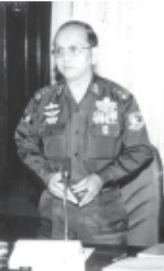
ဆွေးနွေးဟောကြား အတွင်းရေးမှူး(၁) ဒုတိယဗိုလ်ချုပ်ကြီး သိန်းစိန် ဆီအုန်း၊ ရော်ဘာနှင့် အမယ်သစ် သီးနှံများ စိုက်ပျိုးရေး လုပ်ငန်း ဖွံ့ဖြိုး တိုးတက်ရေး ညှိနှိုင်း အစည်းအဝေး(၈/၂၀၀၄) တွင် ဆွေးနွေး ဟောကြားစဉ်။ (သတင်းစဉ်)

ညှိနှိုင်းအစည်းအဝေးသို့ နိုင်ငံတော်အေးချမ်းသာယာရေးနှင့် ဖွံ့ဖြိုးရေးကောင်စီ အတွင်းရေးမှူး(၁) ဒုတိယဗိုလ်ချုပ်ကြီးသိန်းစိန်၊ နိုင်ငံတော် အေးချမ်းသာယာရေးနှင့် ဖွံ့ဖြိုးရေးကောင်စီဝင်များဖြစ်ကြသည့် ဒုတိယဗိုလ်ချုပ်ကြီးရဲမြင့်၊ ဒုတိယဗိုလ်ချုပ်ကြီးအောင်ထွေး၊ ဒုတိယဗိုလ်ချုပ်ကြီးခင်မောင်သန်း၊ ဒုတိယဗိုလ်ချုပ်ကြီးမောင်ဘို၊ ဒုတိယဗိုလ်ချုပ်ကြီးသီဟသူရတင်အောင်မြင့်ဦးနှင့် ဒုတိယဗိုလ်ချုပ်ကြီးတင်အေး၊ ရန်ကုန်တိုင်းအေးချမ်းသာယာရေးနှင့် ဖွံ့ဖြိုးရေးကောင်စီဥက္ကဋ္ဌ ရန်ကုန်တိုင်းစစ်ဌာနချုပ် တိုင်းမှူး ဗိုလ်ချုပ်မြင့်ဆွေ၊ အစိုးရအဖွဲ့ အဖွဲ့ဝင်ဝန်ကြီးများ၊ ဒုတိယဝန်ကြီးများ၊ နိုင်ငံတော်အေးချမ်းသာယာရေးနှင့် ဖွံ့ဖြိုးရေးကောင်စီရုံးမှ တာဝန်ရှိသူများ၊ ဌာနဆိုင်ရာ အကြီးအကဲများ၊ ကရင်ပြည်နယ်၊ တနင်္သာရီတိုင်း၊ ပဲခူးတိုင်း၊ မွန်ပြည်နယ်နှင့် ဧရာဝတီတိုင်းတို့မှ ပြည်နယ်နှင့်တိုင်း အေးချမ်းသာယာရေးနှင့် ဖွံ့ဖြိုးရေးကောင်စီ အတွင်းရေးမှူးများ၊ ပြည်ထောင်စုမြန်မာနိုင်ငံ ကုန်သည်များနှင့်စက်မှုလက်မှုလုပ်ငန်းရှင်များ အသင်းချုပ်ဥက္ကဋ္ဌနှင့် တာဝန်ရှိသူများ၊ မြန်မာနိုင်ငံ ဆီကုန်သည်များအသင်းမှ တာဝန်ရှိသူများ၊ ဆီအုန်းနှင့် ရော်ဘာစိုက်ပျိုးရေးလုပ်ငန်းရှင်များ၊ ဖိတ်ကြားထားသူများ တက်ရောက်ကြသည်။ ညှိနှိုင်းအစည်းအဝေးတွင် နိုင်ငံတော်အေးချမ်းသာယာရေးနှင့် ဖွံ့ဖြိုးရေးကောင်စီဝင် ဗိုလ်ချုပ်ကြီးသုရက္ခမန်းက ဆွေးနွေး ဟောကြားရာ၌ စာမျက်နှာ ၆ ကော်လံ ၁ *