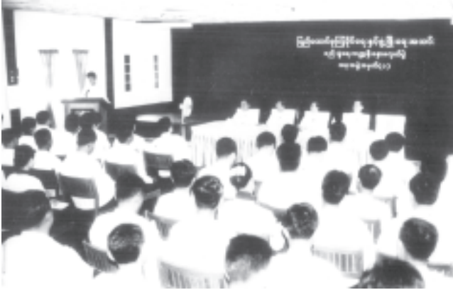
စည်းရုံးရေးကဏ္ဍ နီးနော့ဖလှယ်ပွဲ