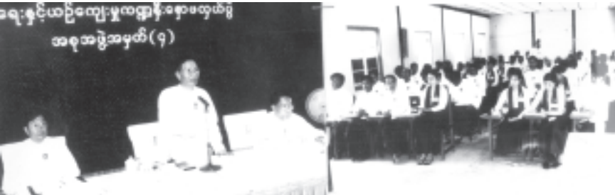
လူမှုရေးနှင့်ယဉ်ကျေးမှုကဏ္ဍ နှီးနှောဖလှယ်ပွဲ