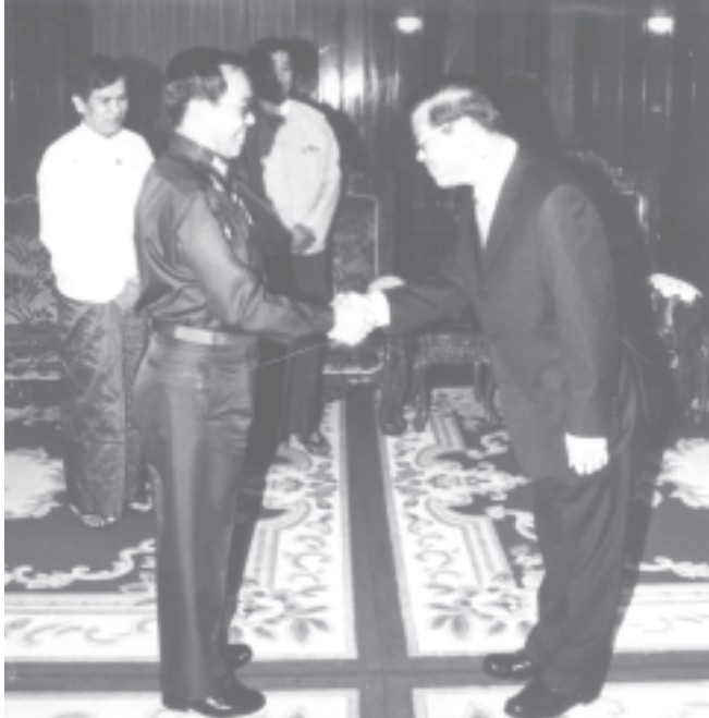
နိုင်ငံဘာ ၁၈ရက်က နိုင်ငံတော်ဝန်ကြီးချုပ် ဒုတိယဗိုလ်ချုပ်ကြီးစိုးဝင်း လာအိုပြည်သူ့ဒီမိုကရက်တစ်သမ္မတ နိုင်ငံ ဒုတိယဝန်ကြီးချုပ်နှင့် နိုင်ငံခြားရေးဝန်ကြီး မစ္စတာဆွန်ဆာဗက်လ်နီဆာဗတ်အား ရန်ကုန်မြို့ ကုန်းမြင့်သာရှိ ဇေယျာသီရိဗိမာန်ခန်းမ၌ တွေ့ဆုံနှုတ်ဆက်စဉ်။ (သတင်း-ကျောစွဲ)(သတင်းစဉ်)

ထို့နောက် မြန်မာ့တပ်မတော် အားကစားအဖွဲ့သည် တပ်မတော် လေယာဉ်ဖြင့် ဗီယက်နမ်ဆိုရှယ်လစ် သမ္မတနိုင်ငံသို့ ထွက်ခွာကြရာ အတွင်း ရေးမှူး(၁) ဒုတိယဗိုလ်ချုပ်ကြီးသိန်းစိန် နှင့်အဖွဲ့ဝင်များက ပို့ဆောင်နှုတ်ဆက် ကြသည်။ (သတင်းစဉ်)