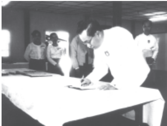
ပြည်ထောင်စုကြံ့ခိုင်ရေးနှင့် ဖွံ့ဖြိုးရေးအသင်း ဗဟိုနာယကအဖွဲ့ဝင် နိုင်ငံတော်ဝန်ကြီးချုပ် ဒုတိယဗိုလ်ချုပ်ကြီးစိုးဝင်း ပြည်ထောင်စုကြံ့ခိုင်ရေးနှင့် ဖွံ့ဖြိုးရေးအသင်း နှစ်ပတ်လည်သင်းလုံးကျွတ်အစည်းအဝေး(၂၀၀၄) အကြံပြုဆွဲဆောင်မှု အစည်းအဝေးသို့ တက်ရောက်ကြောင်း လက်မှတ်ရေးထိုးစဉ်။ (သတင်းစဉ်)

အသင်းကြီးကို ဖွဲ့စည်းတည်ထောင်စဉ်ကစပြီး အေးချမ်းသာယာရေး၊ တရားဥပဒေစိုးမိုးရေးနှင့် နိုင်ငံတော်ဖွံ့ဖြိုးတိုးတက်ရေးလုပ်ငန်းများကို ကြိုးပမ်း ဆောင်ရွက်ရင်း အသင်းအဆင့်ဆင့် စည်းရုံးရေးကို ကျယ်လှမ်းစွာ ဆောင်ရွက်ခဲ့သည်။