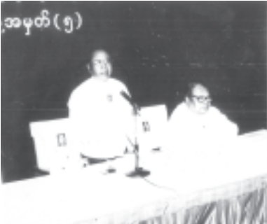
ပညာရေးကဏ္ဍ နှီးနှောဖလှယ်ပွဲ