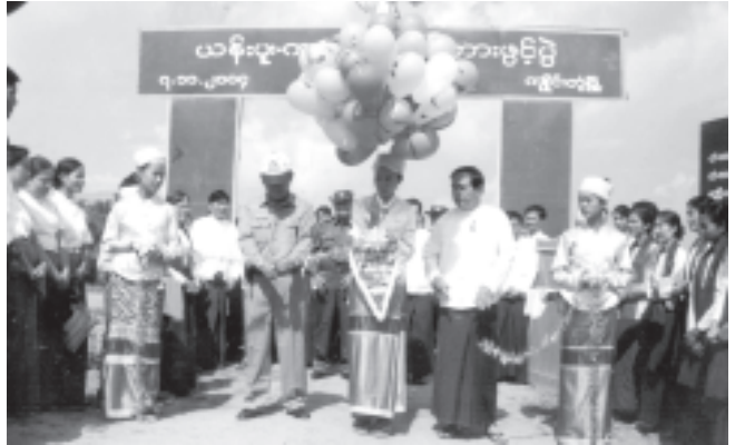
ကျိုင်းတုံမြို့နယ် စည်ပင်သာယာရေးအဖွဲ့နှင့် ပြည်ထောင်စုကြံ့ခိုင်ရေးနှင့် ဖွံ့ဖြိုးရေးအသင်းတို့ ပူးပေါင်းဆောင်ရွက်သည့် ယန်းပူး-ကတိတိုက် ကျေးလက် သစ်သားတံတားဖွင့်ပွဲကို နိုဝင်ဘာ ၇ရက်က ကျင်းပရာ ကြိုက်သော တိုင်းစစ်ဌာနချုပ် တိုင်းမှူးဗိုလ်ချုပ်ခင်မော် တက်ရောက်စဉ်နှင့် ပြည်ထောင်စုကြံ့ခိုင်ရေးနှင့် ဖွံ့ဖြိုးရေးအသင်း ဗဟိုအလုပ်အမှုဆောင် ဝန်ကြီး ဗိုလ်ချုပ်သိန်းဆွေ ဖွင့်လှစ်ပေးစဉ်။