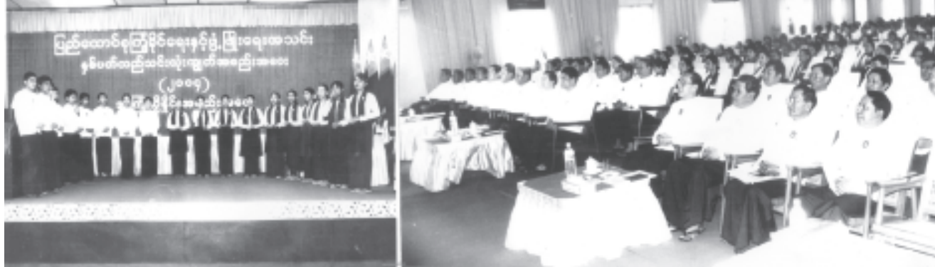
ပြည်ထောင်စုကြံ့ခိုင်ရေးနှင့် ဖွံ့ဖြိုးရေးအသင်း ဗဟိုနာယကအဖွဲ့ဝင် နိုင်ငံတော်ဝန်ကြီးချုပ် ဒုတိယဗိုလ်ချုပ်ကြီးစိုးဝင်း ပြည်ထောင်စုကြံ့ခိုင်ရေးနှင့် ဖွံ့ဖြိုးရေးအသင်း နှစ်ပတ်လည် သင်းလုံးကျွတ်အစည်းအဝေး(၂၀၀၄) အကြံပြုဆွဲဆောင်မှု အစည်းအဝေးသို့ တက်ရောက်စဉ်နှင့် အခြေစိုက်ပညာအထက်တန်းကျောင်းများမှ အသင်းဝင်ကျောင်းသား ကျောင်းသူများက ပြည်ထောင်စုကြံ့ခိုင်ရေးနှင့် ဖွံ့ဖြိုးရေးအသင်းကြီး၏ မူပိုင်ခွင့်အသုံးပြုခွင့်ရရှိရန် 'ပြည်မြန်မာ' နှင့် 'ရာသက်ပန်ပြည်ထောင်စု' စာသီချင်းကို သီဆိုပြီး အစည်းအဝေးကို ဖွင့်လှစ်စဉ်။ (သတင်းစဉ်)

စည်းလုံးရေးဖြစ်အောင် စီမံချက်အရှိန်အဟုန်ဖြင့် ကြိုးပမ်းဆောင်ရွက်နိုင်ခဲ့ကြောင်း။