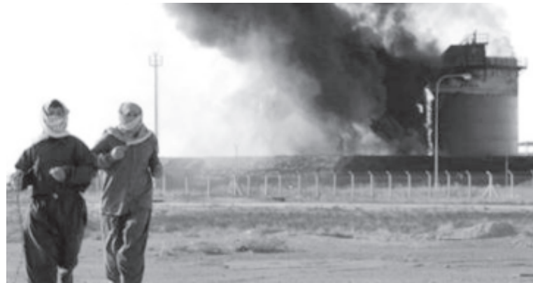
မိုဆူးလီမြို့အနီးတွင် ရေနံသိုလှောင်ရုံတစ်ခု မီးလောင်နေသည်ကို နိုဝင်ဘာ ၁၅ရက်က တွေ့ရစဉ်။

ဒုတိယအသုတ် မရိန်းတပ်ဖွဲ့ဝင်များ စနေနေ့၌ အဆောက်အအုံထဲသို့ ဝင်လာသောအခါ အကျဉ်းသားတစ်ဦး အသက်ရှူနေဆဲရှိသည်ကို မရိန်းတပ်ဖွဲ့ဝင်တစ်ဦးက သတိပြုမိခဲ့ကြောင်း၊ အဆိုပါ မရိန်းတပ်ဖွဲ့ဝင်က သူ၏သေနတ်ဖြင့် ရှိနေမြဲဖြစ်သည်။ အဆိုပါ အဆောက်အအုံသည် အမေရိကန်တပ်များကို ပြောက်ကျားတို့ တိုက်ခိုက်ရာ၌