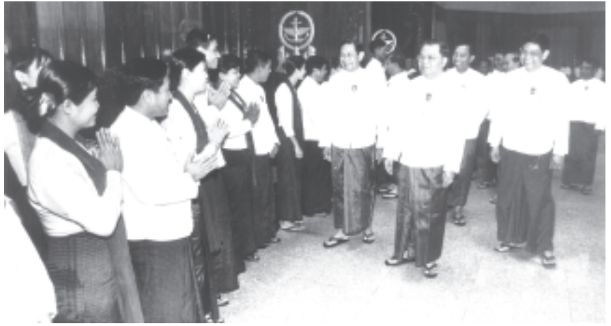
(သတင်းစဉ်)

ပြည်ထောင်စုကြံ့ခိုင်ရေးနှင့် ဖွံ့ဖြိုးရေးအသင်းနာယက နိုင်ငံတော် အေးချမ်းသာယာရေးနှင့် ဖွံ့ဖြိုးရေးကောင်စီဥက္ကဋ္ဌ တပ်မတော် ကာကွယ်ရေး ဦးစီးချုပ် ဗိုလ်ချုပ်မှူးကြီးသန်းရွှေသည် ညနေ ၆ နာရီ ၄၅ မိနစ်တွင် ဂုဏ်ပြုညစာစားပွဲ တည်ခင်းစဉ်ခံရာသို့ရောက်ရှိလာရာ အသင့်ကြိုဆိုကြသော ပြည်ထောင်စု ကြံ့ခိုင်ရေးနှင့် ဖွံ့ဖြိုးရေးအသင်း နှစ်ပတ်လည်သင်းလုံးကျွတ်အစည်းအဝေး (၂၀၀၄)သို့တက်ရောက်ခဲ့ကြသည့် ပြည်နယ်နှင့်တိုင်း ပြည်ထောင်စုကြံ့ခိုင်ရေးနှင့် ဖွံ့ဖြိုးရေးအသင်း အတွင်းရေးမှူးများ၊ ပြည်ထောင်စုကြံ့ခိုင်ရေးနှင့် ဖွံ့ဖြိုးရေး အသင်းဌာနချုပ်ရုံးမှ ဒေသညွှန်ကြားရေးမှူးများ၊ ပြည်နယ်၊တိုင်း၊ခရိုင်နှင့် မြို့နယ်