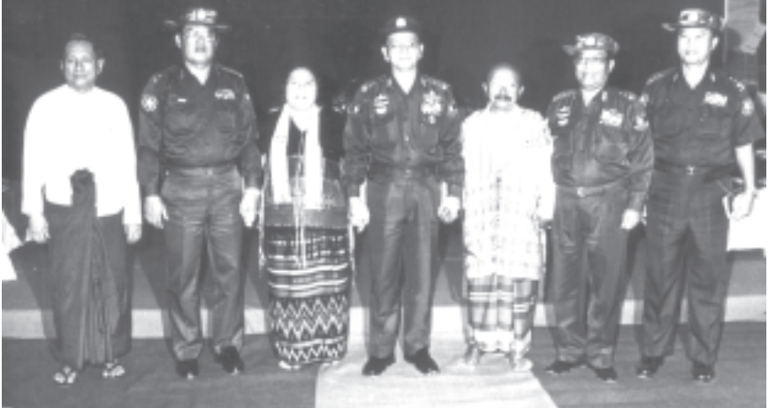
နိုင်ငံတော်အေးချမ်းသာယာရေးနှင့် ဖွံ့ဖြိုးရေးကောင်စီ အတွင်းရေးမှူး(၁) ဒုတိယဗိုလ်ချုပ်ကြီးသိန်းစိန် ကရင်ပြည်နယ် ဘားအံမြို့နယ် ဘုရားကုန်းကျေးရွာ ဘုရားကုန်းဒေသ ငြိမ်းချမ်းရေးအဖွဲ့အစည်းအောင် ဖခင်အောင်ဆန်းနှင့် အဖွဲ့ဝင်များအား တွေ့ဆုံပွဲအပြီးတွင် အဖွဲ့အစည်းအောင် ဖခင်အောင်ဆန်း မိသားစုနှင့် အမှတ်တရဓာတ်ပုံရိုက်ကြသည်။