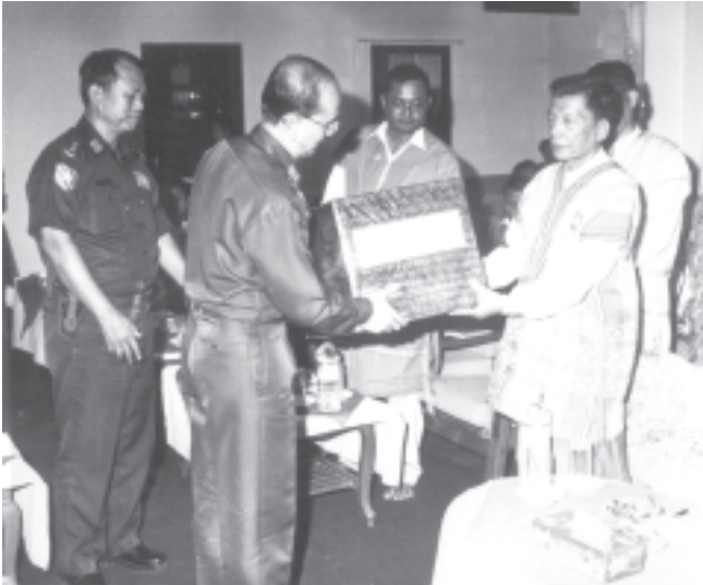
နိုင်ငံတော်အေးချမ်းသာယာရေးနှင့် ဖွံ့ဖြိုးရေးကောင်စီ အတွင်းရေးမှူး(၁) ဒုတိယဗိုလ်ချုပ်ကြီးသိန်းစိန် ကရင်ပြည်နယ် လွိုင်ဘွဲ့မြို့နယ် မြိုင်ကြီးငူအထူးဒေသမှ တိုးတက်သောဗုဒ္ဓဘာသာ ကရင်အမျိုးသားအစည်းအရုံး (ဒီကောဘီအေ)အဖွဲ့ဥက္ကဋ္ဌ ဦးသာထူးကျော်စောင်းဆောင်သောအဖွဲ့အတွက် လက်ဆောင်ပစ္စည်းများ ပေးအပ်စဉ်။ (သတင်းစဉ်)

ကျော့မှန် ဆက်လက်၍ အတွင်းရေးမှူး(၁) နှင့်အဖွဲ့ဝင်များသည် ဂန္ဓကုဋ်တိုက် စံကျောင်းတော်၌ မြိုင်ကြီးငူဆရာတော် ဘဒ္ဒန္တသုဓနအား ဖူးမြော်ကြည့်သည့်ပြီး ပရိက္ခရာရှစ်ပါးနှင့် လှူဖွယ်ပစ္စည်းများ ဆက်ကပ်လှူဒါန်းသည်။ ထို့နောက် အတွင်းရေးမှူး(၁) နှင့်အဖွဲ့ဝင်များသည် မြိုင်ကြီးငူအထူးဒေသ စည်ပင်သာယာမှု တိုးတက်သော ဗုဒ္ဓဘာသာ ကရင်အမျိုးသားအစည်းအရုံး (ဒီကောဘီအေ)အဖွဲ့ဥက္ကဋ္ဌနှင့် အဖွဲ့ဝင်များအား တွေ့ဆုံသည်။ အမျိုးသားရေးမူဝါဒ ယင်းနောက် နိုင်ငံတော် အေးချမ်းသာယာရေးနှင့် ဖွံ့ဖြိုးရေးကောင်စီ အတွင်းရေးမှူး(၁) ဒုတိယဗိုလ်ချုပ်ကြီးသိန်းစိန်က နိုင်ငံတော်၌