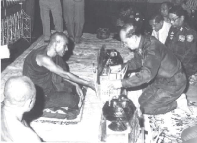
နိုင်ငံတော်အေးချမ်းသာယာရေးနှင့် ဖွံ့ဖြိုးရေးကောင်စီ အတွင်းရေးမှူး(၁) ဒုတိယဗိုလ်ချုပ်ကြီးသိန်းစိန် ကရင်ပြည်နယ် လွိုင်လှိုင်မြို့နယ် ဖွံ့ဖြိုးရေးအဖွဲ့အစည်းမှ ဆရာတော်ဘွဲ့ရ သုတေသန အဖွဲ့ဝင်များနှင့် အတူတူပူးပေါင်းဆောင်ရွက်နေကြသည်။

အခမ်းအနားအပြီးတွင် အတွင်းရေးမှူး(၁) ဒုတိယဗိုလ်ချုပ်ကြီးသိန်းစိန်သည် ဒီကော့အေအဖွဲ့၊ ဥက္ကဋ္ဌနှင့် အဖွဲ့ဝင်များ၊ ဒေသခံတိုင်းရင်းသား ပြည်သူများအား ရင်းနှီးမြှုပ်နှံမှု တစ်ဆက်တည်း ဆက်လက်သည်။ ယင်းမှတစ်ဆင့် အတွင်းရေးမှူး(၁)နှင့် အဖွဲ့ဝင်များသည် ကရင်ပြည်နယ် ဘားအံမြို့နယ် ဘုရားကုန်းကျေးရွာရှိ ငြိမ်းချမ်းရေးအဖွဲ့အစည်းသို့ ရောက်ရှိကြရာ ဘုရားကုန်းဒေသ ငြိမ်းချမ်းရေးအဖွဲ့အစည်း၏ ဖခင်အောင်အောင်ဆန်းနှင့် အဖွဲ့ဝင်များ၊ ဒေသခံတိုင်းရင်းသား ပြည်သူများက ကြိုဆိုကြသည်။ ရေဦးရွာ နိုင်ငံတော် အေးချမ်းသာယာရေးနှင့် ဖွံ့ဖြိုးရေးကောင်စီ အတွင်းရေးမှူး(၁) ဒုတိယဗိုလ်ချုပ်ကြီးသိန်းစိန်သည် အဝတ်အထည်၊ စားသောက်ဖွယ်ရာနှင့် လက်ဆောင်ပစ္စည်းများကို ဘုရားကုန်းဒေသ ငြိမ်းချမ်းရေးအဖွဲ့အစည်းအောင် ဖခင်အောင်ဆန်းအား ပေးအပ်သည်။