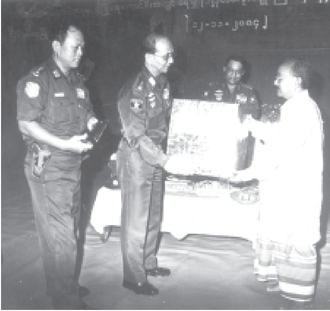
နိုင်ငံတော်အေးချမ်းသာယာရေးနှင့် ဖွံ့ဖြိုးရေးကောင်စီ အတွင်းရေးမှူး(၁) ဒုတိယဗိုလ်ချုပ်ကြီးသိန်းစိန် ကရင်ပြည်နယ် ဘားအံမြို့နယ် ဘုရားကုန်းကျေးရွာ ဘုရားကုန်းဒေသ ငြိမ်းချမ်းရေးအဖွဲ့အစည်းအောင် ဖခင်အောင်ဆန်းအား လက်ဆောင်ပစ္စည်းများပေးအပ်သည်။

အခမ်းအနားအပြီးတွင် အတွင်းရေးမှူး(၁) ဒုတိယဗိုလ်ချုပ်ကြီးသိန်းစိန်သည် ဒီကော့အေအဖွဲ့၊ ဥက္ကဋ္ဌနှင့် အဖွဲ့ဝင်များ၊ ဒေသခံတိုင်းရင်းသား ပြည်သူများအား ရင်းနှီးမြှုပ်နှံမှု တစ်ဆက်တည်း ဆက်လက်သည်။ ယင်းမှတစ်ဆင့် အတွင်းရေးမှူး(၁)နှင့် အဖွဲ့ဝင်များသည် ကရင်ပြည်နယ် ဘားအံမြို့နယ် ဘုရားကုန်းကျေးရွာရှိ ငြိမ်းချမ်းရေးအဖွဲ့အစည်းသို့ ရောက်ရှိကြရာ ဘုရားကုန်းဒေသ ငြိမ်းချမ်းရေးအဖွဲ့အစည်း၏ ဖခင်အောင်အောင်ဆန်းနှင့် အဖွဲ့ဝင်များ၊ ဒေသခံတိုင်းရင်းသား ပြည်သူများက ကြိုဆိုကြသည်။ ရေဦးရွာ နိုင်ငံတော် အေးချမ်းသာယာရေးနှင့် ဖွံ့ဖြိုးရေးကောင်စီ အတွင်းရေးမှူး(၁) ဒုတိယဗိုလ်ချုပ်ကြီးသိန်းစိန်သည် အဝတ်အထည်၊ စားသောက်ဖွယ်ရာနှင့် လက်ဆောင်ပစ္စည်းများကို ဘုရားကုန်းဒေသ ငြိမ်းချမ်းရေးအဖွဲ့အစည်းအောင် ဖခင်အောင်ဆန်းအား ပေးအပ်သည်။