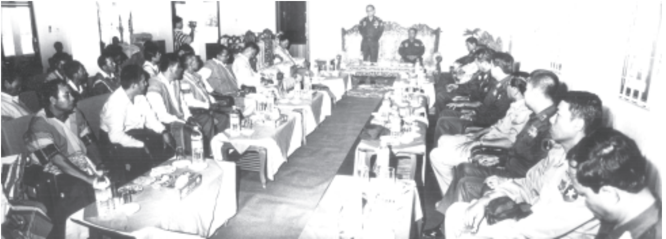
နိုင်ငံတော်အေးချမ်းသာယာရေးနှင့်ဖွံ့ဖြိုးရေးကောင်စီ အတွင်းရေးမှူး(၁) ဒုတိယဗိုလ်ချုပ်ကြီးသိန်းစိန် ကရင်ပြည်နယ် လှိုင်းဘွဲ့မြို့နယ် မြိုင်ကြီးငူအထူးဒေသမှ တိုးတက်သောပုဒ္ဓဘာသာ ကရင်အမျိုးသား အစည်းအရုံး(ဒီကောဘီအေ)အဖွဲ့ဥက္ကဋ္ဌ ဦးသာထူးကျော်ခေါင်းဆောင်သောအဖွဲ့အားတွေ့ဆုံ၍ ဒေသဖွံ့ဖြိုးရေးဆိုင်ရာများ ဆွေးနွေးမှာကြားစဉ်။ (သတင်းစဉ်)

နိုင်ငံတော်ရှေ့ဆက်သွားမည့် မူဝါဒလမ်းစဉ်(၇)ရပ်၏ ပထမ အဆင့်လည်းဖြစ်ပြီး အရေးအကြီးဆုံးလည်းဖြစ်သည့် အမျိုးသား ညီလာခံကြီးကို ဥပဒေဘောင်အတွင်း ရောက်ရှိနေကြသော တိုင်းရင်းသားအဖွဲ့အစည်းများမှ ကိုယ်စားလှယ်များပါဝင်ပြီး ကျင်းပလျက်ရှိရာ အမျိုးသားညီလာခံကြီး အောင်မြင်ပြီးမြောက် သည့်အထိ အရှိန်အဟုန်ဖြင့် ဆက်လက်ကျင်းပသွားမည်။