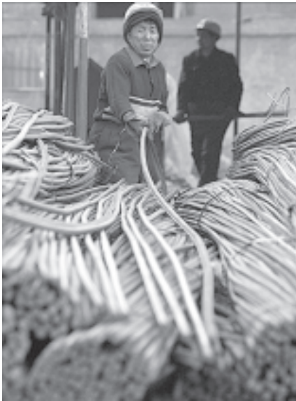
တရုတ်နိုင်ငံ ဗဟကင်းမြို့ရှိ သံမဏိကြီးများ ရောင်းချသည့် ဆိုင်တစ်ဆိုင်ကို နိုဝင်ဘာ ၁၀ရက်က တွေ့ရစဉ်။