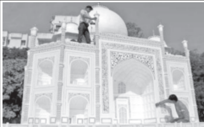
အိန္ဒိယနိုင်ငံ အစောက်ပိုင်း ဂျကာတာမြို့နယ်ရှိ ဖြိုစောက် အိမ်အိမ်ကြီးတွင် အိန္ဒိယနိုင်ငံ၏ ထင်ရှားသော အဆောက်အအုံတစ်ခု ဖြစ်သည့် ကာချီမဟာအဆောက် အအုံ၏ပုံတူကို အနုပညာရှင်များ အချောကိုင် ဆောင်ရွက်လျက် ရှိစဉ်။