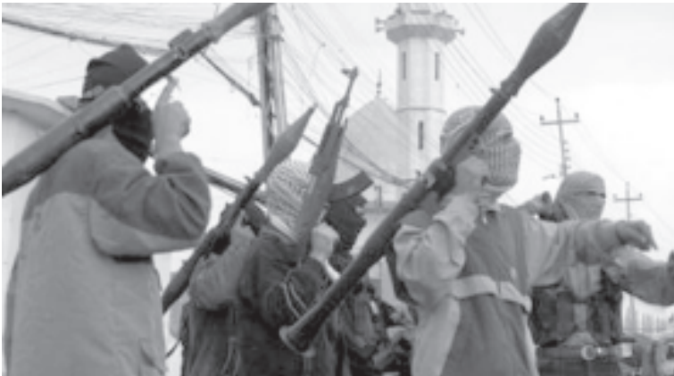
မိုးဆူးလီမြို့တွင် အမေရိကန်စစ်ယာဉ်နှစ်စီးအား ပစ်ခတ်တိုက်ခိုက်ခဲ့သည့် အီရတ်မြောက်ကျားများကို နိုဝင်ဘာ ၁၀ ရက်က တွေ့ရစဉ်။