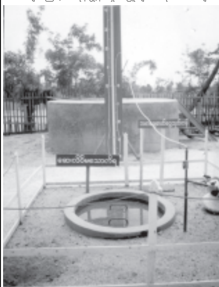
စီမံခန့်ခွဲရေးထုတ်လုပ်ရန်နှင့် ပစ္စည်းပေးကမ်းများ ရွန်ပယ်ကန်။

ပြည်ခရိုင် သဲကုန်းမြို့နယ်သည် ၂၀၀၄-၂၀၀၅ခုနှစ်မှ ၂၀၀၈-၂၀၀၉ခုနှစ်အထိငါးနှစ် အကောင်အထည်ဖော် ဆောင်ရွက်လျက်ရှိသည့် ပဲခူးရိုးမ စိမ်းလန်းစိုပြည်ရေးလုပ်ငန်း စရိယာတွင် ပါဝင်သည်။ ယခုအခါ ပဲခူးရိုးမနှင့် ဆက်စပ်လျက်ရှိသော ရှားပြင်ကြိုးပိုင်း စိမ်းလန်းစိုပြည်ရေးလုပ်ငန်းများကို အကောင်အထည်ဖော် ဆောင်ရွက်လျက်ရှိသဖြင့် သဲကုန်းမြို့နယ်ရှိ သဲဖြူချောင်း၊ သိုက်တောမချောင်းနှင့် သဲကုန်းချောင်းများအတွင်း ရေစီးရေလာကောင်းမွန်လာပြီး ဖြစ်သည်။ ချောင်းကော၍ မိုးရာသီတွင် ချောင်းကျိုးသဖြင့် ပတ်ဝန်းကျင်ရှိလယ်များအတွင်း သဲပျံ့ခြင်းကို ကာကွယ်နိုင်မည် ဖြစ်ကြောင်း ရေးသားလျက်ရှိသည်။