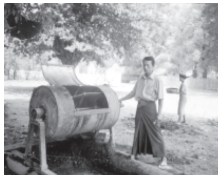
စီမံခန့်ခွဲရေး ဦးစီးဌာနမှ ကိုယ်စားလှယ် တွေ့ရစဉ်။

သဲကုန်းမြို့နယ်ရှိ သဲကုန်းကြီးချောင်းသည် ရှားပြင်ကြိုးပိုင်းမှ ချောင်းများခံကာ ၁၆မိုင်ရှည်လျားပြီး ချောင်းအတွင်း စီးဝင်၍ ယင်းမှတစ်ဆင့် အင်းမ အင်းအတွင်းသို့ စီးဝင်သည်။ ၁၉၄၈ ခုနှစ် မတိုင်မီက သဲကုန်းကြီးရွာအနီးမှ ဖြတ်သန်းသွားခဲ့သော်လည်း ယခုအခါ တောင်ဘက်ရှိ ရွာတောင်ကုန်းရွာ အနီးမှ မြောင်းလဲ၍ ဖြတ်သန်းစီးဆင်းခဲ့သည်။ သဲကုန်းကြီးချောင်းသည် ၁၉၆၀ပြည့်နှစ်တွင် ချောင်းကျိုး၍ တောင်သူစုစုတို့၏ လယ်မြေဧက ၂၅၀ နှင့် ၂၀၀၃-၂၀၀၄ ခုနှစ်တွင် တောင်သူ ၂၅၀၏ လယ်မြေ ၅၅၈၈ တို့အား သုံးလွှမ်းခဲ့သည်။ ထိုလယ်မြေများတွင် အင်းမရေတော်၊ မှော်ဘီ(၂)နှင့် မနောသုခ စပါး မျိုးများ စိုက်ပျိုးကြသည်။ သဲမုံးလွှမ်းမီက တစ်ဧကလျှင် စပါး ၆၅တင်း မှ တင်း ၇၀ ထိ ထွက်ရှိခဲ့သော်လည်း သုံးလွှမ်းပြီးနောက်တွင် တစ်ဧက စပါး ၃၀မှ ၃၅တင်းအထိသာ ထွက်ရှိတော့သည်။ သဲကုန်းကြီး