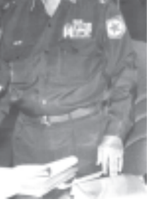
အမျိုးသားရေးစိတ်ဓာတ်၊ မျိုးချစ်စိတ်ဓာတ် ထက်သန်နိုင်စွမ်းအားဖြင့် စည်းစည်းလုံးလုံး ညီညီညွတ်ညွတ် လက်တွဲတွန်းလှန်ခဲ့ကြသည့် မြန်မာလွတ်လပ်ရေး ကြိုးပမ်းမှုအစဉ်အလာ ကောင်းများကို ပြန်လည်ဖော်ထုတ်ပေးကြရန် လိုအပ်နေပြီဖြစ်ကြောင်း။

ထို့ကြောင့် ကိုလိုနီနယ်ချဲ့၏ အန္တရာယ်ရှိစွမ်းကို ပြည်သူများ