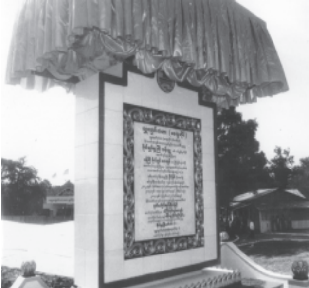
မကွေးတိုင်း သရက်ခရိုင် မင်းလှမြို့နယ်တွင်တည်ဆောက်ဖွင့်လှစ်ခဲ့သည့် ရွှေချောင်းတံတား ကမ္ဘာ့စံနှုန်းကျောက်စာတိုင်ကို ဤသို့တွေ့ရသည်။