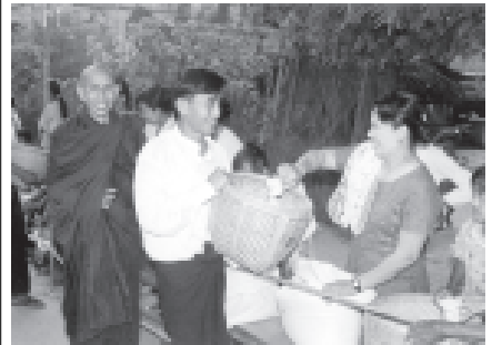
စဉ့်ကု မြို့လုံးဆိုင်ရာ အကြိမ်(၃၀)မြောက် ဆွမ်းဆန်လောင်းလှူပွဲကို အောက်တိုဘာ ၂၈ ရက် (သီတင်းကျွတ်လပြည့်နေ့) မွန်းလွဲ ၂ နာရီက ချောက်-ညောင်ဦး ကားလမ်းပေါ် စဉ့်ကုစာတိုက်အနီး လမ်းတစ်လျှောက်၌ ကျင်းပရာ အလှူရှင်များက ဆွမ်းဆန်စိမ်းများနှင့် လှူဖွယ်ဝတ္ထုပစ္စည်းများ၊ စာရေးတ်ခဲများ ဆက်ကပ်လောင်းလှူစဉ်။ (၀၄၆)

ဆက်လက်၍ ပြည်ထောင်စုကြံ့ခိုင်ရေးနှင့် ဖွံ့ဖြိုးရေးအသင်း ဗဟို အလုပ်အမှုဆောင်ဝန်ကြီး ဗိုလ်မှူးချုပ်မောင်မောင်သိမ်းက နိုင်ငံတော်၏ လက်ရှိ ဖြစ်ပေါ်နေမှု အခြေအနေများကို ရှင်းလင်းဆွေးနွေးသည်။ ယင်းနောက် တွေ့ဆုံပွဲသို့ တက်ရောက်လာကြသည့် အသင်းဝင် များက အသင်းကြီး၏ ဆောင်ရွက်ချက်များကိုတင်ပြကြကြောင်း သတင်း ရရှိသည်။ (သတင်းစဉ်)