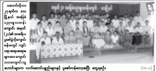
အောက်တိုဘာ ၂၇ ရက်က ဒလ မြို့နယ် အခြေခံ ပညာမူလတန်း ကျောင်း အမှတ် (၂)၏ အစရှိယ ပူဇော်ပွဲကျောင်း ခန်းမတွင် ကျင်း ပရာ ဆရာဆရာမ များအား ကျောင်း သားကျောင်းသူ ဟောင်းများက လက်ဆောင်ပစ္စည်းများနှင့် ပူဇော်ကန်တော့အပြီး တွေ့ရစဉ်။ (က-ပ)