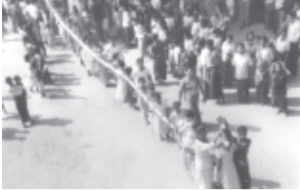
မြို့ပေါ် ရပ်ကွက်အသီးသီးနှင့် အနီးပတ်ဝန်းကျင်ရှိ ကျေးရွာများမှ ကုသိုလ်လှည့်လည် ပူဇော်ကြသည်။ (အပေါ်ပုံ) (၀၆၁)

ကျောက်ပန်းတောင်းမြို့ ပြည်တော် သာရပ်ကွက်ရှိ ဥသျှစ်ကုန်းစာသင်တိုက် ကျောင်းအတွင်းရှိ ရှေးဟောင်းစေတီတော် ဗုဒ္ဓပူဇော်ယဉ်ကျေးပွဲတော်ကို အောက်တိုဘာ ၂၉ရက် (သုဗ္ဗိဒ္ဓန္တ) နေ့စဉ် သီတင်းကျွတ်လပြည့်ကျော် ၈ရက်)က စာသင်တိုက်အတွင်း၌ ကျင်းပသည်။