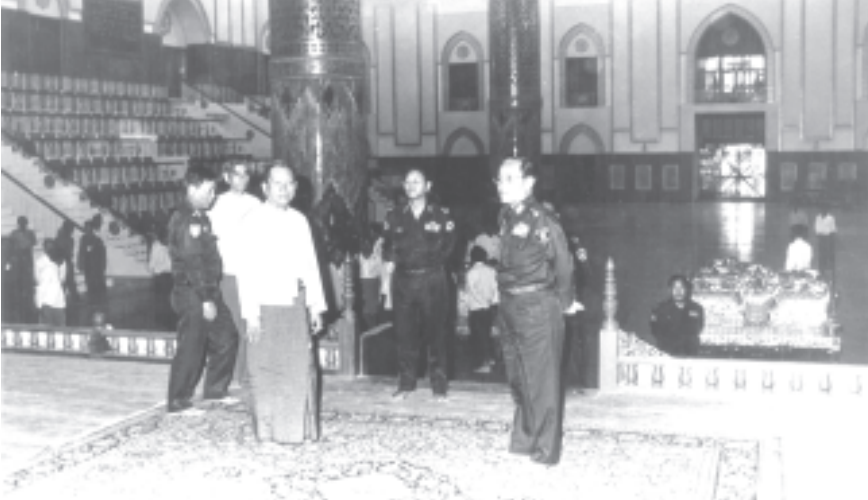
စတုတ္ထအကြိမ် ကမ္ဘာ့ဗုဒ္ဓဘာသာသီတင်းသုံးညီလာခံကျင်းပရေး ဦးစီးကော်မတီဥက္ကဋ္ဌ နိုင်ငံတော်ဝန်ကြီးချုပ် ဒုတိယဗိုလ်ချုပ်ကြီးစိုးဝင်း သီရိမင်္ဂလာကမ္ဘာအေးကုန်းမြေရှိ မဟာပါသာဏလိုဏ်ဂူသိမ်တော်ကြီးတွင် စတုတ္ထအကြိမ် ကမ္ဘာ့ဗုဒ္ဓဘာသာသီတင်းသုံးညီလာခံကျင်းပရန် ပြုပြင်မွမ်းမံထားမှုကို ကြည့်ရှုစစ်ဆေးစဉ်။

ကျန်းမာရေးဌာနခွဲသစ် ဖွင့်လှစ်ပွဲသို့ တက်ရောက်ချီးမြှင့်သည်။ ဖွင့်ပွဲတွင် ပြည်နယ် ပြည်ထောင်စုကြံ့ခိုင်ရေးနှင့် ဖွံ့ဖြိုးရေးအသင်း အတွင်းရေးမှူး ဒေါက်တာခိုင်ဆေးကော်နှင့် ပြည်နယ်စည်ပင်သာယာရေးဦးစီးဌာနညွှန်ကြားရေးမှူး ဦးတင်စိုးတို့က ကျေးလက်ကျန်းမာရေးဌာနခွဲကို မဲကြိုးဖြတ် ဖွင့်လှစ်ပေးကြပြီးနောက် ကြိတ်ဒေသတိုင်း