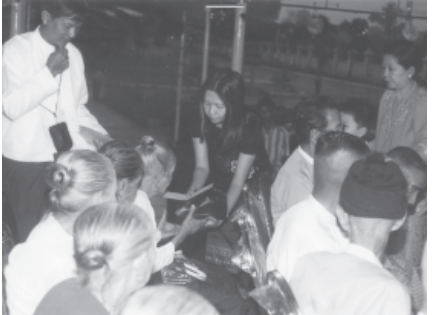
အလှူငွေနှင့် လူပုဂ္ဂိုလ်များလေးစား

ရန်ကုန် နိုဝင်ဘာ ၆ ရန်ကုန်တိုင်း လမ်းမတော်မြို့နယ် သရက်တောကျောင်းတိုက် အောင်ကြွတ်တိုက်ကျောင်း ဦးစီးပမာန နာယက မွေကထိက ဗဟုဇန ဟိတရေ ဘဒ္ဒန္တ စန္ဒသူရိယ အောင်ကြွတ်ဆရာတော်သည် နိုဝင်ဘာ ၁၃ နှင့် ၁၄ ရက် ညများတွင် သာဓကတမြို့နယ် (၃)ရပ်ကွက် ရန်ခြေလမ်း (မာသမ္မာရုံတွင်လည်းကောင်း၊ ၁၆ရက်ညတွင် ဗဟန်းမြို့နယ် ဆရာတော်မြောက်/အနောက်ရပ်ကွက်အနောက်ဟိုလမ်းတွင်လည်းကောင်း၊ ၁၇ရက်ညများတွင် ပုသိမ်မြို့ မဟာဗောဓိရပ်ကွက် မဟာဗောဓိဓဇာတိတောင်တွင်လည်းကောင်း၊ ၁၉ရက်ညတွင် လွိုင်မြို့နယ် အောင်သစ္စာလမ်းတွင်လည်းကောင်း၊ ၂၀ရက်ညတွင် သာဓကတမြို့နယ်(၁)ရပ်ကွက် အနောက် ၁၇လမ်း အရှေ့တွင်လည်းကောင်း၊ ၂၁ရက်ညတွင် သာဓကတမြို့နယ် (၈)ရပ်ကွက် ရွှေအုတ်ပူဘုရားလမ်း သဒ္ဓမ္မဓပလ္လဓမ္မရုံတွင်လည်းကောင်း နိဗ္ဗာန်ရောက်ကြောင်းတရားတော်များဟောကြားတော်မူမည်ဟုသိရသည်။ (က-ပ)