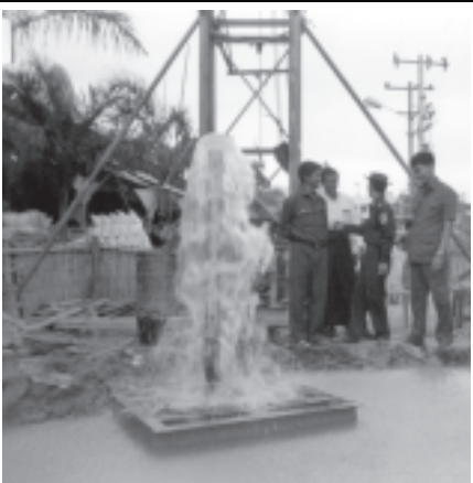
ကျေးလက်ဒေသသောက်သုံးရေရရှိရေးအတွက် ဆာယာရေပုံပန်အသုံးပြု၍ တူးဖော်နေသည့် စည်ပင်သာယာရေးအဖွဲ့၏ ကြိုးပမ်းမှုကို ဤသို့တွေ့ရသည်။

၅၀ ဖြင့် ကျောက်လမ်းမ ၃၆၀၀အား လည်းကောင်း၊ ထောက်ပံ့နေကျပ် ၂၆၄ သိန်းဖြင့် စန္ဒရီ - ကံတုတ် - ရေနံမ ကျောက်ခင်းခြင်းလုပ်ငန်းများကိုလည်းကောင်း ဆောင်ရွက်သွားမည်ဖြစ်သည်။ နိုင်ငံတော်၏ ကျေးလက်ဒေသဖွံ့ဖြိုးရေးလုပ်ငန်းကြီး (၅)ရပ်တွင် ပါဝင်သော ကျေးလက်ဒေသ ရေရရှိရေး ဆောင်ရွက်ရာတွင် ၁၉၉၉-၂၀၀၀ ခုနှစ်မှစ၍ နှစ်စဉ် တိုးမြှင့်ဆောင်ရွက် ခဲ့သဖြင့် ကန်တုတ်၊ ဒီးတုတ်ကန်၊ ကျောက်ပုံ၊ စစ်သုဇယ်၊ ကွေ့ကျော၊ ကန်ကျော၊ ခါးစေတီ၊ သံပရာကန်၊ ပန်းတော်ပြင်၊ မယ်ဇေလီ