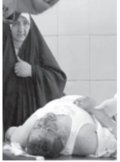
ဘဂ္ဂဒတ်မြို့အနောက်ဘက်တွင် ကားပွဲပေါက်ကွဲမှု ဖြစ်ပွားပြီးနောက် ဒဏ်ရာရရှိခဲ့သော အီရတ်တစ်ဦး ဆေးရုံ၌ ဆေးကုသမှုခံယူနေသည်ကို နိုင်ငံဘာ ၄ ရက်က တွေ့ရစဉ်။

ဘဂ္ဂဒတ် နိုင်ငံတကာဆိုင်ရာ လေဆိပ်သို့ သွားရာလမ်းပေါ်တွင်ရှိသော စစ်ဆေးရေးစခန်း၌ ကားများအတွင်း စောင့်ဆိုင်းနေသော လူကိုးဦးထက်မနည်းမှာ ကားပွဲတစ်ခု ပေါက်ကွဲမှုကြောင့် ဒဏ်ရာများရရှိခဲ့ကြောင်း ဆေးဘက်ဆိုင်ရာက ပြောကြားသည်။