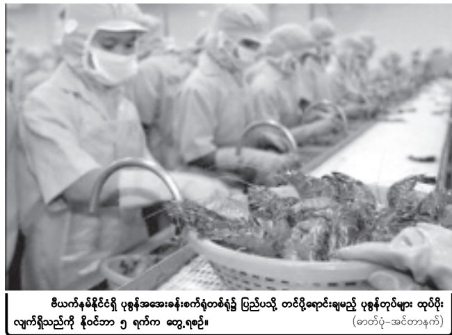
ဗီယက်နမ်နိုင်ငံရှိ ပုဂ္ဂိုလ်အများစုစားသုံးနေသည့် ပြည်ပသို့ တင်ပို့ရောင်းချမည့် ပုဂ္ဂိုလ်များ ထုပ်ပိုး လျက်ရှိသည်ကို နိုဝင်ဘာ ၅ ရက်က တွေ့ရစဉ်။