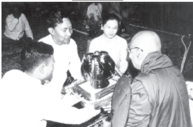
နိုင်ငံတော် အေးချမ်းသာယာရေးနှင့်ဖွံ့ဖြိုးရေးကောင်စီဝင် ဗိုလ်ချုပ်ကြီးသူရရွှေမန်းနှင့်ဇနီး ဒေါ်ခင်လေးသက်တို့က ဆရာတော်အား ပရိက္ခရာရှစ်ပါးအစရှိသော လူမှုပစ္စည်းများ ဆက်ကပ်လှူဒါန်းစဉ်။ (သတင်းစဉ်)

ကာကွယ်ရေးဝန်ကြီးဌာန (၇၁) ကြိမ်မြောက် မိမိစာတိုက်အဖွဲ့ အား အနားတွင် ဒုတိယဗိုလ်ချုပ်ကြီးတင်ဦး ဇနီး ဒေါ်သန်းနွဲ့က ဆရာတော်အား ပရိက္ခရာရှစ်ပါးအစရှိသော လူမှုပစ္စည်းများ ဆက်ကပ်လှူဒါန်းစဉ်။ (သတင်းစဉ်)