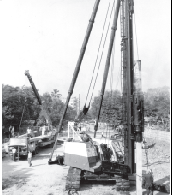
နာနတ်တော ခုံးကျော်တံတားပိုင်တိုင်ကို ဤသို့တွေ့ရသည်။

နာ နတ် တော ခုံး ကျော်တံတား ကို စတင် ဆောင် ရွက် လျက် ရှိ ရာ လူ အင်အား၊ စက် ယန္တရား များ ဖြင့် ပိုင် တိုင် များ သယ် ဆောင် ခြင်း၊ ပိုင် တိုင် ရိုက် သွင်း ခြင်း လုပ် ငန်း များ ဆောင် ရွက် နေစဉ်။