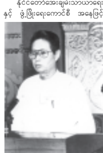
ဒါသမအကြိမ်(၁၂ကြိမ်) မြန်မာ့ရိုးရာယဉ်ကျေးမှု အဆို၊ အက၊ အရေး၊ အတီးပြိုင်ပွဲတွင် ပါဝင်ကူညီခဲ့ကြသော ပညာရှင် ကြီးများနှင့် အကဖြတ်ပညာရှင် များအား ဂုဏ်ပြုအမှာစကား ပြောကြားစဉ်။

ဤခံယူချက်နှင့်အညီ နိုင်ငံတော် အစိုးရ အနေဖြင့် မြန်မာ့ရိုးရာ ယဉ်ကျေးမှု အဆို၊ အက၊ အရေး၊ အတီး ပြိုင်ပွဲကြီးများ ပြီးစီးသည့်အခါ တိုင်းတွင် ပညာရှင်ဆိုင်ရာအရ ပါဝင် ပံ့ပိုး ထောက်ပံ့ပေးကြသည့် ဝါရင့် သတ္တရောင် ပညာရှင်ကြီးများ၊ အကဖြတ် အဖွဲ့ဝင် အနုပညာရှင်ကြီးများ၏ ကျေးဇူးတရားကို အသိအမှတ်ထား ဂုဏ်ပြုလျက်ရှိသည်မှာ ကောင်းမြတ် သော အစဉ်အလာ တစ်ရပ်အဖြစ် နိုင်ငံတော်အဖွဲ့အစည်းတို့ဖြစ်ကြောင်း။