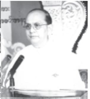
ဒါသမအကြိမ် (၁၂ကြိမ်) မြန်မာ့ရိုးရာ ယဉ်ကျေးမှုအဆိုအကအရမ်းအဖွဲ့အစည်းတို့က ဂုဏ်ပြုအမှာစကား ပြောကြားစဉ်။

အခမ်းအနားသို့ ဒါသမအကြိမ် (၁၂ကြိမ်) မြန်မာ့ရိုးရာယဉ်ကျေးမှု အဆိုအကအရမ်းအဖွဲ့အစည်းတို့က ဂုဏ်ပြုအမှာစကား ပြောကြားစဉ်။