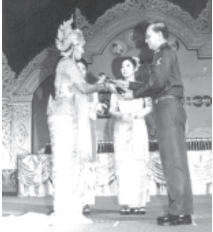
ဒါ့ဒဿမအကြိမ် (၁၂ကြိမ်) မြန်မာရိုးရာယဉ်ကျေးမှု အဆို၊ အက၊ အရေး၊ အတီး ပြိုင်ပွဲကွင်းပရောဇာယကအဖွဲ့ဝင် နိုင်ငံတော်အေးချမ်းသာယာရေးနှင့် ဖွံ့ဖြိုးရေးကောင်စီ အတွင်းရေးမှူး(၁) ဒုတိယဗိုလ်ချုပ်ကြီး သိန်းစိန် ရာမာယဏဓာတ်တော်ကြီးပြိုင်ပွဲတွင် မယ်သီတာထူးရွှန်ဆုရ ရန်ကုန်တိုင်းမှ ခေါ်မြင်ဖြင့်ဝင်(၈)မနိုင်သခင်သီးအား ဆုဖိုးဖြင့်စဉ်။ (သတင်းစဉ်)

ရုပ်သေးသဘင်ပြိုင်ပွဲမှာ ယဉ်ပြိုင်တင်ဆက်ခဲ့တဲ့ မဟော်သဓာဓာတ်တော် ကြီးဟာဆိုင်ရင်လည်း ဗုဒ္ဓမြတ်စွာရဲ့ ပညာပါရမီ ဖြည့်ဆည်းမှုကို ဖော်လျှိုးတဲ့ ဓာတ်တော်ကြီးဖြစ်တဲ့အတွက် မြန်မာလူမျိုးတို့ရဲ့ မှန်ကန်တဲ့ အသိဉာဏ်ပညာ အပေါ် ယုံကြည်အေးထားမှုကို ပေါ်လွင်စေတဲ့ ဓာတ်တော်ကြီးတစ်ခုဖြစ်ပါတယ်။