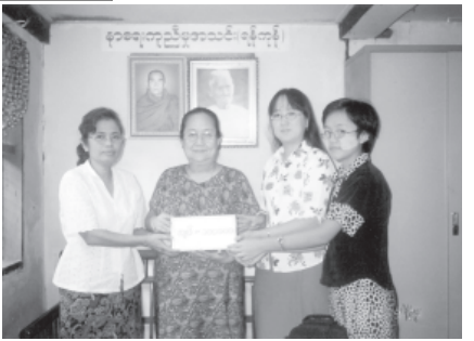
အလှူငွေများကို ကျေးရွာ ၂၈ ရွာမှ ဥက္ကဋ္ဌများက ဆေးအပ်လှူဒါန်းခဲ့ကြောင်း သိရသည်။ (မြို့နယ် ပြန်/ဆက်)

ချောက် အောက်တိုဘာ ၂၉ ချောက်မြို့နယ် စံပြကျေးရွာ ကိုယ်အားကိုယ်ကိုးစာကြည့်တိုက်များအသုံးပြုရန်အတွက် ဌာနဆိုင်ရာများနှင့် အလှူရှင်များလှူဒါန်းသော စာအုပ်လှူဒါန်းပွဲ အခမ်းအနားကို အောက်တိုဘာ ၁၅ ရက်က မြို့နယ်အေးချမ်းသာယာရေးနှင့် ဖွံ့ဖြိုးရေးကောင်စီရုံး အစည်းအဝေးခန်းမတွင် ကျင်းပသည်။ အခမ်းအနားတွင် မြို့နယ်ဥက္ကဋ္ဌ ဦးသီဟ၊ မြို့နယ်အတွင်းရေးမှူး ဦးအေးဟန်တို့က အမှာစကားပြောကြားကြပြီး မြို့နယ်ပြန်ကြားရေးနှင့် ပြည်သူ့ဆက်ဆံရေးဦးစီးဌာန ဦးစီးအရာရှိ ဦးမြင့်သန်းတို့က စာကြည့်တိုက်ရေရှည်တည်တံ့အောင် ထိန်းသိမ်းရေးနည်းလမ်းများ ရှင်းလင်းပြောကြားသည်။ ဆက်လက်၍ စာအုပ်လှူဒါန်းပွဲကျင်းပရာ ဌာနဆိုင်ရာများနှင့် အလှူရှင်များ လှူဒါန်းသော စာအုပ်မျိုးစုံ ၁၄၇၇ အုပ် ကျန်သည့် ဝမ်းစောင်နှင့်