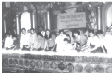
အောက်တိုဘာ၃၀ရက်က Asian Trails Tour Limited မိသားစုက သီတင်းကျွတ်လပြည့်ကျော်၁ရက် ညနေပိုင်းတွင် ရန်ကုန်မြို့၊ ရှေ့တိဂုံဘုရားရင်ပြင်တွင် ဆီမီး၂၇၀၀ ထွန်းသို ပူဇော်စဉ်။

ပြပွဲ-၂၀၀၄ကို ၂၀၀၄ခုနှစ် ဒီဇင်ဘာ ၁ရက်မှ ၅ရက်အထိ ရန်ကုန်မြို့၊ မရမ်းကုန်းမြို့နယ် မင်းမဓမ္မလမ်းရှိ မြန်မာကွန်ဗင်းရှင်းစင်တာ၌ စည်ကား သိုက်မြိုက်စွာ ကျင်းပမည်ဖြစ်ကြောင်း သတင်းရရှိသည်။ (သတင်းစဉ်)