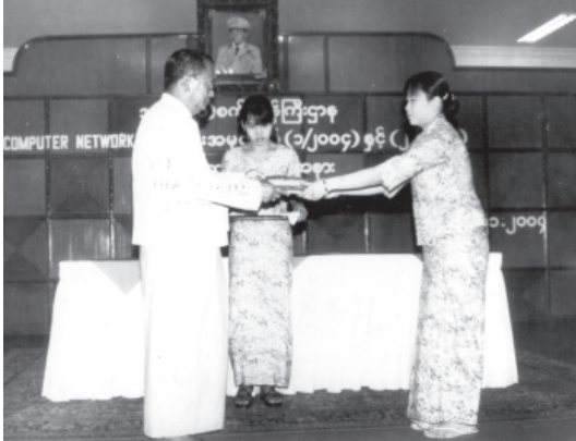
အမှတ်(၁)စက်မှု ဝန်ကြီးဌာန အမှတ်စဉ် (၁/၂၀၀၄) နှင့် (၂/၂၀၀၄) သင်တန်းဆင်းပွဲတွင် သင်တန်းသား ခေါင်းဆောင်သို့ သင်တန်းဆင်း လက်မှတ်များပေးပို့စဉ် (စက်မှု-၁)