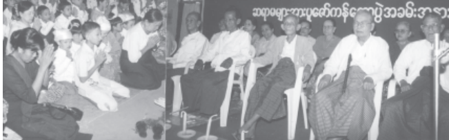
သန့်လျင်မြို့ မြို့ဟောင်း အလက စစ်တက္ကသိုလ်ကြိမ်မြောက် အငြိမ်းစားဆရာကြီး၊ ဆရာမကြီးများအား အာစရိယပူဇော်ပွဲကို အောက်တိုဘာ ၂၆ ရက်က ကျောင်းခန်းမ၌ကျင်းပရာ ကျောင်းသား ကျောင်းသူဟောင်းများနှင့် မျိုးဆက်သစ် ကျောင်းသား ကျောင်းသူများက ပူဇော်ကန်တော့ကြစဉ်။ (ခရိုင် ပြန်/ဆက်)