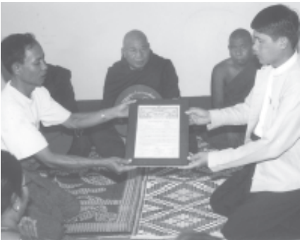
သန့်လျင်မြို့ မြို့ဟောင်း အလက စစ်တက္ကသိုလ်ကြိမ်မြောက် အငြိမ်းစားဆရာကြီး၊ ဆရာမကြီးများအား အာစရိယပူဇော်ပွဲကို အောက်တိုဘာ ၂၆ ရက်က ကျောင်းခန်းမ၌ကျင်းပရာ ကျောင်းသား ကျောင်းသူဟောင်းများနှင့် မျိုးဆက်သစ် ကျောင်းသား ကျောင်းသူများက ပူဇော်ကန်တော့ကြစဉ်။ (ခရိုင် ပြန်/ဆက်)