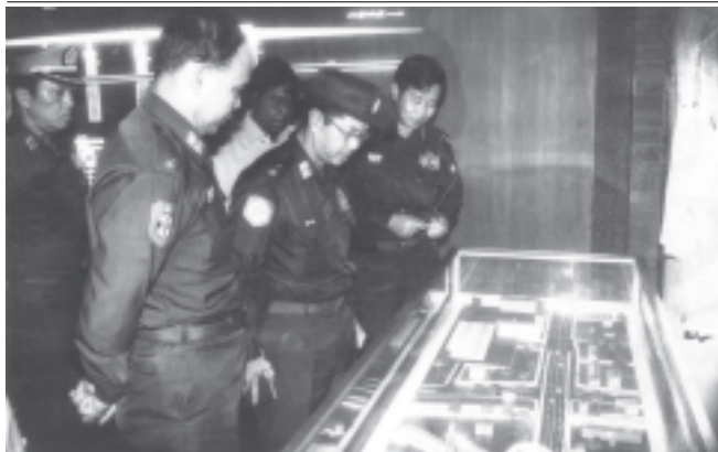
ရန်ကုန်တိုင်းအေးချမ်းသာယာရေးနှင့်ဖွံ့ဖြိုးရေးကောင်စီဥက္ကဋ္ဌ ရန်ကုန်တိုင်းစစ်ဌာနချုပ် တိုင်းမှူး ဗိုလ်ချုပ်မြင့်ဆွေ နာနတ်တော ခုံးကျော်တံတား ပုံစံငယ်ကို ကြည့်ရှုစဉ်။ (ရန်ကုန်တိုင်း)