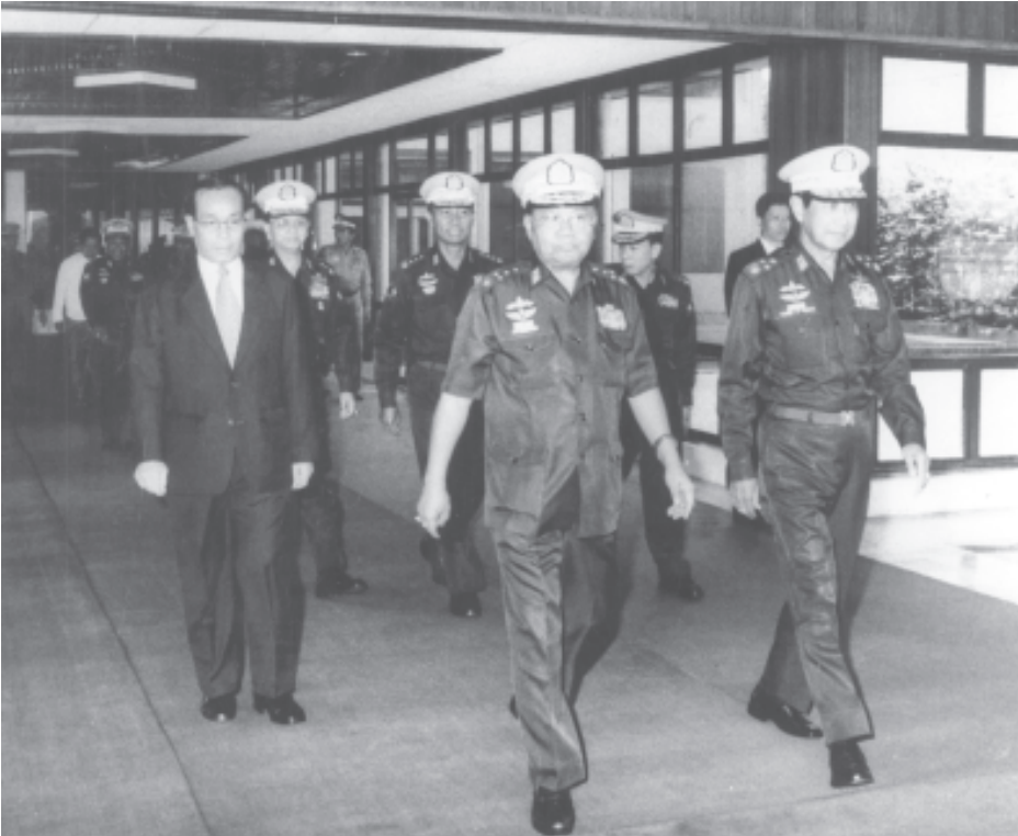
ရန်ကုန် နိုဝင်ဘာ ၂

တရုတ်ပြည်သူ့သမ္မတနိုင်ငံ အစိုးရ၏ ဖိတ်ကြားချက်အရ ပြည်ထောင်စု မြန်မာ နိုင်ငံတော် နိုင်ငံတော်ဝန်ကြီးချုပ် ဒုတိယ ပိုလ်ချုပ်ကြီးစိုးဝင်း ခေါင်းဆောင်သော မြန်မာ ကိုယ်စားလှယ်အဖွဲ့သည် တရုတ်ပြည်သူ့ သမ္မတနိုင်ငံ ကွမ်မင်ကျွမ်းကိုယ်ပိုင်အုပ်ချုပ်ရေး ဒေသ နန်နင်းမြို့တော်၌ကျင်းပမည့် တရုတ်- အာဆီယံစီးပွားရေးနှင့် ရင်းနှီးမြှုပ်နှံမှုဆိုင်ရာ ထိပ်သီးဆွေးနွေးပွဲသို့တက်ရောက်ရန် ယနေ့ စာမျက်နှာ ၃ ကော်လံ ၄ ✽