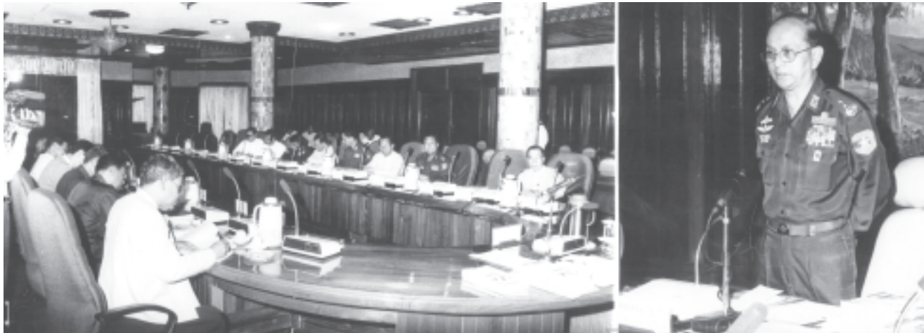
ရန်ကုန် နိုဝင်ဘာ ၂

မြန်မာနိုင်ငံပညာရေးကော်မတီ၏ (၄/၂၀၀၄)ကြိမ်မြောက် အစည်းအဝေးကို ယနေ့ညနေ ၃ နာရီတွင် ရန်ကုန်မြို့ ကုန်းမြင့်သာရှိ ဓမ္မေယျာသီရိမိမိအစည်းအဝေးခန်းမ၌ကျင်းပရာ မြန်မာနိုင်ငံပညာရေးကော်မတီ ဥက္ကဋ္ဌ နိုင်ငံတော်အေးချမ်းသာယာရေးနှင့်ဖွံ့ဖြိုးရေးကောင်စီ အတွင်းရေးမှူး(၁) ဒုတိယဗိုလ်ချုပ်ကြီးသိန်းစိန် တက်ရောက်၍ ဆွေးနွေးမှာကြားသည်။ (အပေါ်ပုံ)