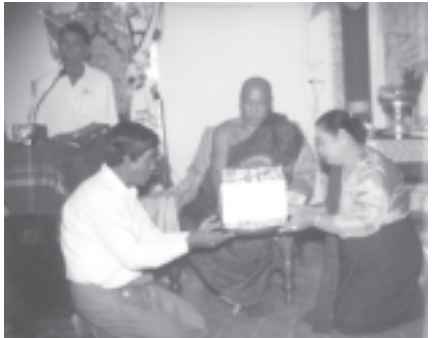
မင်္ဂလာဒုံမြို့နယ် မျဉ်းမပင်စံပြကျေးရွာအုပ်စု မြသီတာရုပ်ကွက်

မြန်မာ့ရိုးရာယဉ်ကျေးမှု အဆို၊ အက၊ အရေး၊ အတီးပြိုင်ပွဲဝင်များ