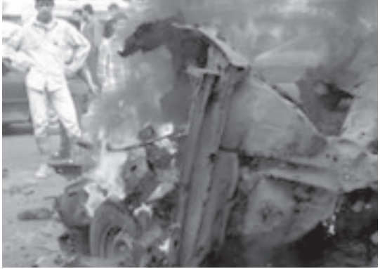
ဗုံးခွဲခံရပြီးနောက် အမေရိကန်စစ်ယာဉ်တစ်စီးအား ကားခွဲတိုက်ခိုက်ပြီးနောက် မီးလောင်နေသော ဘာကူဘာမြို့တစ်စိတ်ကို အောက်တိုဘာ ၃၀ ရက်က တွေ့ရစဉ်

၎င်းတို့သည် အီရတ်ရှိ အမေရိကန်အခြေစိုက်စခန်းရှိလျှင် ထရပ်ကားများဖြင့် သွားရောက်ခဲ့သဖြင့် ၎င်းတို့နှစ်ဦးအား ပြန်လွှတ်ပေးဆွဲခံခြင်းဖြစ်ကြောင်း လက်နက်ကိုင်ခွန်ရေးသမားများက ကြေညာချက်တစ်စောင် ထုတ်ပြန်သည်ဟု အယ်လ်