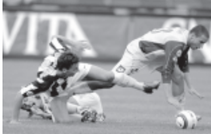
စီးရီးအေပွဲစဉ်(၉)အဖြစ် ဂျပန် ဝတ်က ချီယေးဗိုကိုက အနိုင်ရပြီး ပါးမားနှင့်အတ္တလန္တာတို့ နှစ်ဂိုးစီသရေကျကာ ရိုးမားတို့က ကယ်လီလာရီကို ငါးဂိုး-တစ်ဂိုးဖြင့် အနိုင်ရရှိခဲ့သည်။

လက်စက တစ်ဂိုး၊ ပွဲချိန် ခြောက်မိနစ်၌ တော့ကတစ်ဂိုး၊ ပွဲချိန် ၆၄ မိနစ်တွင် ပါးမားက တစ်ဂိုး၊ ပွဲချိန် ၆၄ မိနစ်တွင် ဂျပန် ဝတ်က ချီယေးဗိုကို သုံးဂိုးပြတ်အနိုင်ရပြီး ပါးမားနှင့်အတ္တလန္တာတို့ နှစ်ဂိုးစီသရေကျကာ ရိုးမားတို့က ကယ်လီလာရီကို ငါးဂိုး-တစ်ဂိုးဖြင့် အနိုင်ရရှိခဲ့သည်။