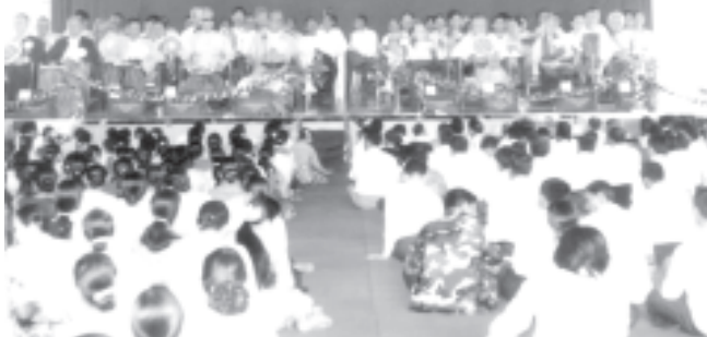
မုတ္တမအထက မြတ်ဆရာပူဇော်ပွဲအခမ်းအနား ကျင်းပ

မုတ္တမအထက အားကစားခန်းမဆောင်၌ကျင်းပရာ အငြိမ်းစားယူသွားကြသည့်