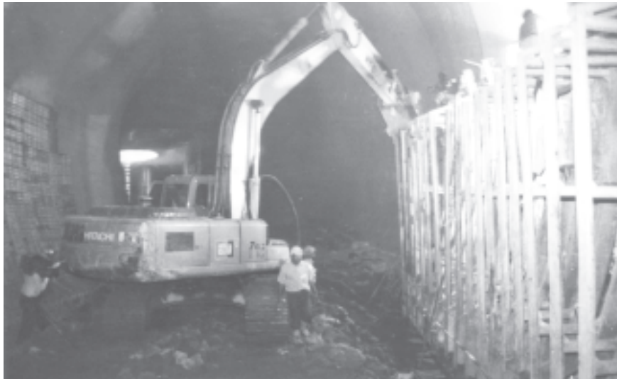
မကြာမီဖွင့်လှစ်တော့မည့် မကွေးတိုင်း စေတုတ္ထရာမြို့နယ်၌ တည်ဆောက်လျက်ရှိသည့် မုန်းချောင်းရေလျှောင့်တစ် ဘက်စုံစီမံကိန်း ရေအားလျှပ်စစ် ဥပဒေလိုက်အတွင်းပိုင်း ပြုပြင်ဆောင်ရွက်မှုကို ဤသို့ တွေ့ရသည်။

ဤအမြင်၊ ဤစေတနာများဖြင့် နိုင်ငံတော်အကြီးအကဲ ဗိုလ်ချုပ်မှူးကြီး သန်းရွှေသည် မုန်း၊ မန်း၊ စလင်းနှင့် ယောချောင်းတို့၏ ရေသယ်စာတမျှကို အသုံးချနိုင်ရန် ရေလျှောင့်တစ်ခု ရေလွှဲဆည်များကို တစ်ခုပြီးတစ်ခု အကောင်အထည်ဖော်ဆောင်ရွက်ခဲ့သည်။ ကိုယ်တိုင်ကိုယ်ကျ စီမံကိန်းရေးရာများကို အပင်ပန်းခံလိုက်လံကြည့်ရှု ရွေးချယ်ပေးရုံသာမက တည်ဆောက်နေဆဲ အချိန်မှာလည်း