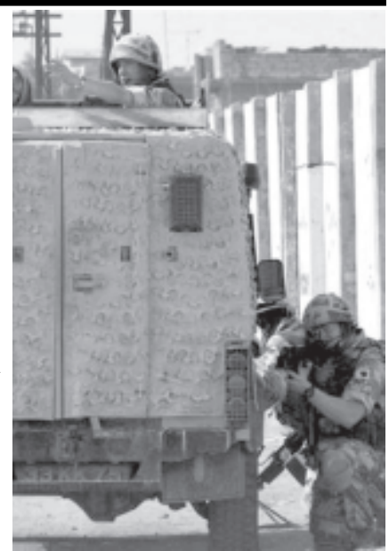
ဘာသာရာဇ်မြို့တွင် အီရတ်လက်နက်ကိုင် တိုက်ခိုက်ရေးသမားများနှင့် အပြန်အလှန်ပစ်ခတ်တိုက်ခိုက်နေသော ဗြိတိသျှတပ်ဖွဲ့ဝင်များကို အောက် တိုဘာ ၂၆ရက်က တွေ့ရစဉ်။

ဘဂ္ဂဒက် အောက်တိုဘာ ၂၆ အီရတ်နိုင်ငံမြို့တော် ဘဂ္ဂဒက်တွင် တနင်္လာနေ့က ဗုံးပေါက်ကွဲမှုတစ်ရပ်ဖြစ်ပွားရာ အက်စတိုးနီးယားတပ်ဖွဲ့ဝင်တစ်ဦး သေဆုံးပြီး အခြား ငါးဦး ဒဏ်ရာရရှိခဲ့ကြောင်း သိရသည်။ အီရတ်နိုင်ငံကို အမေရိကန်နှင့် အပေါင်းပါတပ်ဖွဲ့များက ပြီးခဲ့သည့် ၂၀၀၃ခုနှစ် မတ်လက စတင်ပြီး ကျူးကျော်စစ်ပွဲဆင်နွှဲခဲ့သည့် အချိန်ကတည်းက အီရတ်၌ အက်စတိုးနီးယား တပ်ဖွဲ့ဝင်သေဆုံးမှုမှာ ယခုအခါ နှစ်ဦးမြောက် သေဆုံးခဲ့ရပြီဖြစ်သည်။ အီရတ်နိုင်ငံတွင် အက်စတိုးနီးယားတပ်ဖွဲ့ဝင်စုစုပေါင်း ၃၂ဦး ရှိနေပြီး အမေရိကန်နှင့်အပေါင်းပါ တပ်ဖွဲ့ဝင်များနှင့်အတူပါဝင်ဆောင်ရွက်လျက်ရှိသည်။ အီရတ်လက်နက်ကိုင် ခုခံတိုက်ခိုက်ရေးသမားများသည် လာမည့် ဇန်နဝါရီလ၌ အီရတ်နိုင်ငံတွင် ပြုလုပ်မည့် ရွေးကောက်ပွဲကို ပျက်ပြားစေရန် ရည်ရွယ်ကြိုးစားနေကြောင်း အက်စတိုးနီးယားဝန်ကြီးချုပ် ဂျွန်ပက်ခ်က ပြောကြားသည်။ အဆိုပါဗုံးခွဲတိုက်ခိုက်မှုနှင့် ပတ်သက်၍ အက်စတိုးနီးယားစစ်ဘက်မှ ပြောကြားရာ၌ မိမိတို့ စစ်ယာဉ်တစ်စီးအောက်တွင် လက်လုပ်ဗုံးတစ်ခုကို လာရောက်ထားရှိပြီး ဗုံးခွဲတိုက်ခိုက်ခဲ့ခြင်းဖြစ်ကြောင်း ပြောကြားသည်။ ဗုံးခွဲတိုက်ခိုက်မှုကြောင့် ဒဏ်ရာရရှိခဲ့သော အက်စတိုးနီးယားတပ်ဖွဲ့ဝင် ငါးဦးအနက် နှစ်ဦးမှာ ဒဏ်ရာပြင်းထန်ပြီး စိုးရိမ်ရသော အခြေအနေ ရှိကြောင်း ပြောကြားသည်။ အမ်အင်အေအိုင်တာ