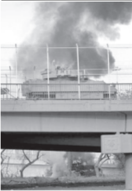
ဘဂ္ဂဒတ်လေဆိပ်သို့ သွားသည့်လမ်းပေါ်တွင် လမ်းဘေးမှပေါက်ကွဲမှု ဖြစ်ပွားပြီးနောက် အမေရိကန်စစ်ယာဉ်တစ်စီး မီးလောင်နေသည်ကို အောက်တိုဘာ ၂၃ရက်က တွေ့ရစဉ်။

ဗြိတိသျှတပ်ဖွဲ့ဝင်များက ပြန်လည် တုံ့ပြန်ပစ်ခတ်ခဲ့ကြကြောင်း အဆိုပါ တိုက်ခိုက်မှုကြောင့် ဘာဆရာ၏ တောင်ဘက်ရှိ ၎င်း၏ရုံးသို့ သွားနေရာမှ ရပ်ဆိုင်းခဲ့သော အသက်(၂၈)နှစ်ရှိ ရှေ့နေ အမာက ပြောကြားသည်။