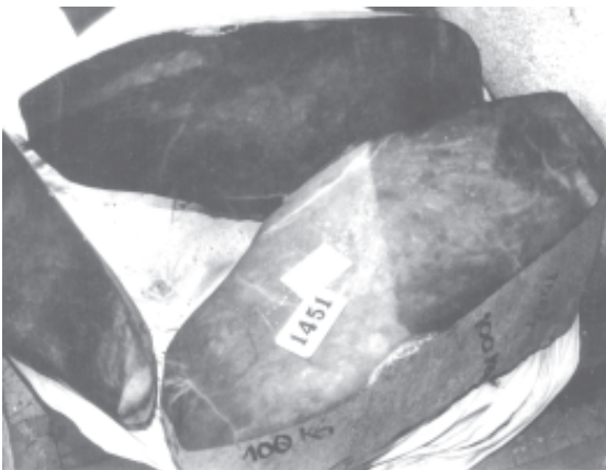
၂၀၀၄ခုနှစ် နှစ်လယ်မြန်မာ့ကျောက်မျက်ရတနာပြပွဲတွင် ပြသရောင်းချမည့် အခြေခံချေး ယူရိငွေ ၁၈၀၀၀၀ တန်ဖိုးရှိ ကျောက်စိမ်းတို့ကို တွေ့ရစဉ်။