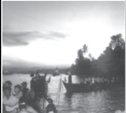
နေဝင် တိမ်တောက်ချိန် ရွှေကျင်ချောင်းရေပြင်အလှကို ဤသို့တွေ့ရသည်။ စာတိုပုံမှတ်တမ်း-ငွေစိုးဟန်