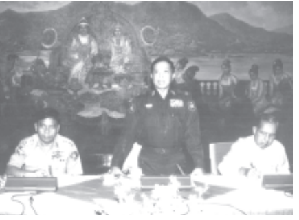
မြန်မာ့ကျောက်မျက်ရတနာပြပွဲ ဗဟိုကော်မတီနာယက သတ္တုတွင်းဝန်ကြီးဌာန ဝန်ကြီး ဗိုလ်မှူးချုပ်အုန်းမြင့် ၂၀၀၄ခုနှစ် နှစ်လယ် မြန်မာ့ကျောက်မျက်ရတနာပြပွဲ ဗဟိုကော်မတီ ဒုတိယအကြိမ်အစည်းအဝေးတွင် အမှာစကားပြောကြားစဉ်။ (သတင်းစဉ်)