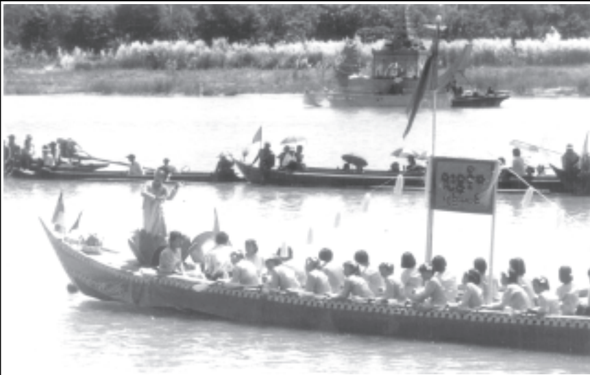
ဇူလိုင်လ ပျဉ်းမပင်မှ ရွှေကျင်လေ့လာ ကုမ္ပဏီပြိုင်ပွဲ ဤသို့ကျင်းပခဲ့ကြသည်။