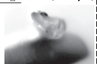
ရာစုခန့်က ရှေးဟောင်းပစ္စည်းဖြစ်ကြောင်း ပြောကြားသည်။

ဂရိနိုင်ငံမှ ရှာဖွေတွေ့ရှိခဲ့သော လွန်ခဲ့သည့် ဘီစီငါးရာစုခန့်က ဒင်္ဂါးပြားတစ်ခုကို စုဆောင်းသူတစ်ဦးက ပြသနေစဉ်။ (၁၃)