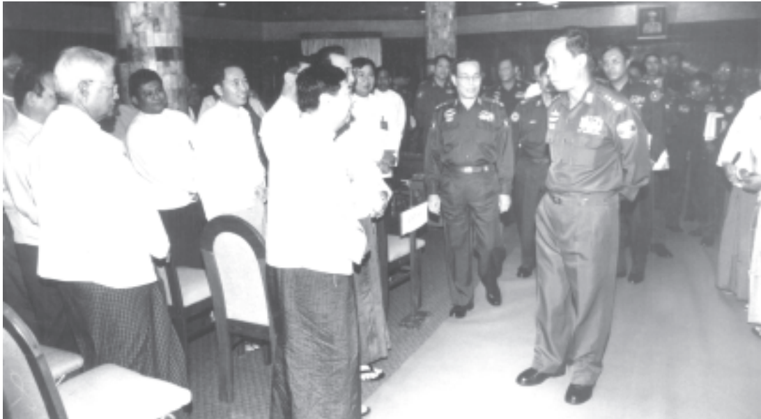
နိုင်ငံတော်အေးချမ်းသာယာရေးနှင့် ဖွံ့ဖြိုးရေးကောင်စီဝင် ဗိုလ်ချုပ်ကြီး သုရရွှေမန်းနှင့် နိုင်ငံတော်ဝန်ကြီးချုပ် ဒုတိယဗိုလ်ချုပ်ကြီးစိုးဝင်းတို့ ယနေ့နိုင်ငံတော်၌ ပြောင်းလဲဖြစ်ပေါ်နေသော အခြေအနေများနှင့်စပ်လျဉ်း၍ ရှင်းလင်းဖွဲ့အစမ်းအနားသို့ တက်ရောက်လာကြသော ပုဂ္ဂလိကလုပ်ငန်းရှင်များအား ရင်းရင်းနှီးနှီးဆက်ကြည့်။ (သတင်းစဉ်)

ယနေ့နိုင်ငံတော်၌ ပြောင်းလဲဖြစ်ပေါ်နေသော အခြေအနေများနှင့် စပ်လျဉ်း၍ ရှင်းလင်းဖွဲ့အစမ်းအနားတွင် တက်ရောက်လာကြသော ပုဂ္ဂလိကလုပ်ငန်းရှင်များအား တွေ့ရစဉ်။ (သတင်းစဉ်)