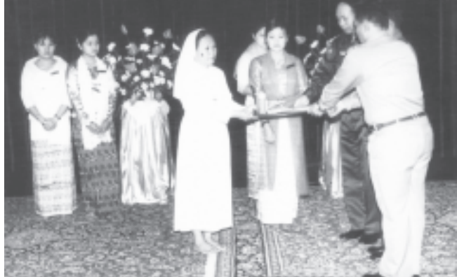
ရန်ကုန်အရှေ့ပိုင်းခရိုင် မင်္ဂလာတောင်ညွန့်မြို့နယ်ရှိ ကန်တော်လေးကက်သလစ်သီလရှင်များ ဘိုးဘွားရိပ်သာနှင့် ရန်ကုန်အနောက်ပိုင်းခရိုင် ဒဂုံမြို့နယ်ရှိ မေရီချက်ပ်မင်းနားမကြားသော ကလေးများကျောင်းသို့ တပ်မတော်(ကြည်းရေးလေ)မိသားစုများနှင့် စေတနာရှင် ပြည်သူများ၏ ဆန်းသီးဆားဆေးပဲနှင့် အလှူငွေများ လှူဒါန်းပွဲတွင် တပ်မတော်(ကြည်းရေးလေ)မိသားစုများကိုယ်စား ကာကွယ်ရေးဝန်ကြီးဌာနမှ အရာရှိကြီးများက ဆန်းသီးဆားဆေးပဲနှင့် အလှူငွေများ ပေးအပ်လှူဒါန်းစဉ်။