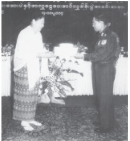
ရန်ကုန်အောက်ပိုင်းခရိုင် ကြည့်မြင်တိုင်၊ မရမ်းကုန်းနှင့် ဒဂုံမြို့နယ် များရှိ မျက်မမြင်ကျောင်းများနှင့် မေရီချက်ပ်မင်းနားမကြားသော ကလေး များကျောင်းသို့ တပ်မတော်(ကြည်းရေးလေ) မိသားစုများနှင့် စေတနာရှင် ပြည်သူများ၏ ဆန်းသီးဆားဆေးပဲနှင့် အလှူငွေများ လှူဒါန်းပွဲတွင် ရန်ကုန်တိုင်း အေးချမ်းသာယာရေးနှင့် ဖွံ့ဖြိုးရေးကောင်စီဥက္ကဋ္ဌ တိုင်းမှူး ဗိုလ်ချုပ်မြင့်ဆွေက ပေးအပ်လှူဒါန်းစဉ်။

ယင်းနောက် တပ်မတော်(ကြည်း၊ ရေးလေ)မိသားစုများကလှူဒါန်းသော ဆန်းသီးဆားဆေးပဲနှင့် အလှူငွေများ ကို တပ်မတော် (ကြည်းရေးလေ) မိသားစုများကိုယ်စား ကာကွယ်ရေး ဝန်ကြီးဌာနမှ ဗိုလ်ချုပ်မြင့်ဆွေ၊ စစ်ဦးစီး အရာရှိချုပ်(လေ)ဗိုလ်မှူးကြီးညွှတ်ထွန်း နှင့် ကာကွယ်ရေးဦးစီးချုပ်ချီး(လေ)မှ