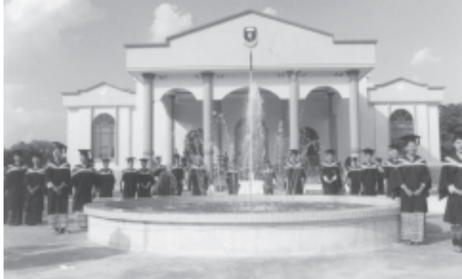
ပြည်ထောင်စုတိုင်းရင်းသားလူမျိုးများ ဖွံ့ဖြိုးရေးတက္ကသိုလ်တွင် သင်တန်းခန်းမ မျက်နှာစာတွင် ဘွဲ့၊ တိုင်းရင်းသား သွေးချင်း၊ သားချင်း ညီအစ်ကို၊ မောင်နှမများအား ဤသို့တွေ့ရသည်။

ဖွံ့ဖြိုးရေးတက္ကသိုလ်သည် သင်တန်းသုံး၊ သင်တန်းသားများကို ပညာရေးဝန်ထမ်း စည်းရုံးရေးမှူးကောင်းများအဖြစ် လေ့ကျင့်ပေးရန်မက သင်တန်းဆင်းများကိုလည်း မိမိတို့ဒေသတွင် တာဝန်ထမ်းဆောင်ရင်း အဆင့်မြင့်ပညာများ ဆက်လက်သင်ယူနိုင်အောင် စီမံပေးထားသည်။ သိပ္ပံကာလနှင့် နှိုင်းယှဉ်ပါက သင်ကြားလေ့ကျင့်ပေးသော သင်တန်းအမျိုးအစားမှာ မူလတန်းဆရာအတတ်သင်တန်းသားမက အလယ်တန်းဆရာအတတ်သင်တန်း၊ ပညာရေးဘွဲ့၊ သင်တန်းနှင့် မဟာဘွဲ့၊ သင်တန်းများကိုပါ တက္ကသိုလ်တွင် သင်ကြားလေ့ကျင့်ပေးနိုင်သည့်အထိ အဆင့်မြင့်မားလာခဲ့သည်။ မူလတန်း ဆရာအတတ်