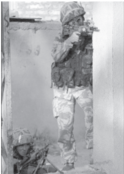
ဘာဆာရာမြို့တွင် လုံခြုံရေးစောင့်ကြပ်နေသော ဗြိတိသျှတပ်ဖွဲ့ဝင်များကို အောက်တိုဘာ ၁၅ရက်က တွေ့ရစဉ်။