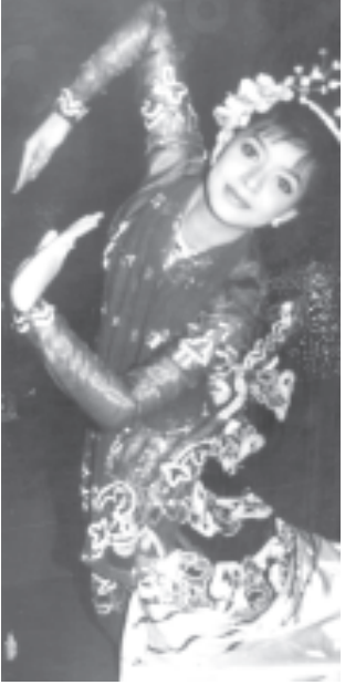
သတင်းအကျယ် စာမျက်နှာ (၁၂)