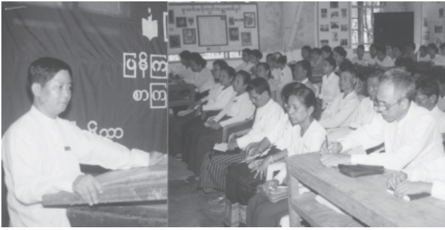
ရွှေပြည်သာမြို့နယ် ပြန်ကြားရေးနှင့် ပြည်သူ့ဆက်ဆံရေးဦးစီးဌာန စာကြည့်တိုက်ပညာဆင့်ပွား (၂/၂၀၀၄) သင်တန်းဖွင့်ပွဲကို အောက်တိုဘာ ၁၁ ရက်ကကျင်းပရာ မြို့နယ်ဥက္ကဋ္ဌဦးကျော်ညွန့်က အဖွင့်အမှာစကားပြော ကြစဉ်။ (မြို့နယ် ပြန်/ဆက်)