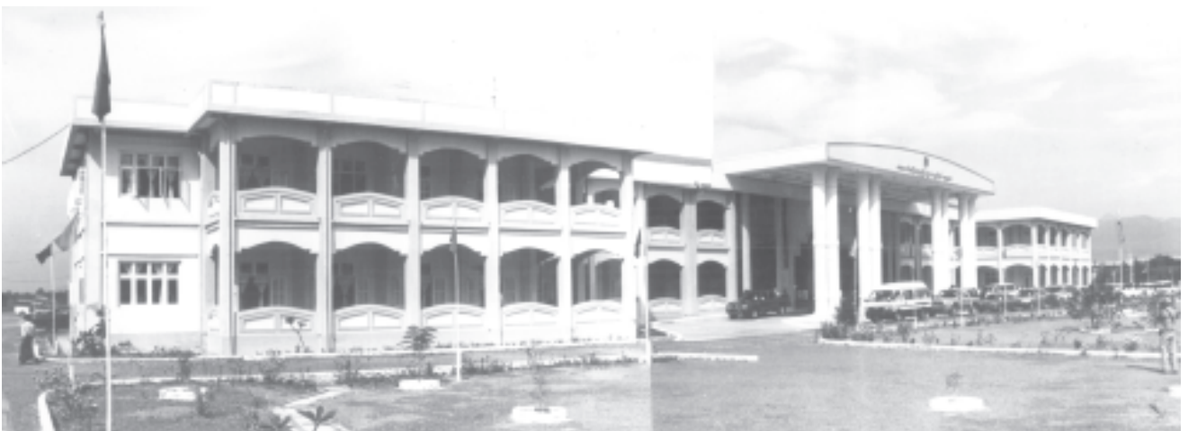
မန္တလေးတိုင်း ပုသိမ်ကြီးမြို့နယ်ရှိ ကျန်းမာရေးဝန်ကြီးဌာန ဆေးသိပ္ပံပညာဦးစီးဌာန၏ ဆေးဘက်ဆိုင်ရာ နည်းပညာတက္ကသိုလ် (မန္တလေး)ကို တွေ့ရစဉ်။