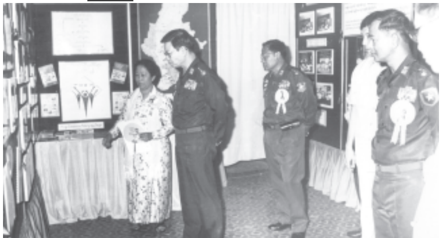
ရောဂါ ကာကွယ်တိုက်ဖျက်ရေးလှုပ်ရှားမှုပြပွဲ(မန္တလေး)ဖွင့်ပွဲ အခမ်းအနားကို မကြီးမြတ်ဖွင့်လှစ်ပေးကြသည်။