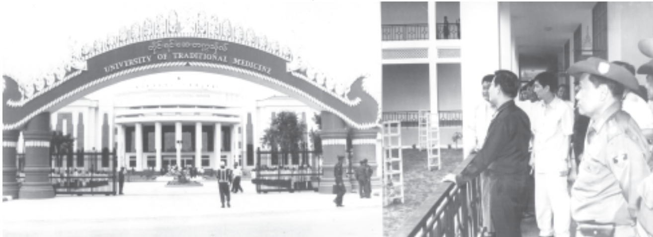
အောက်တိုဘာ ၁၆ ရက်က အမျိုးသားကျန်းမာရေးကော်မတီဥက္ကဋ္ဌ နိုင်တော်ဝန်ကြီးချုပ် ဗိုလ်ချုပ်ကြီးခင်ညွန့် မန္တလေးမြို့ တိုင်းရင်းဆေးတက္ကသိုလ်မှစဉ်း တည်ဆောက်ထားရှိမှုကို ကြည့်ရှု စစ်ဆေးစဉ်။ (သတင်း-ရေဝံ့) (သတင်းစဉ်)