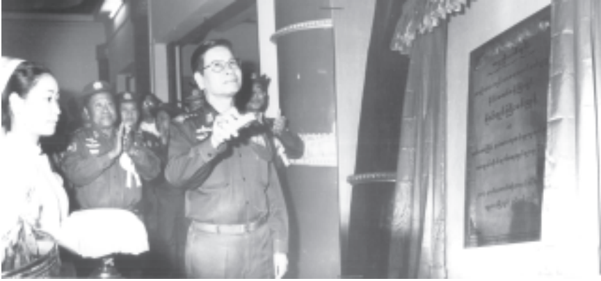
အမျိုးသားကျန်းမာရေးကော်မတီဥက္ကဋ္ဌ နိုင်ငံတော်ဝန်ကြီးချုပ် ဗိုလ်ချုပ်ကြီးစင်ညွန့်၊ မန္တလေးမြို့၊ ဖြိုတော်ခန်းမ၌ ကျင်းပသည့် ဒုတိယ အကြိမ် ခုခံအားကျဆင်းမှု ကူးစက်ရောဂါ ကာကွယ်တိုက်ဖျက်ရေး လှုပ်ရှားမှုပြပွဲ(မန္တလေး) ဖွင့်ပွဲအခမ်းအနားတွင် အထိမ်းအမှတ် ကမ္ဘာ့ မော်ကွန်းကြေးပြားကို စက်လှေတင်နှိပ်၍ ဖွင့်လှစ်ပေးစဉ်။ (သတင်းစဉ်)

အဆိုပါ ဖွင့်ပွဲအခမ်းအနားသို့ နိုင်ငံတော်အေးချမ်းသာယာရေးနှင့် ဖွံ့ဖြိုးရေးကောင်စီဝင်ဒုတိယဗိုလ်ချုပ်ကြီးရဲမြင့်၊ မန္တလေးတိုင်း အေးချမ်းသာယာ ရေးနှင့် ဖွံ့ဖြိုးရေးကောင်စီ ဥက္ကဋ္ဌအလယ်ပိုင်းတိုင်းစစ်ဌာနချုပ် တိုင်းမှူးဗိုလ်ချုပ် ရဲမြင့်၊ အစိုးရအဖွဲ့ အဖွဲ့ဝင်ဝန်ကြီးများ၊ မန္တလေးမြို့တော်ဝန်၊ ဒုတိယဝန်ကြီးများ၊ ဒုတိယတရားသူကြီးချုပ်၊ ဒုတိယတိုင်းမှူးနှင့် တပ်မတော်အရာရှိကြီးများ၊ တိုင်း၊ ခရိုင်၊ မြို့နယ်အဆင့် ဌာနဆိုင်ရာများနှင့် ဝန်ထမ်းများ၊ ကျန်းမာရေး ဝန်ကြီးဌာနမှ ဌာနဆိုင်ရာအကြီးအကဲများပါမောက္ခချုပ်များ၊ အထူးကုဆရာဝန် ကြီးများ၊ ပြည်တွင်းပြည်ပတို့မှအစိုးရမဟုတ်သော လူမှုရေးအသင်းအဖွဲ့များမှ တာဝန်ရှိရှိရှိလှပါသည်။ မန္တလေးမြို့ပေါ်ရှိ အခြေခံပညာအထက်တန်းကျောင်းများမှ ကျောင်းအုပ်ဆရာ ဆရာမကြီးများ၊ ဆရာ ဆရာမများနှင့် ကျောင်းသားကျောင်းသူ များ၊ ဘင်ခရုနှင့် ပန်းဖွားအကအသွယ်များ၊ မန္တလေးမြို့မှ ရပ်မိရပ်ဖများနှင့် ပြည်သူများ တက်ရောက်ကြသည်။