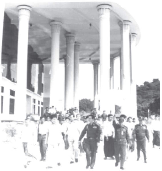
အမျိုးသားကျန်းမာရေးကော်မတီဥက္ကဋ္ဌ နိုင်ငံတော်ဝန်ကြီးချုပ် ဗိုလ်ချုပ်ကြီးခင်ညွန့် မန္တလေးမြို့ တိုင်းရင်းဆေးတက္ကသိုလ် တည်ဆောက်ပြီးစီးမှုကို လှည့်လည်ကြည့်ရှု စစ်ဆေးစဉ်။ (သတင်းစဉ်)

၁၃၆၆ ခုနှစ်၊ သီတင်းကျွတ်လဆန်း ၅ ရက်၊ ၂၀၀၄ ခုနှစ်၊ အောက်တိုဘာ ၁၈ ရက်၊ တနင်္လာနေ့၊ အတွဲ(၄၂)၊ အမှတ်(၁၈)