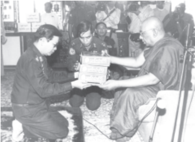
* ရှေ့ရိုးမှ

နိုင်ငံတော်ဝန်ကြီးချုပ် ဗိုလ်ချုပ်ကြီးခင်ညွန့်နှင့် အဖွဲ့ဝင်များအား စစ်ကိုင်းတိုင်း အေးချမ်းသာယာရေးနှင့် ဖွံ့ဖြိုးရေးကောင်စီ ဥက္ကဋ္ဌ အနောက်မြောက်တိုင်း စစ်ဌာနချုပ် တိုင်းမှူး ဗိုလ်ချုပ်ဘားအေး၊ နယ်မြေခံတပ်မှူး ဗိုလ်မှူးချုပ် တင်ထွန်းအောင်၊ တိုင်း၊ ခရိုင်အဆင့် ဌာနဆိုင်ရာပုဂ္ဂိုလ်များနှင့် လူမှုရေးအသင်းအဖွဲ့ဝင်များက ကြိုဆိုကြသည်။