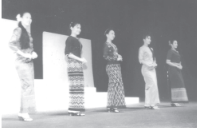
မြန်မာအမျိုးသမီးများနေ့ကို ဂုဏ်ပြုကျင်းပသည့် ဝတ်စားဆင်ယင် ထုံးစံ၊ ဖွဲ့ပြပွဲတွင် ပြည်တွင်းဖြစ် အထည်ဒီဇိုင်းသစ်များဖြင့် ကိုယ်ဟန်ပြနေ သော မြန်မာအမျိုးသမီးငယ်များအား ဤသို့တွေ့ရသည်။

ကမ္ဘာပေါ်ရှိ နိုင်ငံအသီးသီး လူမျိုးအသီးသီးသည် မည်မျှသေးငယ်သည် ဖြစ်စေ၊ မည်မျှ လူဦးရေသည်ပါးသည်ဖြစ်စေ မိမိတို့တွင် ကိုယ်ပိုင်ဘာသာစကား၊ ကိုယ်ပိုင်စာပေ၊ ကိုယ်ပိုင်ယဉ်ကျေးမှုရှိခြင်းကို အလွန်ဂုဏ်ယူကြသည်။ အလွန် အားရကျေနပ်ကြသည်။ ကိုယ်ပိုင်ပစ္စည်းကို သုံးစွဲရခြင်းသည် အငှားပစ္စည်း သုံးစွဲရသကဲ့သို့ မျက်နှာမငယ်၊ ဂုဏ်မငယ်၊ မိမိကိုယ်ကို ယုံကြည်စိတ်ချစွာ ခေါင်းမောရပ်တည်နိုင်သောကြောင့် ဖြစ်သည်။