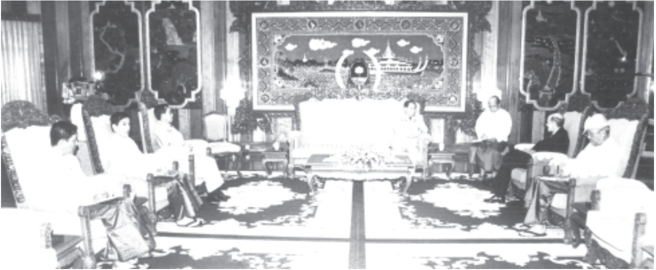
အောက်တိုဘာ ၁၅ရက်က နိုင်ငံတော်အေးချမ်းသာယာရေးနှင့် ဖွံ့ဖြိုးရေးကောင်စီ ဥက္ကဋ္ဌ ဗိုလ်ချုပ်မှူးကြီး သန်းရွှေ ပြည်ထောင်စုမြန်မာနိုင်ငံတော်ဆိုင်ရာ ပေါ်တူဂီနိုင်ငံ သံအမတ်ကြီး မစ္စတာ ဂျီအာဆို၊ အန်တိုနီယို၊ ဒီ၊ ဆီလ်ဗီးယားရာ၊ ဒီ၊ လီမာ၊ ပီမင်တယ်လ်အား ရန်ကုန်မြို့ ကုန်းမြင့်သာရှိ ဓေယျာသိရိမိမာန်ခန်းမ၌ လက်ခံတွေ့ဆုံစဉ်။ (သတင်း-ရှေ့ဖုံး) (သတင်းစဉ်)