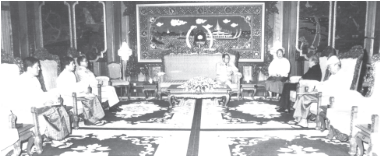
အောက်တိုဘာ ၁၅ရက်က နိုင်ငံတော်အေးချမ်းသာယာရေးနှင့် ဖွံ့ဖြိုးရေးကောင်စီ ဥက္ကဋ္ဌ ဗိုလ်ချုပ်မှူးကြီး သန်းရွှေ ပြည်ထောင်စုမြန်မာနိုင်ငံတော်ဆိုင်ရာ ဆိုက်ပရပ်(စ်)နိုင်ငံ သံအမတ်ကြီး မစ္စတာ အင်ဒရီယပ်(စ်) ဂျီကေားပါးရီး(စ်)အား ရန်ကုန်မြို့ ကုန်းမြင့်သာရှိ ဓေယျာသိရိမိမာန်ခန်းမ၌ လက်ခံတွေ့ဆုံစဉ်။ (သတင်း-ရှေ့ဖုံး) (သတင်းစဉ်)