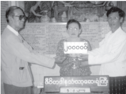
နီတိတင်နာသထာရေရိတ္တိ

ကျပ်သိန်း ၃၀၊ စည်းစိမ်မွေ့ခန်းမ(၁) အတွက် ကျပ်သိန်း ၃၀၊ စည်းစိမ်မွေ့ခန်းမ (၂)အတွက် ကျပ်သိန်း ၃၀၊ ဆရာတော် ကိရိမ္မာစင်္ကန်းအေးအတွက် ကျပ်သိန်း ၆၀ နှုန်းဖြင့် လှူဒါန်းနိုင်ကြောင်းနှင့် ကျပ်တစ်သိန်းနှင့်အထက် အလှူရှင် အားလုံးကို ကျောက်စာကမ္ဘာဦးရေးထိုး မှတ်တမ်းတင်မည်ဖြစ်သည်။ အလှူရှင် များသည် ဝေယျာဝစ္စအဖွဲ့၊ ဖုန်း- ၆၄၂၂၀၉ သို့ ဆက်သွယ်လှူဒါန်းနိုင် ကြောင်းသိရသည်။ (က-၁)