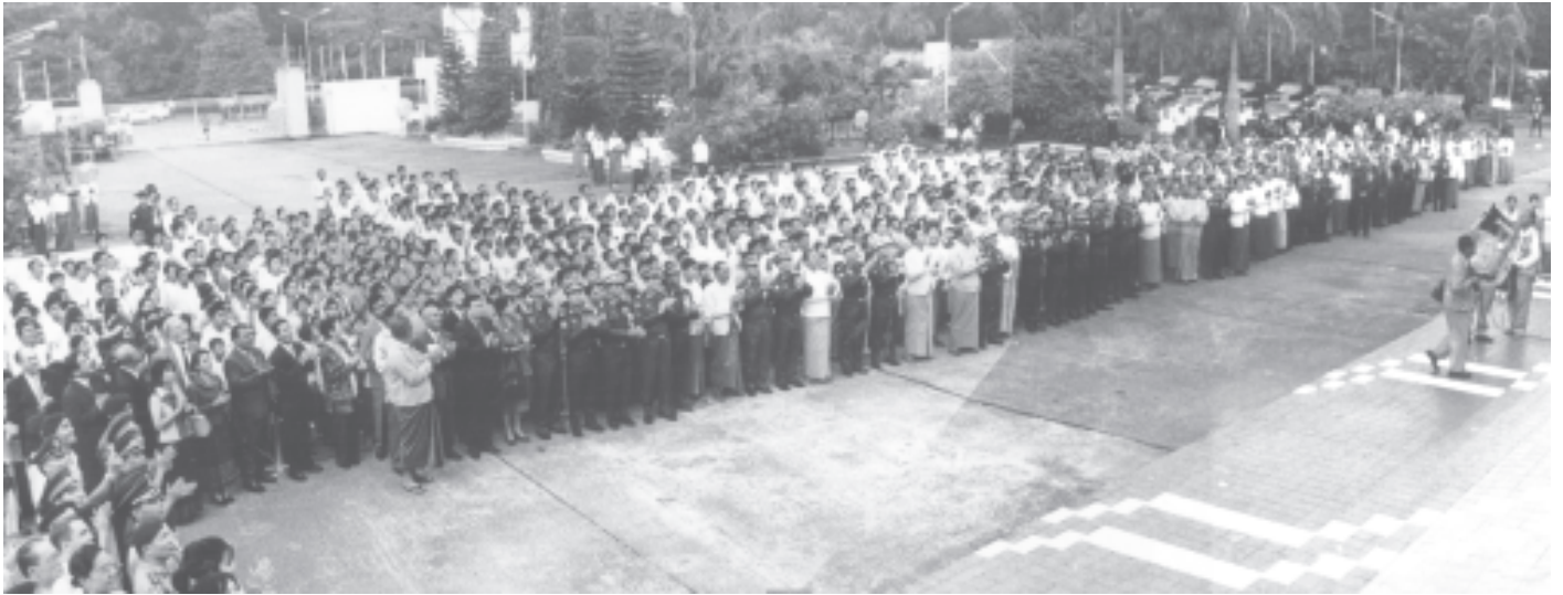
☆ ရွှေစိုးမှ

မြန်မာ့ရိုးရာယဉ်ကျေးမှု အနုပညာရပ်များကို လေးစားမြတ်နိုးဂုဏ်ယူတတ်တဲ့ စိတ်ဓာတ်ရေးရာအခြေခံကောင်းများ တည်ဆောက်ပေးနေခြင်းဟာ မြန်မာဆိုတဲ့ မြင့်မြတ်တဲ့အမျိုးအနွယ်နဲ့ မျိုးရိုးစဉ်လာတွေ၊ မြန်မာ့ရိုးရာယဉ်ကျေးမှု လေ့စရိုက်နဲ့ အမျိုးသားရေး စရိုက်လက္ခဏာတွေကို ပိုမိုတည်တံ့ခိုင်ခံ့စေရအောင် ဖော်ဆောင်မြှင့်တင်ပေးခြင်းလဲ ဖြစ်ပါတယ်လို့ ပထမဦးစွာပြောကြားလို့ပါတယ်။ နိုင်ငံတကာအလယ်မှာ နိုင်ငံတစ်နိုင်ငံနဲ့ လူမျိုးတစ်မျိုးရယ်လို့ ထည့်ထည့် ဝါဝါ ခံခံညှာညှာဖြစ်တည်လာစေဖို့ဆိုရာမှာ နိုင်ငံမာတဲ့ ယဉ်ကျေးမှုသမိုင်းစဉ် အဆင့်ဆင့်ကို တိုင်းရင်းသားပြည်သူအားလုံး အေးအတူပူအမျှ စည်းစည်းလုံးလုံး ညီညီညွတ်ညွတ် လက်တွဲဖြစ်သနားကြရစေခြင်းဖြစ်သလို ဒီလိုနိုင်ငံတော် တည်ထောင်မှုသမိုင်းစဉ်တစ်လျှောက် မိမိတို့ရဲ့ကိုယ်ပိုင်အမျိုးသားရေးစရိုက် လက္ခဏာတွေနဲ့ ကိုယ်ပိုင်အမျိုးသားယဉ်ကျေးမှုတွေ မပျောက်ပျက်အောင် ကာကွယ်ထိန်းသိမ်းစောင့်ရှောက်ကြရစေ ခေမာတည်ဖြစ်ပါတယ်။