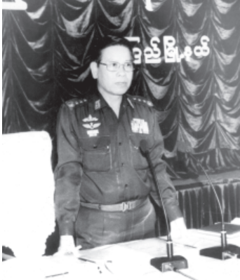
စာမျက်နှာ ၆ မှ

များနှင့် ကမ်းခြေဖွံ့ဖြိုးတိုးတက်ရေးအတွက် တိုင်းရင်းသား ဟိုတယ်လုပ်ငန်း ရှင်များနှင့် ပူးပေါင်းဆောင်ရွက်မှု အခြေအနေတို့ကို ရှင်းလင်းတင်ပြ သည်။