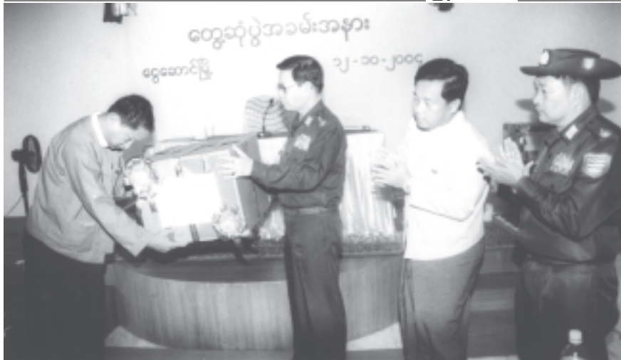
မြန်မာနိုင်ငံ ပညာရေးကော်မတီဥက္ကဋ္ဌ နိုင်တော်ဝန်ကြီးချုပ် ဗိုလ်ချုပ်ကြီးစင်ညွန့်၊ အောက်တိုဘာ ၁၂ရက်က မြန်မာနိုင်ငံ ပညာရေး ကော်မတီဥက္ကဋ္ဌ ယုဒဓကုဗ္ဗဏီလီမိတက်ဥက္ကဋ္ဌ ဦးဌေးမြင့် လှူဒါန်းသည့် ကွန်ပျူတာ သုံးစုံကို ငွေဆောင်မြို့ အခြေစိုက်ပညာအထက်တန်းကျောင်း တွင် အသုံးပြုရန် ကျောင်းအုပ်ဆရာကြီး ဦးသန်းမျစ်အား လွှဲပြောင်းပေးအပ်စဉ်။ (သတင်းစဉ်)

* ကျော့ဆုံးမှ နိုင်ငံတော်အေးချမ်းသာယာရေးနှင့် ဖွံ့ဖြိုးရေးကောင်စီရုံးမှ တာဝန်ရှိသူများနှင့် ဌာနဆိုင်ရာ အကြံအစည်များလုပ်ငန်းများ အောက်တိုဘာ ၁၂ရက်နေ့နံနက်ပိုင်းတွင် ရဟတ်ယာဉ်များဖြင့် ပယ်ဖျက်မှု ထွက်ခွာခံရ နံနက်၈နာရီခွဲတွင် ပယ်ဖျက်မှု ငွေဆောင်ကမ်းခြေသို့ ရောက်ရှိကြသည်။ နိုင်ငံတော်ဝန်ကြီးချုပ် ဗိုလ်ချုပ်ကြီးစင်ညွန့်နှင့်အဖွဲ့ဝင်များအား အနောက်တောင်တိုင်းစစ်ဌာနချုပ်မှ တိုင်းဦးစီး ဗိုလ်မှူးကြီးတင်ဆွေ၊ ပယ်ဖျက်မှုနှင့်ငွေဆောင်မြို့တို့မှ ဌာနဆိုင်ရာများ၊ လူမှုရေးအသင်းအဖွဲ့ဝင်များ၊ တိုင်းရင်းသားဟိုတယ်လုပ်ငန်းရှင်များကကြိုဆိုကြသည်။ ယင်းနောက် မြန်မာနိုင်ငံပညာရေးကော်မတီဥက္ကဋ္ဌ နိုင်တော်ဝန်ကြီးချုပ် ဗိုလ်ချုပ်ကြီးစင်ညွန့်နှင့်အဖွဲ့ဝင်များသည် ငွေဆောင်မြို့ အခြေစိုက်ပညာအထက်တန်းကျောင်းသို့ရောက်ရှိကြရာ ကျောင်းသား ကျောင်းသူလေးများက 'မြန်မာ့ကျောင်း' သီချင်းကို သီဆို၍ကြိုဆိုကြသည်။