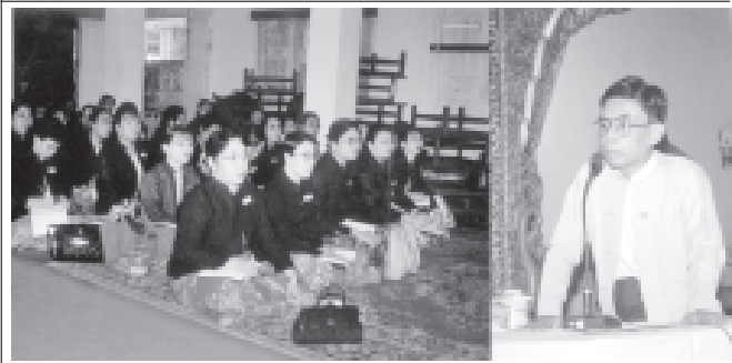
ရန်ကုန်တိုင်းအတွင်းရှိ တရားရုံးအဆင့်ဆင့်၏ တရားစီရင်ရေးလုပ်ငန်း ညှိနှိုင်းဆွေးနွေးပွဲကို ဗဟိုကြီးတော်ရလမ်းရှိ တရားရုံးချုပ်မှူးချုပ်က တက်ရောက်ပြီး ဦးဆောင်ဆွေးနွေးကြားစဉ်။ (က-၁)

ရန်ကုန် အောက်တိုဘာ ၁၄ မြန်မာနိုင်ငံ ဝိဇ္ဇာနှင့်သိပ္ပံပညာရှင်အဖွဲ့က ကြီးကြပ်စောင့်ကြည့်သော သုတေသနစာတမ်းပတ်ပွဲကို ရန်ကုန်မြို့၊ စိန်ရတနာသင်တန်းမဉ်း အောက်တိုဘာ ၂၂ ရက်နေ့က စတင်ကျင်းပမည် ဖြစ်ပြီး စာတမ်းပတ်ပွဲများကို ရန်ကုန်တက္ကသိုလ်ပင်မ စာသင်ခန်းမတို့၌ အခန်းခြောက်ခန်းနှင့် ရန်ကုန်စီးပွားရေးတက္ကသိုလ်စာသင်ခန်းမတို့၌ အခန်းရှစ်ခန်းခွဲကာ တွေ့ဆုံမေးမြန်းလှည့်လည် အစပြု၍ တစ်ပြိုင်တည်း ကျင်းပသွားမည် ဖြစ်သည်။