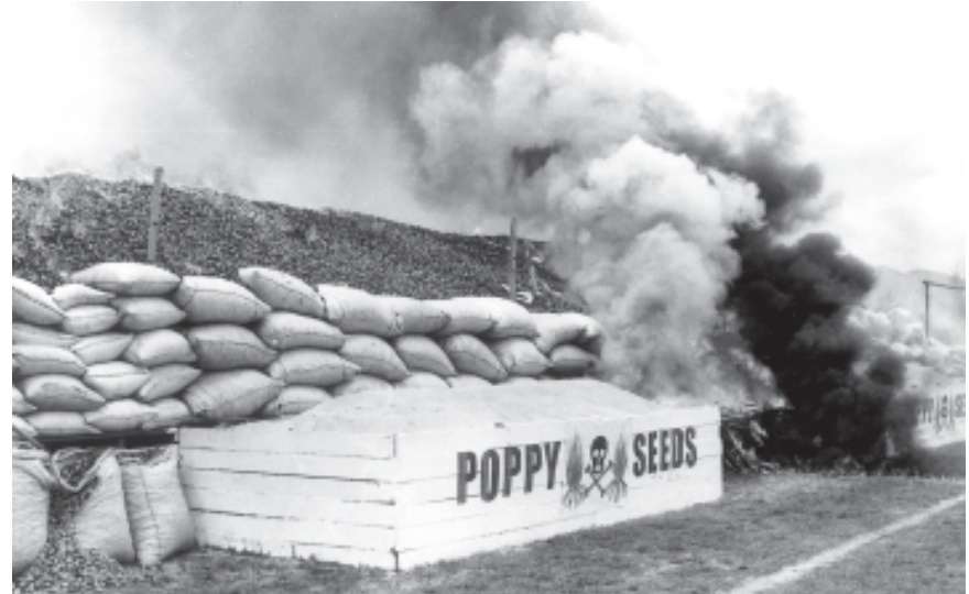
၂၀၀၂ခုနှစ် ဇွန် ၇ ရက်က ရှမ်းပြည်နယ် (မြောက်ပိုင်း) လားရှိုးမြို့ အားကစားကွင်းတွင် တောင်သူများအပ်နှံသည့် ဘိန်းမျိုးပွားများနှင့် ဖမ်းဆီးရမ်း မူးယစ်ဆေးဝါးများကို ဤသို့ စီးချိုမှုကိန်းခံခဲ့ရသည်။

တိုက်တွန်းပြောကြားထားသည့် ရည်မှန်းချက်များဖြစ်ကြောင်း၊ ဘိန်းစိုက်ပျိုးခြင်းမှရှောင်ကာ ဝင်ငွေဆုံးရှုံးခြင်းဖြင့် ဆုံးသုံးစွားရွာထိန်းကိန်းမည် မြန်မာနိုင်ငံအတွင်းမှ ထိုမိသားစုများအတွက် အစားထိုးဝင်ငွေရှာဖွေခြင်းဖြင့် ဤလုပ်ငန်းစဉ်ကို ထောက်ခံရန် နိုင်ငံတကာ အလှူရှင် အသိုက်အဝန်းတွင် တာဝန်ရှိကြောင်း” ဖြင့်လည်း မစ္စတာကော့စတာက ကောက်ချက်ချပြောကြားသွားသည်။ UNODC နှင့် မြန်မာနိုင်ငံ မူးယစ်ဆေးဝါးနှင့် စိတ်ကိုပြောင်းလဲစေသော ဆေးဝါးများအဖွဲ့ ရာယီတားဆီးကာကွယ်ရေးဗဟိုအဖွဲ့တို့ပူးတွဲပြုနေသည့် ဤကွင်းဆင်းလေ့လာချက်တွင် မူးယစ်ဆေးဝါးသုံးစွဲမှုဆိုင်ရာ ကိန်းဂဏန်းများကိုလည်း ဖော်ပြထားသည်။ဤကွင်းဆင်းလေ့လာချက်သည် ဂြိုဟ်တုဓာတ်ပုံ ရိုက်ယူချက်များနှင့်အတူ မြေပြင်တွင် ကွင်းဆင်းစာရင်းကောက် လေ့လာတွေ့ရှိမှုများကို အခြေခံပြုစုထားခြင်းဖြစ်သည်။ (ယူအင်နီအိုစီ)