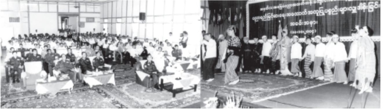
ရန်ကုန် အောက်တိုဘာ ၁၂

ရန်ကုန်တိုင်း ရန်ကုန်မြောက်ပိုင်းခရိုင် မင်္ဂလာဒုံမြို့နယ် အမှတ်(၁)အခြေခံပညာအထက်တန်းကျောင်း ပညာရပ်မြင့်မားရေး အထောက်အကူပြု စာသင်ခန်းများဖွင့်ပွဲ အခမ်းအနားကို ယမန်နေ့ နံနက် ၇ နာရီခွဲတွင် အဆိုပါကျောင်း၌ ကျင်းပရာ မြန်မာနိုင်ငံပညာရေးကော်မတီ ဒုတိယဥက္ကဋ္ဌ နိုင်ငံတော် အေးချမ်းသာယာရေးနှင့် ဖွံ့ဖြိုးရေးကောင်စီ အတွင်းရေးမှူး(၁) ဒုတိယဗိုလ်ချုပ်ကြီးစိုးဝင်း တက်ရောက်အားပေးချီးမြှင့်သည်။