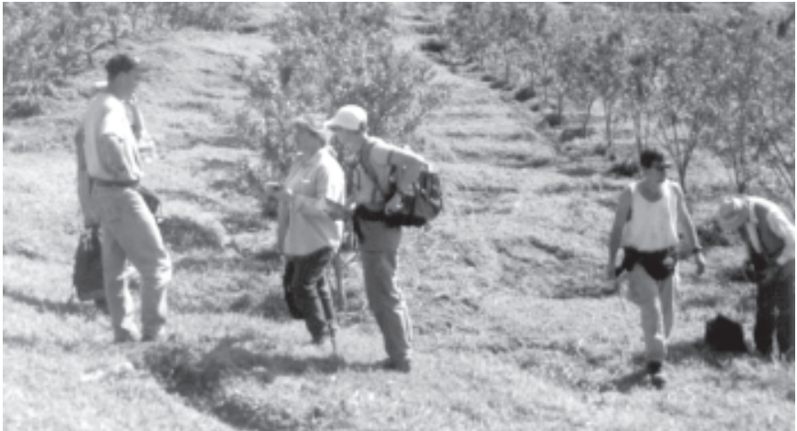
မူးယစ်ဆေးဝါးပပျောက်ရေးအတွက် မြန်မာ-အမေရိကန် နှစ်နိုင်ငံအစိုးရ ပူးပေါင်းဆောင်ရွက်မှု (၉)ကြိမ်မြောက်အစီအစဉ်အဖြစ် ၂၀၀၃ခုနှစ် ဖေဖော်ဝါရီလအတွင်းက ရှမ်းပြည်နယ်အတွင်းရှိ ဘိန်းအစားထိုး သီးနှံစိုက်ခင်းများကို ဤသို့ ကွင်းဆင်းကြည့်ရှုခဲ့ကြသည်။ (ဓာတ်ပုံမှတ်တမ်း-မြန်မာ့အလင်း)

စိုက်သည့်အိမ်ထောင်စုများ၏ ပျမ်းမျှဝင်ငွေထက် ၃၀ ရာခိုင်နှုန်း ပိုမိုမြင့်မားနေခြင်းပင်ဖြစ်သည်။ “ဆင်းရဲနွမ်းပါးမှုနှင့် ကြုံတွေ့နေသော တောင်သူအချို့အတွက် ဘိန်းသည်သာ နောက်ဆုံးအားထားမိမိစရာ တစ်ခုဖြစ်နေကြောင်း” မစ္စတာကော့စတာကပြောသည်။ “မြန်မာနိုင်ငံရှိ ဘိန်းစိုက်တောင်သူများအား မိမိတို့က အခြေခံလူမှုရေး လိုအပ်ချက်များ ဖြည့်ဆည်းပေးလျှင် ၎င်းတို့အနေဖြင့် ဆင်းရဲနွမ်းပါးဘိန်းစိုက်ပျိုးမှု သဘာဝမှာ မည်သည့်အခါမျှ ရုန်းထွက်နိုင်မည်မဟုတ်ဟု” မစ္စတာကော့စတာက ထည့်သွင်းပြောကြားလိုက်သည်။