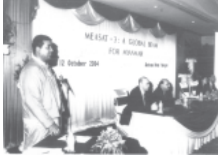
အသုံးပြုနိုင်

ထို့နောက် ပြန်ကြားရေးဝန်ကြီးဌာန ဝန်ကြီး ဗိုလ်မှူးချုပ်ကျော်ဆန်းသည် နံနက် ၉နာရီခွဲတွင် MEASAT-3မိတ်ဆက်ရှင်းလင်းပွဲ အခမ်းအနားမှ ပြန်လည်ထွက်ခွာသွားသည်။