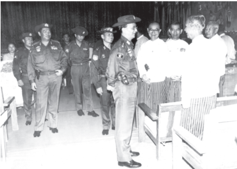
စာမျက်နှာ ၉ မှ

နိုင်ငံတော် အေးချမ်းသာယာ ရေးနှင့် ဖွံ့ဖြိုးရေး ကောင်စီ အတွင်း ရေးမှူး(၂) ဒုတိယ ဗိုလ် ခုနစ် ကြီး သိန်းစိန် လားရှိုး မြို့၊ မြို့တော်ခန်းမ ဌာနဆိုင်ရာ တာဝန်ရှိသူများ၊ ဒေသမဲပြည်သူ များ၊ လူမှုရေး အသင်းအဖွဲ့ဝင် များအား တွေ့ဆုံ အပြောအဆို အခမ်း အနားတက်ရောက် လာသူများအား ရင်းရင်းနှီးနှီး နှုတ် ဆက်စပ်။