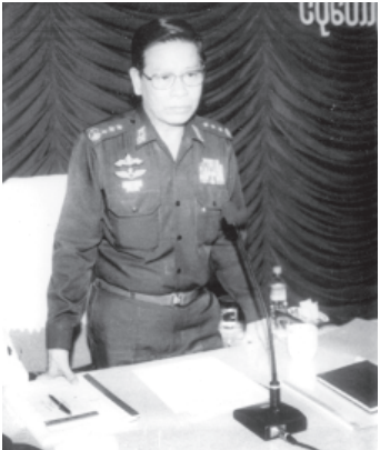
ကျော့စုံမှ

အကျယ်အဝန်း၊ မြို့နယ်ဖွဲ့စည်းပုံ၊ ၂၀၀၄-၂၀၀၅ခုနှစ် မိုးစပါးစိုက်ပျိုးမှု၊ ဂုဏ်ထူးဆောင်များ၊ အဓိကသီးနှံ (၁၀)မျိုး ပန်းတိုင်အထွက်နှုန်းရရှိရေး ဆောင်ရွက်နေမှု၊ ဒေသဆန်ဖူလုံမှုအခြေအနေ၊ မွေးမြူရေးနှင့် အသားထုတ် လုပ်မှုအခြေအနေ၊ ကျေးလက်ဒေသ ဖွံ့ဖြိုးရေးလုပ်ငန်းစဉ်(၅)ရပ်ဆောင်ရွက်မှု အခြေအနေများနှင့် မြို့နယ်၏ လိုအပ်ချက်များကို ရှင်းလင်းတင်ပြသည်။ ယင်းနောက် သာပေါင်းမြို့နယ် ဌာနဆိုင်ရာများက မြို့နယ်၏ စိုက်ပျိုးရေး၊ ပညာရေး၊ ကျန်းမာရေး၊ စည်ပင်သာယာရေး၊ လမ်းပန်းဆက်သွယ်ရေးကိစ္စရပ် များကို ရှင်းလင်းတင်ပြကြရာ နိုင်ငံတော်ဝန်ကြီးချုပ် ဗိုလ်ချုပ်ကြီးခင်ညွန့်က တင်ပြချက်များနှင့်ပတ်သက်၍ သိရှိလိုသည့်များကို စိစစ်မေးမြန်းပြီး လိုအပ်ချက် အလိုက် ဝန်ကြီးဌာနများမှ တာဝန်ရှိရှိလုပ်ဆောင် စီမံဖြည့်ဆည်းဆောင်ရွက်ပေး သည်။