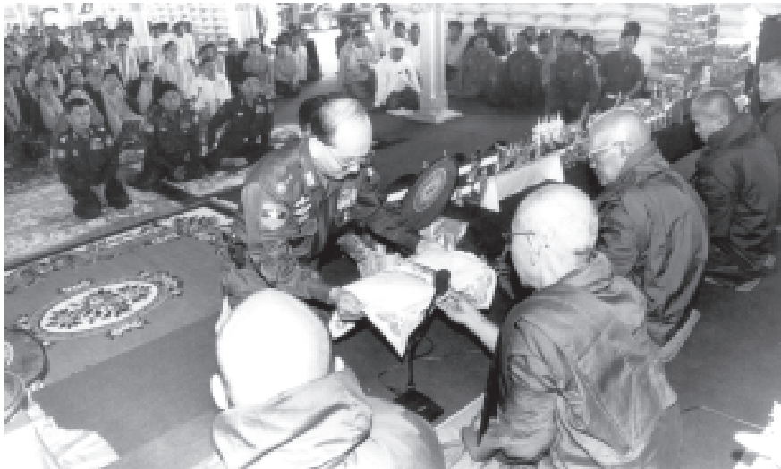
နိုင်ငံတော် အေးချမ်းသာယာရေးနှင့် ဖွံ့ဖြိုးရေးကောင်စီ အတွင်းရေးမှူး(၂) ဒုတိယဗိုလ်ချုပ်ကြီးသိန်းစိန် လားရှိုးမြို့ပေါ်ရှိ စာသင်တိုက်ကြီးများနှင့် သီလရှင်ကျောင်းများသို့ ဆွမ်းဆန်တော်။ မီး၊ ဆားဆက်ကပ်လှူဒါန်းပွဲအခမ်းအနားတွင် မဟာမောဓာရုံကျောင်းတိုက် ဆရာတော်ဘိ ဆွမ်းဆန်တော်၊ ဆီနီဆေးများ ဆက်ကပ်လှူဒါန်းတော်။ (သတင်းစဉ်)

ထို့နောက် စေတီတော်တည်ထား ကိုးကွယ်ရေး လုပ်ငန်းကြီးကြပ်မှု ကော်မတီဥက္ကဋ္ဌ ရဲမှူးကြီးဝင်းနိုင်က ဘဏ္ဍာငွေရရှိမှု၊ သုံးစွဲမှု၊ လုပ်ငန်းသုံး