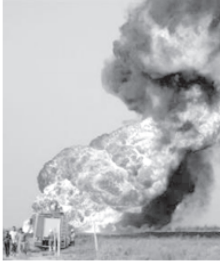
ဘဂ္ဂဒက်မြို့ အနောက်ဘက်ရှိ ရေနံပိုက်လိုင်းတစ်ခု တိုက်ခိုက်ခံရ မှုကြောင့် မီးလောင်နေသည်ကို အောက်တိုဘာ ၇ ရက်က တွေ့ရစဉ်။