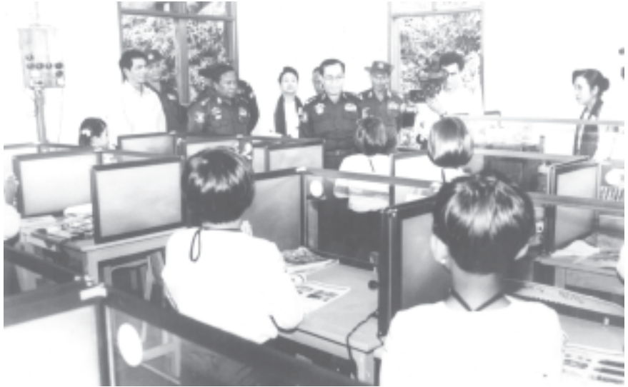
မြန်မာနိုင်ငံပညာရေးကော်မတီ ဒုတိယဥက္ကဋ္ဌ နိုင်ငံတော်အေးချမ်းသာယာရေးနှင့် ဖွံ့ဖြိုးရေးကောင်စီ အတွင်းရေးမှူး(၁) ဒုတိယဗိုလ်ချုပ်ကြီးစိုးဝင်း မန္တလေးတိုင်း ချမ်းအေးသာစံမြို့နယ် အမှတ်(၄)အခြေခံပညာမူလတန်းကျောင်း ပညာရပ်မြင့်မားရေးအထောက်အကူပြု စာသင်ခန်းများ ဖွင့်ပွဲတွင် သင်ထောက်ကူပစ္စည်းများအသုံးပြု၍ ကျောင်းသား ကျောင်းသူများ သင်ကြားနေမှုကို ကြည့်ရှုစစ်ဆေးစဉ်။ (သတင်းစဉ်)

အခမ်းအနားသို့ နိုင်ငံတော်အေးချမ်းသာယာရေးနှင့် ဖွံ့ဖြိုးရေးကောင်စီဝင် ဒုတိယဗိုလ်ချုပ်ကြီးရဲမြင့်၊ မန္တလေးတိုင်းအေးချမ်းသာယာရေးနှင့် ဖွံ့ဖြိုးရေးကောင်စီဥက္ကဋ္ဌ အလယ်ပိုင်းတိုင်းစစ်ဌာနချုပ် တိုင်းမှူး ဗိုလ်ချုပ်ရဲမြင့်၊ အစိုးရအဖွဲ့ အဖွဲ့ဝင်ဝန်ကြီးများ၊ ဒုတိယဝန်ကြီးများ၊ မန္တလေးမြို့တော်ဝန်၊ နိုင်ငံတော်အေးချမ်းသာယာရေးနှင့် ဖွံ့ဖြိုးရေးကောင်စီရုံးမှ တာဝန်ရှိပုဂ္ဂိုလ်များ၊ ဌာနဆိုင်ရာအကြီးအကဲများ၊ တိုင်း၊ ခရိုင်၊ မြို့နယ်မှ ဌာနဆိုင်ရာများ၊ ကျောင်းအုပ်ဆရာမကြီးနှင့် ဆရာဆရာမများ၊ မိဘဆရာအသင်းနှင့် ကျောင်းအကျိုးတော်ဆောင်အဖွဲ့တို့မှ တာဝန်ရှိသူများ၊ အလှူရှင်များ၊ ကျောင်းသားမိဘများနှင့် ကျောင်းသား ကျောင်းသူများ တက်ရောက်ကြသည်။ စာမျက်နှာ ၇ ကော်လံ ၁ *