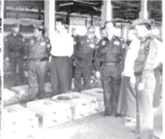
စက်မှုလုပ်ငန်း ဖွံ့ဖြိုးတိုးတက်ရေးကော်မတီဥက္ကဋ္ဌ နိုင်ငံတော်အေးချမ်းသာယာရေးနှင့် ဖွံ့ဖြိုးရေးကောင်စီ အတွင်းရေးမှူး(၁) ဒုတိယဗိုလ်ချုပ်ကြီးစိုးဝင်း၊ မန္တလေးစက်မှုဇုန်ရှိ အောင်နိုင်သူ စက်မှုလက်မှု လုပ်ငန်းခွင်တွင် ကြည့်ရှုစစ်ဆေးစဉ်။