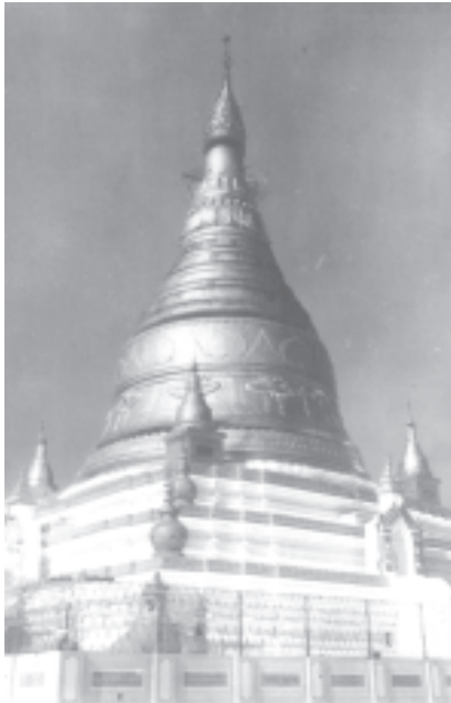
ဆွမ်းဦးပုညရှင်စေတီတော်ကြီးကို အနီးကပ်ဖူးမြော်ရစဉ်။

စစ်ကိုင်းတောင်ရှိ စေတီတော်တို့တွင် တည်ရှိသော ဆွမ်းဦးပုညရှင်စေတီတော်မြတ်ကြီး၏ ထီးတော်မြတ်ကြီးမှာ နှစ်ပေါင်းနှစ်ရာခန့် ကြာညောင်းဟောင်းနွမ်းနေပြီဖြစ်သည့်အတွက် စေတီတော်ကြီး၏ ဩဝါဒါစရိယဆရာတော်ကြီးများအဖွဲ့၊ စစ်ကိုင်းတိုင်း အေးချမ်းသာယာရေးနှင့် ဖွံ့ဖြိုးရေးကောင်စီနှင့် သီတဂူဆရာတော်တို့ဦးဆောင်၍ ထီးတော်၊ ငှက်မြတ်နားတော်နှင့် စိန်ဖူးတော်တို့ကို အသစ်တင်လှူမည်ဖြစ်ရာ ကုသိုလ်ဒါန ပါဝင်လိုကြသည့် စေတနာရှင် အပေါင်းတို့သည် ပုညရှင်စေတီတော် ဂေါပကအဖွဲ့၊ စစ်ကိုင်းတိုင်း အေးချမ်းသာယာရေးနှင့် ဖွံ့ဖြိုးရေးကောင်စီနှင့် သီတဂူဆရာတော်တို့ထံ ဆက်သွယ်လှူဒါန်းနိုင်ကြကြောင်း သတင်းကောင်း ပါးအပ်ပါသည်။