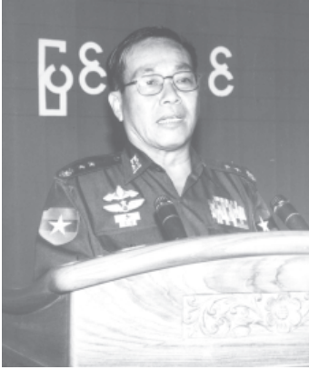
ကျော့မှူး

ဆရာ ဆရာမများအနေဖြင့် မိမိတို့၏ နယ်မြေများသို့ ပြန်ရောက်ကြသည့်အခါ ယခုသင်တန်းတွင်ရရှိခဲ့သော အသိအမြင်များ၊ အတွေးအခေါ်များကို ကျန် ပညာရေးဝန်ထမ်းများအပြင် နီးစပ်ရာမိဘပြည်သူများအား နားလည်သဘော ပေါက်အောင် ထပ်ဆင့်မျှဝေ ပြောပြနိုင်ရန်ဖြစ်သကဲ့သို့ မိမိတို့၏ ပညာရေး ဆိုင်ရာ လုပ်ငန်းတာဝန်များကိုလည်း ဤအတွေးသစ်၊ အမြင်သစ်များကို အခြေခံပြီး မိမိစီးစီး ထိထိရောက်ရောက် တက်တက်ကြွကြွ ထမ်းဆောင်သွား ကြရမည်ဖြစ်ကြောင်း။