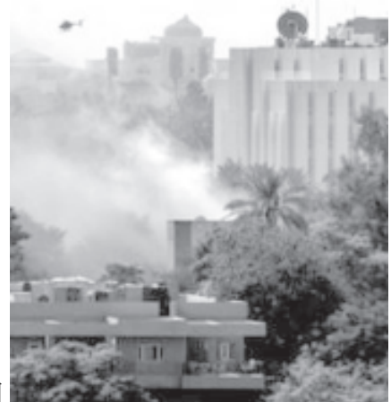
ဘဂ္ဂဒက်မြို့ အစိမ်းရောင်နယ်မြေတွင် ဖုံးပေါက်ကွဲမှုဖြစ်ပွားပြီးနောက် အမေရိကန် စစ်ဌာနချုပ်အနီး မီးခိုးလုံးများတက်နေသည်ကို အောက်တိုဘာ ၇ရက်က တွေ့ရစဉ်။ (ဓာတ်ပုံ-အင်တာနက်)

တပ်ဖွဲ့ဝင်တစ်ဦးသေဆုံးပြီး အခြားနှစ်ဦး ဒဏ်ရာရခဲ့သည်။ ဘေဂျီအနီး၌ ကင်းလှည့်တပ်ဖွဲ့အား လမ်းဆေးပုံဖြင့် ခုခံတိုက်ခိုက်ရေးသမားတို့က တိုက်ခိုက်ခဲ့ရာတွင် အမှတ်(၁) မြေမြန်တပ်မမှ တပ်ဖွဲ့ဝင်တစ်ဦးသေဆုံးပြီး အီရတ်စကားပြန်လည်း ဒဏ်ရာရခဲ့သည်။ ဘဂ္ဂဒက်မြို့တောင်ဘက်၌ ခုခံတိုက်ခိုက်ရေးသမားများနှင့် ယခု သီတင်းပတ်အတွင်း ဖြစ်ပွားခဲ့သည့်တိုက်ပွဲတွင် အမေရိကန်စစ်တပ်ဖွဲ့ဝင်လေးဦး သေဆုံးပြီး အီရတ်တပ်ဖွဲ့ဝင်သုံးဦး ဒဏ်ရာရခဲ့သည်။ (အင်တာနက်)