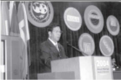
ရန်ကုန် အောက်တိုဘာ ၉

ဘဏ္ဍာရေးနှင့်အခွန်ဝန်ကြီးဌာနဝန်ကြီး ဗိုလ်ချုပ်လှထွန်း ခေါင်းဆောင်သောမြန်မာကိုယ်စားလှယ်အဖွဲ့သည် အမေရိကန်ပြည်ထောင်စု ဝါရှင်တန် ဒီစီတွင် အောက်တိုဘာ ၁ ရက်မှ ၄ ရက်အထိကျင်းပသည့် ၂၀၀၄ခုနှစ် ကမ္ဘာ့ဘဏ်နှင့် အပြည်ပြည်ဆိုင်ရာ ငွေကြေးရန်ပုံငွေ အဖွဲ့ တို့၏ (၅၉)ကြိမ်မြောက် နှစ်စဉ်လည်အစည်းအဝေးသို့ တက်ရောက်ရန်ပြီးနောက် အောက်တိုဘာရက် ညပိုင်းက လေကြောင်းခရီးဖြင့် ရန်ကုန်မြို့သို့ ပြန်လည်ရောက်ရှိလာသည်။