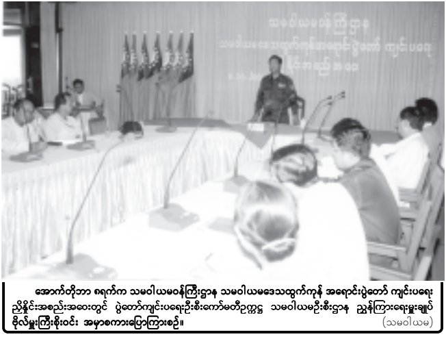
အောက်တိုဘာ ၈ရက်က သမဝါယမဝန်ကြီးဌာန သမဝါယမဒေသထွက်ကုန် အရောင်းပွဲတော် ကျင်းပရေး ညှိနှိုင်းအစည်းအဝေးတွင် ပွဲတော်ကျင်းပရေးဦးစီးကော်မတီဥက္ကဋ္ဌ သမဝါယမဦးစီးဌာန ညွှန်ကြားရေးမှူးချုပ် မိုင်းနောင်မြို့နယ်မှ မိုင်းနောင်မြို့အစိုးရအဖွဲ့အစည်းများက တက်ရောက်၍ အမှာစကားပြောကြားစဉ်။ (သမဝါယမ)