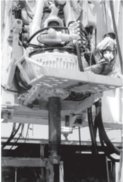
ရဲတံခွန် ကမ်းလွန်ရေနံနှင့် သဘာဝဓာတ်ငွေ့ထွင်းတူးစဉ်မှ ဝန်ထမ်းများ၏ လုပ်ငန်းခွင်မြင်ကွင်း။

တွင်းတူးစဉ်မှ ထုတ်လုပ်ပေးသော သဘာဝဓာတ်ငွေ့များကို ရေနံလေဆီလုံးဝ မပါဝင်ရလေအောင် အအေးခံခြင်း၊ အပူပေးခြင်း အဆင့်ဆင့်ကို ဆောင်ရွက်ပြီး လိုအပ်သည့်မီအားကိုရရှိအောင် မီအားမြှင့်စက်များကို အသုံးပြုကာ