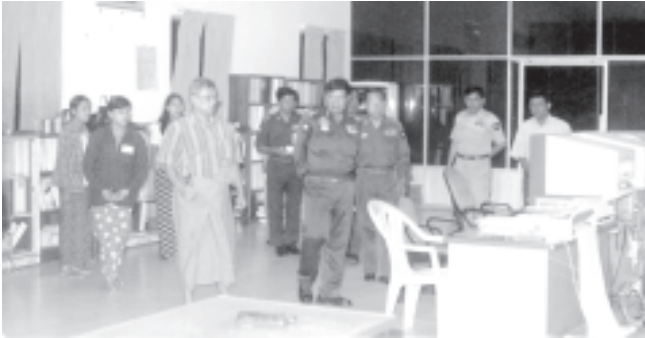
လျှပ်စစ်နှင့်စက်သုံးဆီသုံးစွဲမှု ကြီးကြပ်စစ်ဆေးရေးကော်မတီဥက္ကဋ္ဌ နိုင်ငံတော်အေးချမ်းသာယာရေးနှင့်ဖွံ့ဖြိုးရေးကောင်စီဝင် တပ်မတော်လေ့ကျင့်ရေးအရာရှိချုပ် ဒုတိယဗိုလ်ချုပ်ကြီးကျော်ဝင်း အလုံအကန်အားပေးစက်ရုံများသို့သွားရောက်၍ လျှပ်စစ်သုံးစွဲမှုကို ကြည့်ရှုစစ်ဆေးစဉ်။ (သတင်းစဉ်)