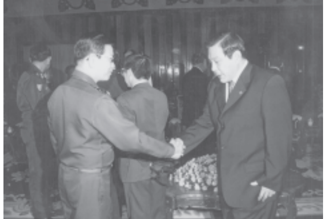
ပြည်ထောင်စုမြန်မာနိုင်ငံတော် နိုင်ငံတော်ဝန်ကြီးချုပ် ဗိုလ်ချုပ်ကြီးခင်ညွန့်၊ မြန်မာနိုင်ငံက အိမ်ရှင်နိုင်ငံအဖြစ် လက်ခံကျင်းပသည့် လယ်ယာစိုက်ပျိုးရေးနှင့် သစ်တောဆိုင်ရာ အာဆီယံဝန်ကြီးများ၏ (၂၆)ကြိမ်မြောက် အစည်းအဝေးနှင့် လယ်ယာစိုက်ပျိုးရေးနှင့် သစ်တောဆိုင်ရာ အာဆီယံဝန်ကြီးများနှင့် အရှေ့အာရှဆွေးနွေးဗဟိုသုံးနိုင်ငံတို့၏ စတုတ္ထအကြိမ်မြောက် အစည်းအဝေးသို့ တက်ရောက်လျက်ရှိကြသော ဝန်ကြီးများ၊ ဒုတိယဝန်ကြီးများအား ရန်ကုန်မြို့ ကုန်းမြင့်သာရှိ ဓဇျာသီရိမိမာန်ခန်းမတွင် ရင်းရင်းနှီးနှီးနှုတ်ဆက်ခဲ့ပါသည်။