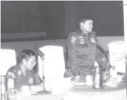
ရန်ကုန် အောက်တိုဘာ ၈

သို့မှလည်း အနာဂတ်ပညာရေး၏ အားကောင်းမှုများဖြင့် အေးချမ်း သာယာပြီး ခေတ်မီဖွံ့ဖြိုးတိုးတက်သည့် နိုင်ငံတော်ကို တည်ဆောက်နိုင်မည် ဖြစ်ကြောင်း၊ နိုင်ငံသားများ၏ အသိပညာ၊ အတတ်ပညာနှင့် ဆင်မြင်လို တရားများ အဆင့်အတန်းရှိရှိမြှင့်မောင်းလာမှသာ နိုင်ငံတော်ကို တည်ဆောက် ထိန်းသိမ်းနိုင်မည်ဖြစ်သကဲ့သို့ ဗြဟ္မစိုရ်တရားနှင့် လောကပါလတရားများ ကိုအခြေခံသော စစ်မှန်သည့်ဒီမိုကရေစီ လူနေမှုဘဝကိုလည်း ထူထောင် စောင့်ရှောက်နိုင်မှာ သေချာပါကြောင်း။