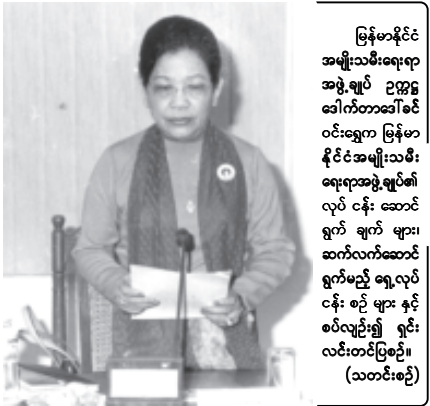
မြန်မာနိုင်ငံ အမျိုးသမီးရေးရာ အဖွဲ့ချုပ် ဥက္ကဋ္ဌ ဒေါက်တာဒေါ်ခင်ဝင်းက မြန်မာနိုင်ငံအမျိုးသမီးရေးရာအဖွဲ့ချုပ်၏ လုပ်ငန်းဆောင်ရွက်ချက်များကို ရှင်းလင်းတင်ပြနေသည်။ (သတင်းစဉ်)

၂၀၀၄ခုနှစ် စက်တင်ဘာလထိ ပြည်နယ်၊ တိုင်း အမျိုးသမီးရေးရာအဖွဲ့များနှင့် ဝန်ကြီးဌာနများမှ ပေးပို့လာသော စာရွက်အများအပြား အမျိုးသမီးရေးရာအဖွဲ့ဝင်အား ၁၃၅၁၇၃၉၂၅ ဖြစ်ပါကြောင်း။