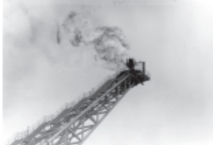
ရဲတံခွန်မှ ပို့လွှတ်သောဓာတ်ငွေ့များ စီးပွားသင်္ဘောတို့ ဤသို့တွေ့ရသည်။

ရဲတံခွန်မှ ထွက်ရှိသော သဘာဝဓာတ်ငွေ့များကို ထိုင်းနိုင်ငံ Petroleum Authority of Thailandနှင့် စာချုပ်ချုပ်ဆိုပြီး ၂၀၀၀ပြည့်နှစ် ဧပြီလမှစတင်၍ ဂျပန်မပိုင်လိုင်းသွယ်တန်းကာ ရောင်းချလျက်ရှိသည်။ ယခု အခါ နေ့စဉ် သဘာဝဓာတ်ငွေ့ ကုပပေးသန်း ၃၀၀ကို ပို့လွှတ်နေသည်။ ရဲတံခွန်မှ သဘာဝဓာတ်ငွေ့ထုတ်လုပ်နိုင်သော ပမာဏမှာ ၄၁၁၈ ၁၆ထရီယံကုပပေးသန်း ရေနံစိမ်းအပေါ့စား ထုတ်လုပ်နိုင်သော ပမာဏမှာ စည်ပေါင်း ၈၄ ၁၁၁၁၁၁၁ ဖုန်း ရှိသည်။