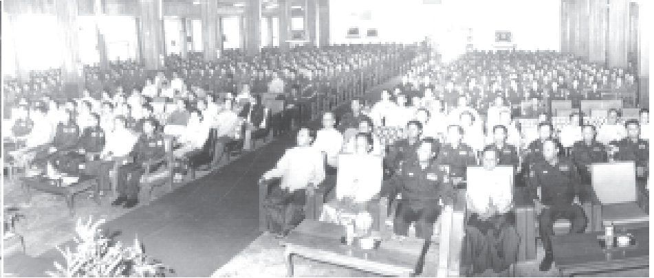
● ကျောင့်မှ

အဆိုပါ သင်တန်းဆင်းအခမ်းအနားသို့ ရန်ကုန်တိုင်းအေးချမ်းသာယာရေးနှင့်ဖွံ့ဖြိုးရေးကောင်စီ ဥက္ကဋ္ဌ ရန်ကုန်တိုင်းစစ်ဌာနချုပ် တိုင်းမှူး ဗိုလ်ချုပ်မြင့်ဆွေ၊ အစိုးရအဖွဲ့ အဖွဲ့ဝင်ဝန်ကြီးများ၊ ရှေ့နေချုပ်၊ စာရင်းစစ်ချုပ်၊ ဝန်ထမ်းရွေးချယ်လေ့ကျင့်ရေးအဖွဲ့ဥက္ကဋ္ဌ၊ ရန်ကုန်မြို့တော်ဝန်၊ ဒုတိယ