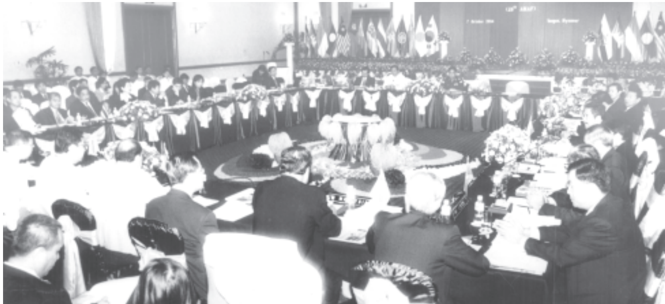
မြန်မာနိုင်ငံက အိမ်ရှင်နိုင်ငံအဖြစ် လက်ခံကျင်းပသည့် လယ်ယာစိုက်ပျိုးရေးနှင့်သစ်တောဆိုင်ရာ အာဆီယံဝန်ကြီးများ၏ (၂၆)ကြိမ်မြောက် အစည်းအဝေးကို ရန်ကုန်မြို့ ဆီဒုံးနားဟိုတယ်ခန်းမ၌ ကျင်းပစဉ်။