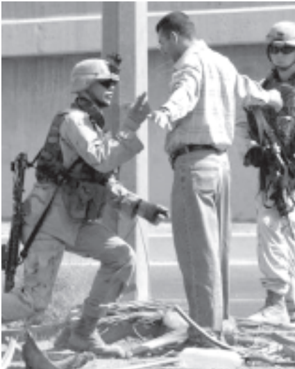
ဘဂ္ဂဒဒ်မြို့ အစိမ်းရောင်နယ်မြေအနီး ကားခုံးပေါက်ကွဲမှု ဖြစ်ပွား သည့်နေရာတွင် အီရတ်တပ်ဦးအား ရှာဖွေစစ်ဆေးနေသော အမေရိကန် တပ်ဖွဲ့ဝင်များကို အောက်တိုဘာ ၄ရက်က ဖွဲ့စည်း

အမွန် အောက်တိုဘာ ၆ အီရတ်နိုင်ငံမှ ရှေးဟောင်းပစ္စည်းများကို ရှောင်ခိုက်ခံရမှု အကောက်ခွန် အမှုထမ်းများက ဖမ်းဆီးမိကြောင်း ရှောင်ခိုက်ခံရမှုမြင်သကြားသတင်းဌာနက တနင်္ဂနွေနေ့တွင် ထုတ်လွှင့်ဖော်ပြခဲ့သည်။