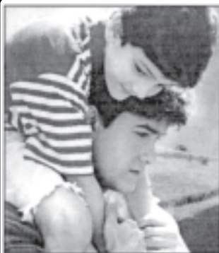
Akele Hum Akele Tum