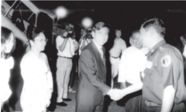
ဗီယက်နမ်နိုင်ငံ ဟန့်ဗီးမြို့၌ ကျင်းပသည့် အာဆီယံကုန်စည်ပြပွဲ-၂၀၀၄ ဖွင့်ပွဲအခမ်းအနားသို့ တက်ရောက်ခဲ့သော စီးပွားရေးနှင့် ကူးသန်းရောင်းဝယ်ရေးဝန်ကြီးဌာန ဒုတိယဝန်ကြီး ဗိုလ်မှူးချုပ်အောင်ထွန်းခေါင်းဆောင်သော မြန်မာကိုယ်စားလှယ်အဖွဲ့၊ လေကြောင်းခရီးဖြင့် ပြန်လည်ရောက်ရှိရာ ရန်ကုန်အပြည်ပြည်ဆိုင်ရာလေဆိပ်တွင် ကြိုဆိုနှုတ်ဆက်သူများနှင့်အတူ ဖော်ပြရပါသည်။ (သတင်းစဉ်)