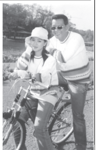
ရင်ခုန်သံအရင်းနှီးဆုံးဇာတ်ကားမှ ဒွေးနှင့်အိန္ဒြာကျော်စင်