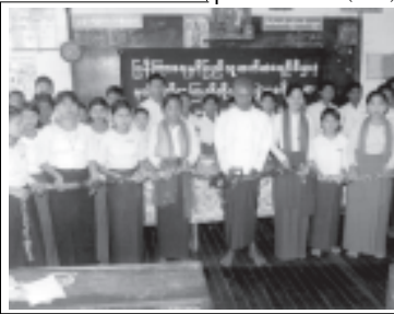
မြန်မာနိုင်ငံရေကြောင်းပညာတက္ကသိုလ် သီလဝါ သန်လျင်မြို့နယ် ရန်ကုန်တိုင်းသို့ လူကိုယ်တိုင်ဖြစ်စေ၊ စာတိုက်မှဖြစ်စေ အရောက် ရှိရမည်ဖြစ်သည်။