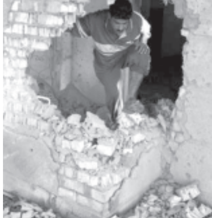
ဖော်လူဂျာမြို့အား အမေရိကန်တပ်ဖွဲ့ဝင်များက လေကြောင်းမှတိုက်ခိုက် မှုကြောင့် ပျက်စီးသွားသောအိမ်တစ်လုံးကို အောက်တိုဘာ ၃ရက်က ဖော် ရခဲ့သည်။

ကြောင်း ဖော်လူဂျာမြို့နေလူထုက မကျေမနပ် ပြောဆိုခဲ့ကြသည်။ အမေရိကန်တိုက် လေကြောင်း မှနေ၍ ယခုနောက်ဆုံးတိုက်ခိုက်ရာ၌ သေဆုံးခဲ့ရ သော အရပ်သားများတွင် အမျိုးသမီးများနှင့်ကလေး ငယ်များပါဝင်ကြောင်း ကမ္ဘာ့တာဝန်ရှိသူများ က ပြောကြားကြပြီး ဖော်လူဂျာဒေသခံများက လည်း အကြမ်းဖက်သမားများမဟုတ်ကြသော အရပ်သားများ အမေရိကန်တိုက်လေကြောင်းထိမှန်သေဆုံးမှုများကို ဝန်ကြီးချုပ် အာလာဘီ စီနီဇီခေါ်ခဲ့ကြသည်။ အိမ်အင်အာရီကတာ