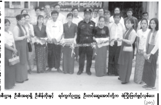
စက်တင်ဘာ ၂၄ ရက်က လမ်းမတော် ဖွဲ့နွဲ့မှု အဖွဲ့မှ လုပ်ကွက် အေးချမ်းသာယာရေးနှင့် ဖွံ့ဖြိုးရေး ကော်မတီ၏ အဖွဲ့ဝင်များနှင့် ကျန်းမာရေး ဦးစီးဌာနမှူး၊ ခရိုင်ကျန်းမာရေးဦးစီးဌာနမှူး၊ မြို့နယ် ကျန်းမာရေး ဦးစီးဌာနမှူး၊ တာဝန်ခံ ဆရာဝန်များ၊ လက်ထောက်ဆရာဝန်များ စုစုပေါင်း ၃၄၉ ဦး တက်ရောက်ကြကြောင်း သတင်းရရှိသည်။ (သတင်းဧည့်)

Matrices and Determinants (သင်္ချာ၊ စီးပွားရေး၊ စီးပွားစီမံ)