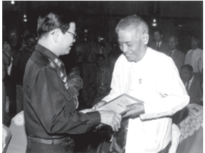
မြန်မာနိုင်ငံပညာရေးကော်မတီဥက္ကဋ္ဌ နိုင်ငံတော်ဝန်ကြီးချုပ် ဗိုလ်ချုပ်ကြီးခင်ညွန့် ၂၀၀၄ခုနှစ် ကမ္ဘာဆရာများနေ့တွင် ဂုဏ်ပြုခံ ဂုဏ်ထူးဆောင်ဆရာကြီး အခြေခံပညာဦးစီးဌာန ညွှန်ကြားရေးမှူးချုပ် (အငြိမ်းစား) ဦးသန်းဦးအား ဂါရဝပြုကာ ဂုဏ်ပြုပွဲတစ်လွှားပေးအပ်စဉ်။ (မြန်မာ့အသံ)