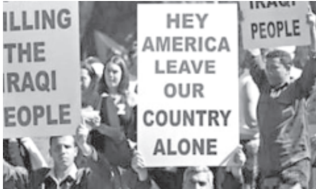
ဩစတြေးလျနိုင်ငံ အစိုးရဖြူတွင် အီရတ်နိုင်ငံ အား အမေရိကန်နှင့်အပေါင်းပါတပ်ဖွဲ့များ ဆက်လက် ကျူးကျော်ထားမှုအား ဆန့်ကျင် ဆန္ဒပြနေသည့်အား အောက်တိုဘာ ၃ရက်က ဖော်ပြရခြင်း။