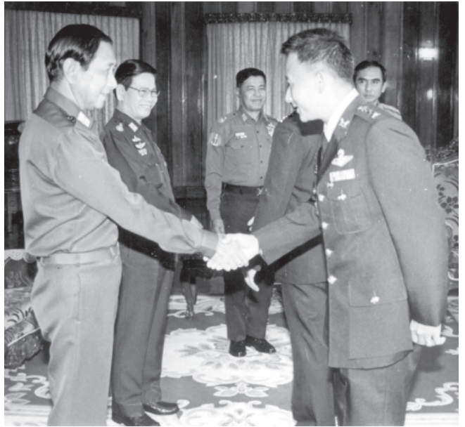
အောက်တိုဘာ ၅ ရက်က ပြည်ထောင်စုမြန်မာနိုင်ငံတော် နိုင်ငံတော်အေးချမ်းသာယာရေးနှင့်ဖွံ့ဖြိုးရေး ကောင်စီဒုတိယဥက္ကဋ္ဌ ဒုတိယတပ်မတော်ကာကွယ်ရေးဦးစီးချုပ် ကာကွယ်ရေးဦးစီးချုပ်ကြီး(ကြည်း) ဒုတိယဗိုလ်ချုပ်မှူးကြီး မောင်အေး ပြည်ထောင်စုမြန်မာနိုင်ငံတော်ဆိုင်ရာ ထိုင်းနိုင်ငံစစ်သံမှူးအသစ်အဖြစ် တာဝန်ထမ်းဆောင်မည့် Colonel Prissava Suwanatatt အား ရန်ကုန်မြို့ ကုန်းမြင့်သာရှိ ဓမ္မဃာသီရိဗိမာန်ခန်းမတွင် နှုတ်ဆက်စဉ်။ (သတင်း-ရှေ့ဖုံး) (သတင်းစဉ်)

အဆိုပါ ညှိနှိုင်းအစည်းအဝေးသို့ အရွယ်မရောက်သေးသူ ကလေးသူငယ် များအား စစ်မှုထမ်းခြင်းမှ ကာကွယ် တားဆီး ထိန်းသိမ်းရေးကော်မတီဝင် များဖြစ်ကြသည့် နိုင်ငံခြားရေးဝန်ကြီး ဌာန ဝန်ကြီးဦးဉာဏ်ဝင်း၊ ပြည်ထောင်စု ဝန်ကြီးဌာနဝန်ကြီးဗိုလ်မှူးကြီးတင်လွင်၊ လူမှုဝန်ထမ်း၊ ကယ်ဆယ်ရေးနှင့် ပြန်လည်နေရာချထားရေးဝန်ကြီးဌာန ဝန်ကြီးဗိုလ်ချုပ်စိန်ကွမ်း၊ အလုပ်သမား ဝန်ကြီးဌာန ဝန်ကြီးဦးတင်ဝင်း၊ ဒုတိယ တပ်မတော်လေ့ကျင့်ရေးအရာရှိချုပ် ဗိုလ်ချုပ်အောင်ကြည်နှင့် ဒုတိယတရား သူကြီးချုပ်ဦးသိန်းစိုး၊ ဒုတိယရေနေ ချုပ် ဦးမြင့်နိုင်၊ ကာကွယ်ရေးဝန်ကြီး ဌာန စစ်ရေးချုပ်ရုံးမှ ဗိုလ်မှူးချုပ် ဌေးသိန်း၊ နိုင်ငံတော်အေးချမ်းသာယာ ရေးနှင့် ဖွံ့ဖြိုးရေးကောင်စီရုံးမှ တာဝန်ရှိ ပုဂ္ဂိုလ်များနှင့် ဌာနဆိုင်ရာအကြီး အကဲများ တက်ရောက်ကြသည်။