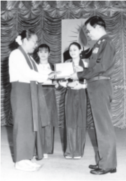
စာမျက်နှာ ၅ မှ

ထို့ကြောင့် ယခု၂၀၀၄ခုနှစ် ကမ္ဘာ့ဆရာများနေ့၏ဆောင်ပုဒ်ဖြစ်သည့် “အရည်အချင်းပြည့်ဆုံဆရာများဖြင့် ပညာရေးအရည်အသွေးကိုမြှင့်တင်အောင်” ဆိုသည့် ဆောင်ပုဒ် အကောင်အထည်ဖော်ဆောင်ရွက်ရေးအတွက် မြန်မာနိုင်ငံအနေနှင့် ရေခဲကောင်း၊ မြေခဲကောင်း အခြေခံကောင်းတွေရှိထားပြီးဖြစ်သည်ဟု ပြောကြားလိုကြောင်း။